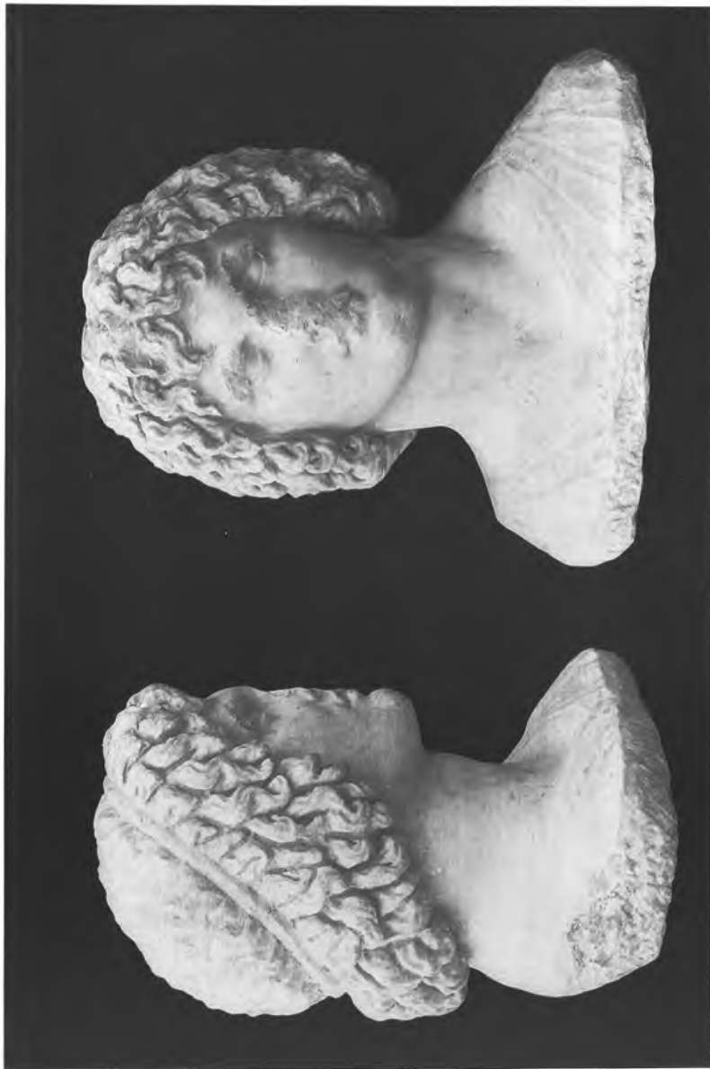
ΚΕΦΑΛΗ ΕΞ ΕΛΕΥΣΙΝΟΣ