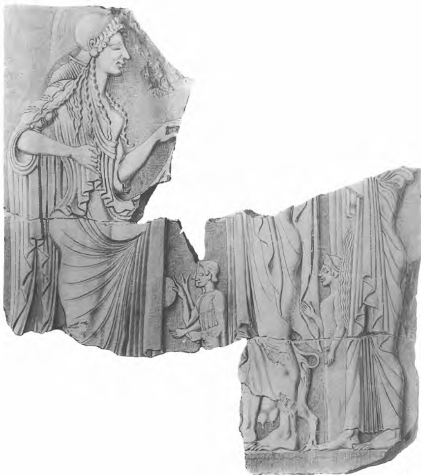
ΑΝΑΓΛΥΦΟΝ ΕΞ ΑΚΡΟΠΟΛΕΩΣ