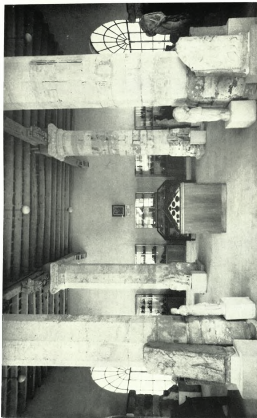
Κρήτη. Ρέθυμνον: Ἄπολις τοῦ Μουσείου μετὰ τῆς νέας ἐργασίας ἐκθέσεως