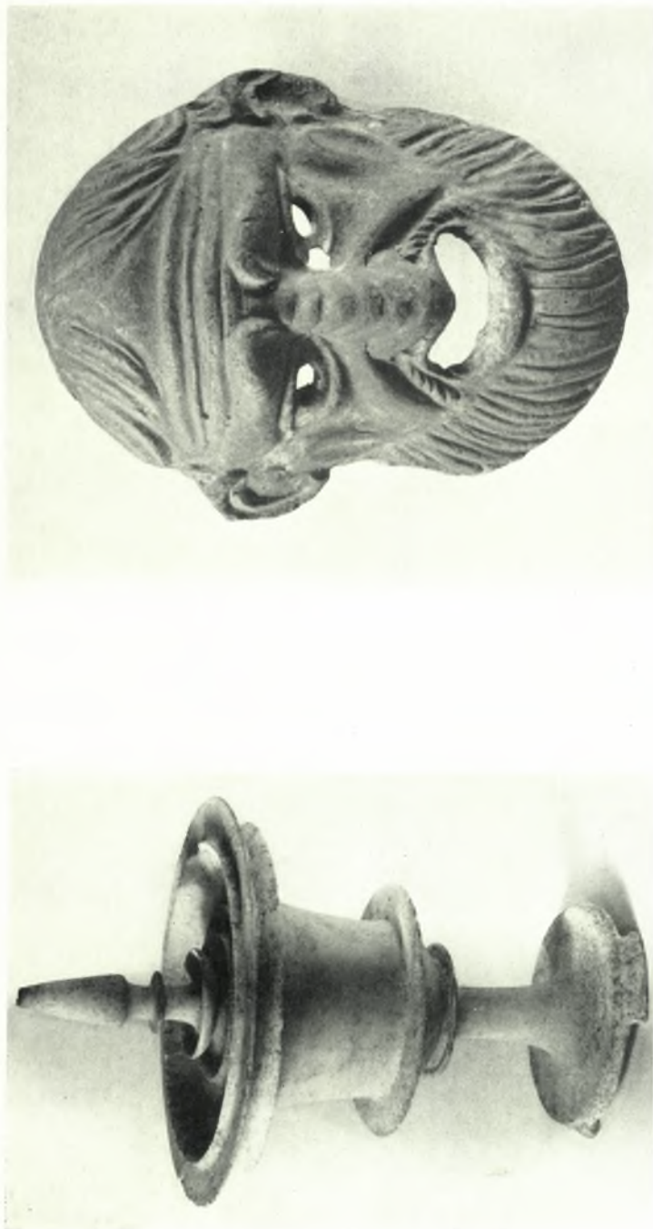
Κρήτη, Συλλογή Μεταξά: α. Άλαβαστρίνη πυξίς ἐξ Ἀρκάδων, β. Πηλίνη μάσκα ἐξ Ἁγίου Νικολάου