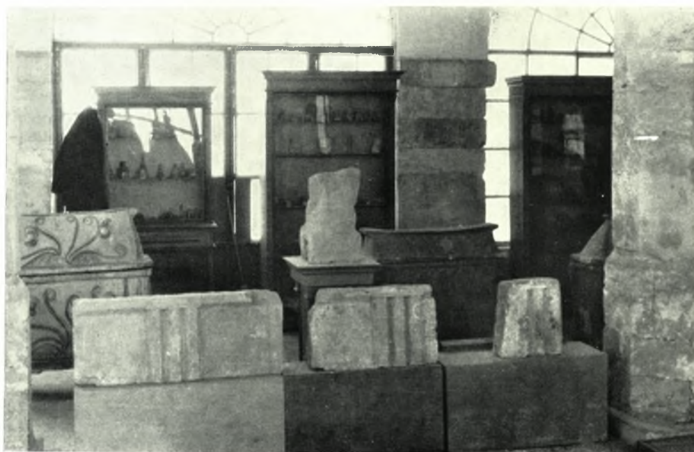
Κρήτη. Ρέθυμνον: α - β. Ἀπόψεις τοῦ Μουσείου πρὸ τῶν νέων ἐργασιῶν ἐκθέσεως