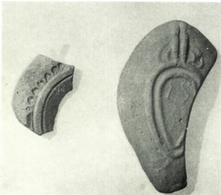
Δέλος. Skardhana: a. Céramique d'époque impériale. b. Un unguentarium de type romain. c. Lampes d'époque impériale