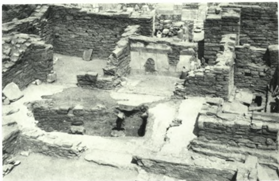
Δέλος. Skardhana: a. Habitation I. Brèche dans le mur Sud, b. Habitation III. La cour et la pièce du Nord