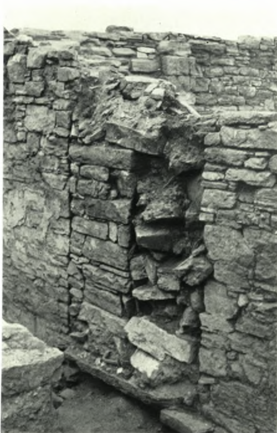
Délos. Skardhana. Habitation I: a. Le mur tardif, b. Le bouchage de la porte