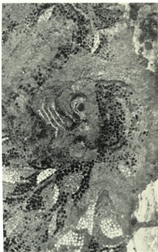
Δέλος. Skardhana: a. Habitation IV. Vue générale de l'œcus à mosaïque, b - c. Détail de la mosaïque