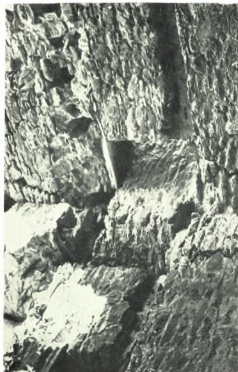
α. Αντιστήριξες δυτικού τοίχου Ἁγ. Βλασίου Βεροίας, β - δ. Γαλατίτσα: β. Ρωγαμί εἰς τὴν τοιχοποιίαν τοῦ μεσαιωνικοῦ πύργου, γ - δ. Τμήμα τοῦ ἐσωτερικοῦ τοῦ πύργου πρὸ καὶ μετὰ τῆς ἐργασίας