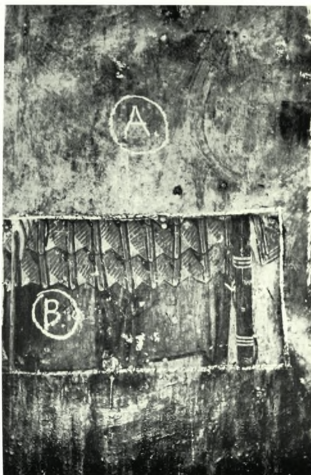
Βέροια: α. Ἅγ. Ἰωάννης ὁ Θεολόγος. Δεῖγμα καθαρισμοῦ τῶν τοιχογραφιῶν, β. Ἅγ. Γεώργιος. Δεῖγμα καθαρισμοῦ τῶν τοιχογραφιῶν