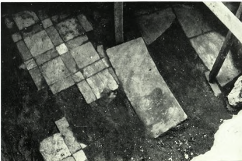
Θεσσαλονίκη. Οικόπεδον Ἡ. Βακούρα: α. Ἡ ἀψίς τοῦ ἱεροῦ βήματος τῆς παλαιοχριστιανικῆς βασιλικῆς, β. Τὸ ἐσωτερικόν τῆς ἀψίδος, γ. Λεπτομέρεια τοῦ δαπέδου