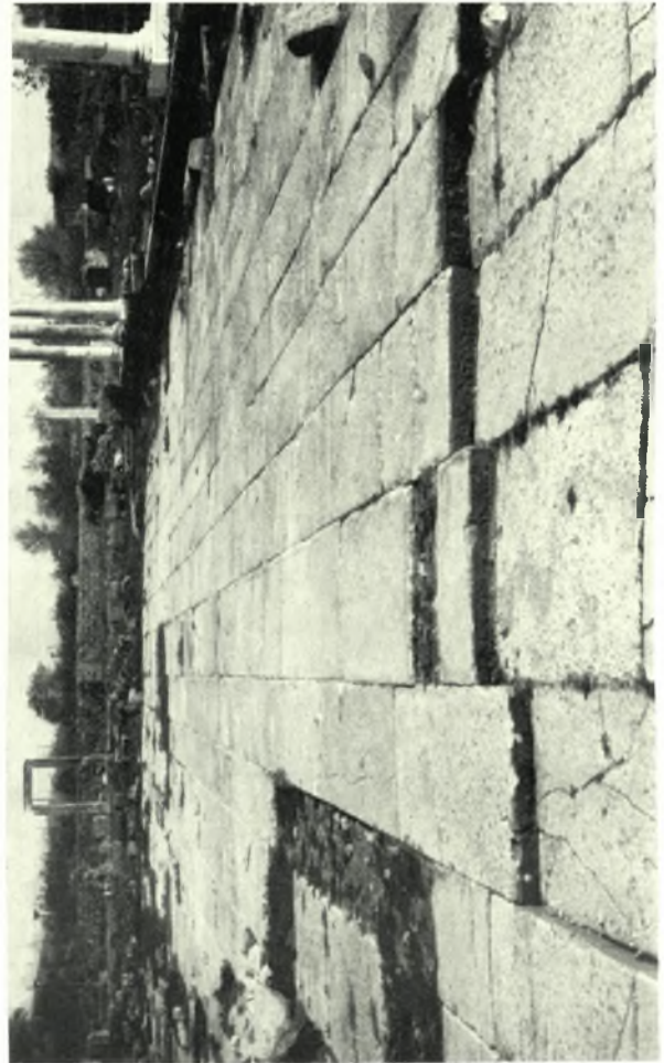
α. Ἀνάγλυφον ἐφήππου ἀνδρός ἐκ Νέου Σκοποῦ ( Σερρών ), β. Βυζαντινὰ κιονόκρανα διαφόρων τύπων, ὅπως ἐκτιθενται εἰς τὸ Μουσεῖον Φιλίππων, γ. Ἀποκατάστασις τῆς πλακοστρώσεως τοῦ Forum Φιλίππων