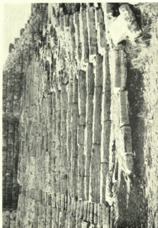
Ἡπειρος, Δαδώνη: α. Τὸ δυτικὸν ἀνάκλιμα τοῦ κοίλου τοῦ θεάτρου μετὰ τὴν ἀναστήλωσιν, β. Ὁ ΒΔ. πύργος τοῦ ἀνακλήματος τῆς προσόψεως, γ. Τὰ συντηρηθέντα ἐδῶλια τοῦ σταδίου, δ. Ἐδῶλια καὶ ΒΔ. πύργος πρὸ τῶν ἐργασιῶν ἀναστήλωσεως