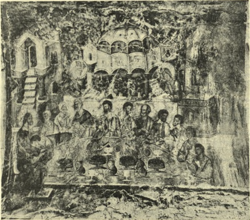
Εἰκ. 1. Σχήματα διαφόρων ἐπιτραπεζίων σκευῶν. Ἐκ τοιχογραφίας τῆς Περιβλέπτου τοῦ Μυστρᾶ, ΙΔ'. αἰῶνος, παριστανούσης τὸν μυστικὸν δείπνον. (G. Millet, Monuments Byzantins de Mistra πίν. 120,).

Ἐφ' ὅσον δὲ ὑπὸ τῶν Βυζαντινῶν δὲν μνημονεύονται περόνια, φυσικὰ περὶ τὸν εἶναι νὰ ζητήσῃ τις καὶ ἐκ τίνος ὕλης ταῦτα κατασκευάζοντο.