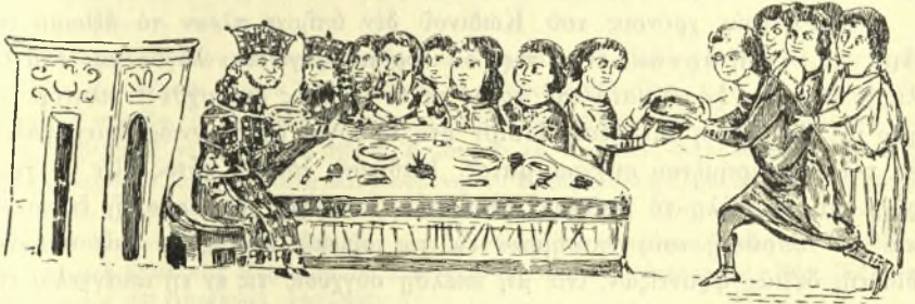
Εἰκ. 8. Οἱ τοῦ τραπέζιου τοῦ βασιλέως ὑπηρετοῦντες ἐν ἐπίσημῳ γεύματι. Ἐκ Σλαωνικοῦ χειρογράφου τῆς Βατικαν. Βιβλιοθήκης. (G. Schlumberger, Nicéphore Phocas σ. 343).

Γεώργιος ὁ Κωδινὸς μᾶς πληροφορεῖ ὅτι κατὰ τοὺς χρόνους του ὁ ἐπὶ τῆς τραπέζης εἶχεν ὡς προϊστάμενον τὸν δομέστικον, ὅστις ὑπηρετεῖ μετ' ἐκείνου τοὺς βασιλεῖς καὶ ἄρχοντας κατὰ τὰ γεύματα τὰ ἐπὶ στεφηφορία ἢ γάμοις βασιλέως. Οὗτος κατὰ τὰ Χριστοῦγεννα λαμβάνων προσέφερε τοὺς μίνσους εἰς τοὺς διαφόρους τὴν παράστασιν ἀποτελοῦντας ἄρχοντας, κράζων ἕκαστον αὐτῶν κατὰ τὴν σειρὰν τοῦ ἀξιώματός του 2 . Τέλος ὡς ἀνώτατος θεράπων καθ' ὄρισμένας βασιλικὰς ἐστιάζσεις ἐπὶ τῶν χρόνων τοῦ Κωδινοῦ ἐχρησίμευεν καὶ ὁ μέγας δομέστικος, ὅστις, λαμβάνων τοὺς μίνσους παρὰ