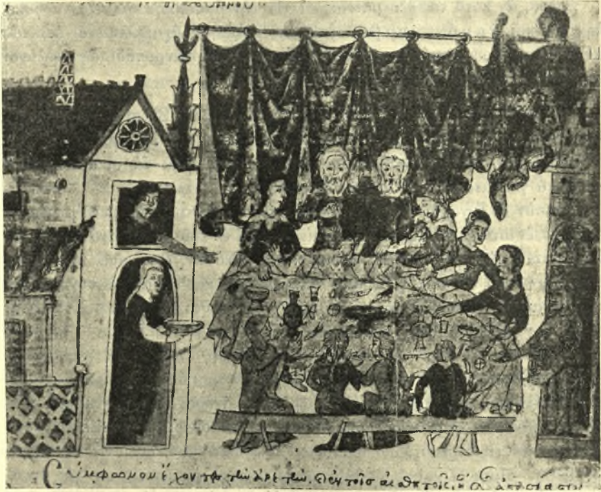
Εἰκ. 3. Οἰκογενειακὸν Βυζαντινὸν γεῦμα.

βεβαιοὶ ὅτι ἐν τῇ αἰθούσῃ τῶν ἰθ' ἀκκουβίτων «convivae non sedendo ut ceteris diebus, sed recumbendo epulantur» 1 , μαρτυρία, ὡς ἐπιβεβαιῶσιν ὅτε Κωνσταντῖνος Πορφυρογέννητος ἐν τῇ ἐκθέσει τῆς βασιλείου τάξεως καὶ ὁ Φιλόθεος ἐν τῷ κλητορολογίῳ του ὁμιλοῦντες κατὰ τὰς ἡμέρας ταύτας περὶ τῶν ἀνακειμένων ἢ ἀνακλινομένων 2 , κατὰ τὰς ἄλλας δὲ