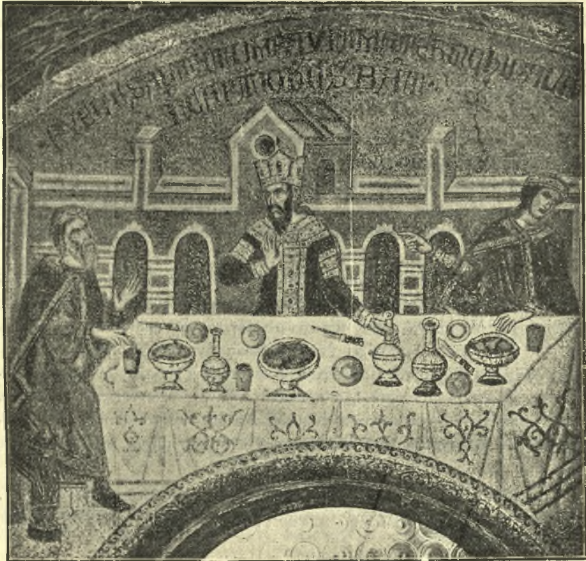
Εἰκ. 2. Πίνακες, πινάκια, ποτήρια καὶ ἐμποτόπουλλα ἐπὶ τῆς τραπέζης τοῦ φαγητοῦ. Ἐκ ψηφιδωτοῦ τοῦ ἀγ. Μάρκου Βενετίας (ΙΓ' αἰ.) ἀπομιμουμένου Βυζαντινὸν βασιλικὸν γεῦμα. (Ch. Diehl, Manuel 2.805.)

κρωντήρια, ἔξ ἧς λέξεως ἐξειλίχθη τὸ σημερινὸν κρ(υ)ωντήρι 1 , πρὸς ὃ ἀντιστοιχεῖ τὸ σημερινὸν Λήμιον κρυγιουκάνατου καὶ ὁ τῆς Σκύρου κρυολόγος 2 , ὡς ψυχριστάρια δ' εἶναι ταῦτα γνωστὰ ἐκ τῆς ἐκθέσεως