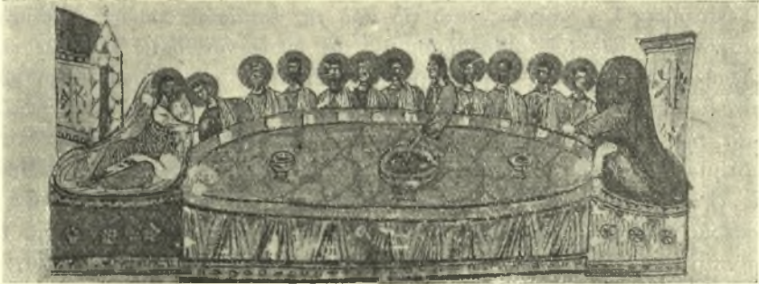
Εἰκ. 4. Συνεστίασις καθεζομένων καὶ ἀνακλιμένων καὶ λήψις τοῦ φαγητοῦ διὰ τῆς χειρὸς. Ἐκ παραστάσεως τοῦ μυστικοῦ δειπνοῦ ἐν Εὐαγγελίῳ τοῦ ΙΑ' αἰ. (Omont, Évangiles avec peintures Byzantines du XI e s. τόμ. Ι πίν. 82).

Καὶ ἂν ἐπεβάλλοντο ὄρισμένοι κανόνες εὐκοσμίας καὶ εὐταξίας κατὰ τὴν ἐστίασιν τῶν κοσμικῶν, φαντάζεται τις ὁποῖα τάξις ἀπηρτεῖτο διὰ τὰς τραπέζας τῶν μοναχῶν. Οἱ πρὸς κοινὴν λοιπὸν ἐστίασιν καθήμενοι μοναχοί, ὑπὸ τὴν ἐποπτείαν τοῦ τραπεζαρίου ἢ «τοῦ τῆς σιωπῆς ἐξάρχου» ἢ, ἐν ταῖς γυναικείαις μοναῖς, τῆς τραπέζαρι ας 4 διατελοῦντες 5 , ὄφειλον πρῶτον