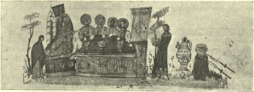
Εἰκ. 5. Παρασκευὴ καὶ μεταφορὰ φαγητῶν εἰς τὴν τράπεζαν.

Αἱ βασιλικαὶ τράπεζαι καὶ ἐκ τῶν προτέρων φυσικὸν εἶναι νὰ δεχθῶμεν ὅτι ἐφορτίζοντο μὲ ποικιλίαν φαγητῶν καὶ σχετικὰς περὶ τούτου μαρτυρίας ἔχομεν. Ὅταν λ.χ. οἱ συγγραφεῖς ὁμιλοῦσι περὶ κουφίσματος τοῦ πρώτου μίνσου 3 , φυσικὸν εἶναι νὰ δεχθῶμεν ὅτι καὶ ἄλλοι ἐπηκολούθουν (ὁ δεῦτερος καὶ ἀναφέρεται) ἀλλὰ καὶ ὠρισμένως διὰ βασιλικά πολυτελεῖα καὶ πολυόψα γεύματα ὁμιλοῦσιν οἱ συγγραφεῖς 4 , ὧν τινες ἔξαιρουσι τὴν σχετικὴν πολυτέλειαν ὠρισμένων βασιλέων. Οὕτως ὁ Ζώσιμος παραδίδει ὅτι ἐπὶ Θεοδο-