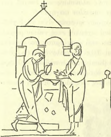
Εἰκ. 6. Ἀπόνιψις, τῆς Βοηθείας χειρνοβοξέστου. Ἐκ Βατικ. κώδ. 752, ΙΑ' αἰ. (J. Tikkanen, Die Psalterillustration im Mittelalter, σ. 137 εἰκ. 131).

εἰπεῖν καὶ ἐκεῖ οἱ παρατιθέμενοι μίσσοι δὲν ἦσαν ὀλίγοι. Δαψιλεστέρα λ.χ. καὶ πολυτελεστέρα τροφή, ἀπαγορευομένου τοῦ κρέατος, παρετίθετο κατὰ τὴν ἡμέραν τῆς ἑορτῆς τοῦ φερωνύμου τῆς μονῆς 1 ἢ κατὰ τὴν ἡμέραν τῆς ἐκλογῆς τοῦ ἡγουμένου 2 ἢ τοῦ Πάσχα 3 , γνωρίζομεν δὲ καὶ ἐκ διαφόρων τυπικῶν ὅτι οἱ μοναχοί, κατὰ μονάς, ἔτρωγον δύο 4 ἢ τριῶν ἢ τεσσάρων ἢ ἐνίοτε καὶ πέντε εἰδῶν φαγητὰ 5 .