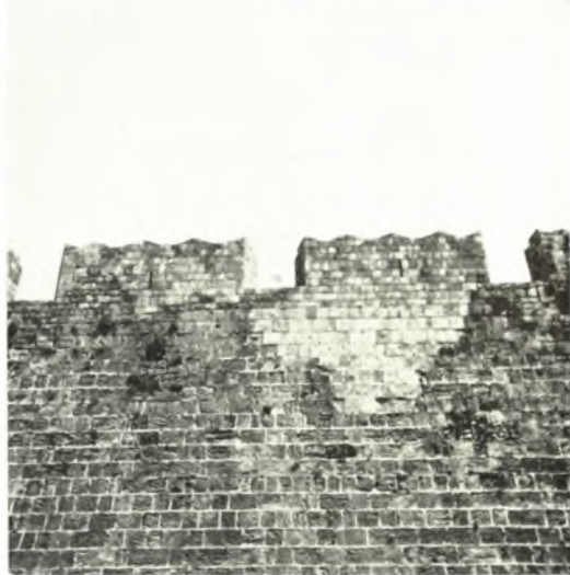
Ρόδος : α. Ἐπισκευὴ τοῦ τοῖχου κατὰ τὸ ἐσωτερικὸν τῆς πύλης D'Amboise, β-γ. Δευτέρα ἐπαλξις ἀπὸ τοῦ προμαχώνος τοῦ Ἁγίου Γεωργίου πρὸς Β. πρὸ καὶ μετὰ τὰς ἐργασίας, δ. Ἡ ἐνάτη καὶ δεκάτη ἐπαλξις ἀπὸ τῆς πύλης D'Amboise μετὰ τὴν ἐπισκευήν, ε-ζ'. Ἡ ἕκτη καὶ ἑβδόμη ἐπαλξις ἀπὸ τῆς πύλης D'Amboise πρὸ καὶ μετὰ τὰς ἐργασίας