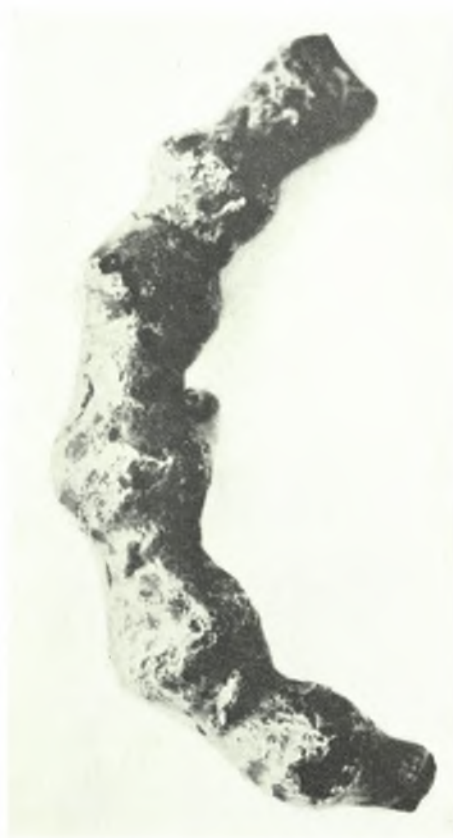
α. Ξυλόγλυπτος μουσάντρα ἐκ Σύμης, β. Ξυλόγλυπτον ἐρμάριον ἐκ Σύμης, γ. Χαλκὴ πόρπη ἐκ Λέρου