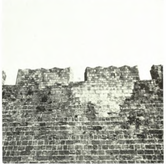
Ρόδος : α. Έπισκευή τοίχου κατά τὸ ἐσωτερικὸν τῆς πύλης D'Amboise, β-γ. Δευτέρα ἐπαλξις ἀπὸ τοῦ προμαχώνος τοῦ Ἁγίου Γεωργίου πρὸς Β. πρὸ καὶ μετὰ τὰς ἐργασίας, δ. Ἡ ἐνάτη καὶ δεκάτη ἐπαλξις ἀπὸ τῆς πύλης D'Amboise μετὰ τὴν ἐπισκευὴν, ε-ζ'. Ἡ ἕκτη καὶ ἑβδόμη ἐπαλξις ἀπὸ τῆς πύλης D'Amboise πρὸ καὶ μετὰ τὰς ἐργασίας