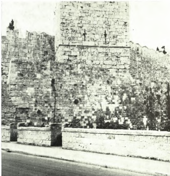
Ρόδος : α - β. Τμήμα του μεσαιωνικού τείχους παρά τον πύργον Heredia πρό και μετά τās έργασίας