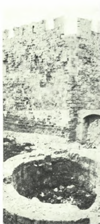
Ρόδος : α - β. Έπισκευασθέν τμήμα τοῦ τείχους παρά τόν λιμένα Ρόδου πρό και μετά τās ἐργασίας, γ - δ. Νοτιοανατολική γωνία τοῦ μεσαιωνικοῦ τείχους παρά τόν ἐμπορικόν λιμένα πρό και μετά τās ἐργασίας