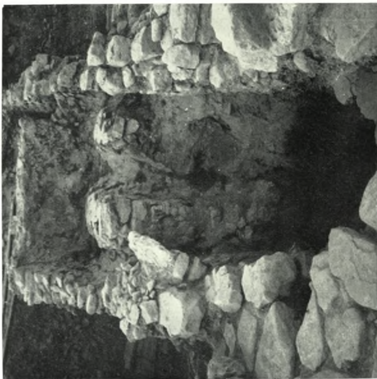
Festòs: a. Forno per pithoi (?) TM presso al muro occidentale del Piazzale I, b. Veduta del Piazzale I, con le Kouloure presso al suo margine, e i saggi sotto al lastricato di terza fase protopalaziale