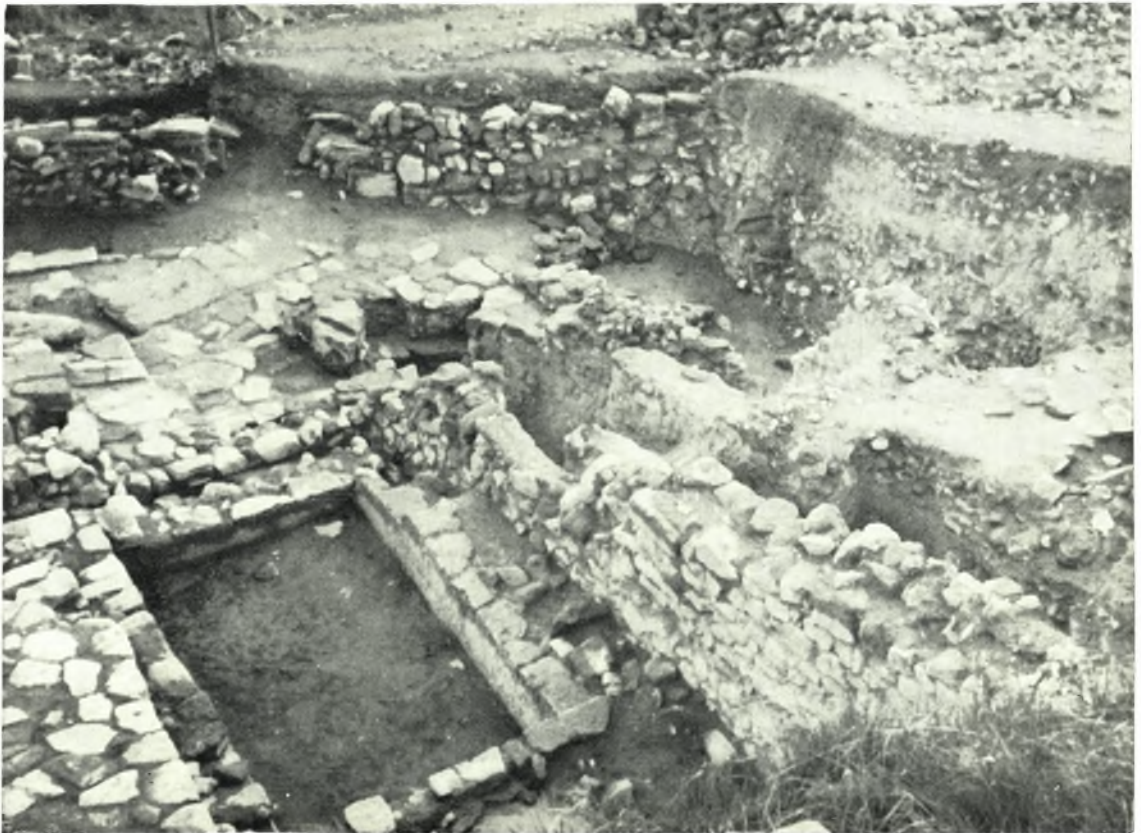
Festòs: a. Suppellettile pavimentale del Vano LXXXIV, b. La vasca minoica, fra la svolta della rampa all'ingresso del Piazzale I e il muro occidentale di bordo del Piazzale