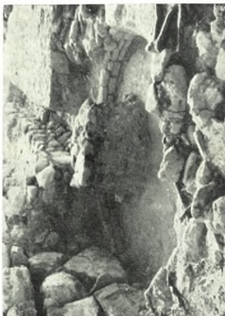
Festòs : a. Saggio sotto al lastricato del Piazzale: teatro il lastricato precedente, e il muro arcuato sottostante. b. Saggio sotto agli ortostati di facciata del Palazzo MM, c. Resti di capanna rotonda calcolitica a Sud del Piazzale Centrale