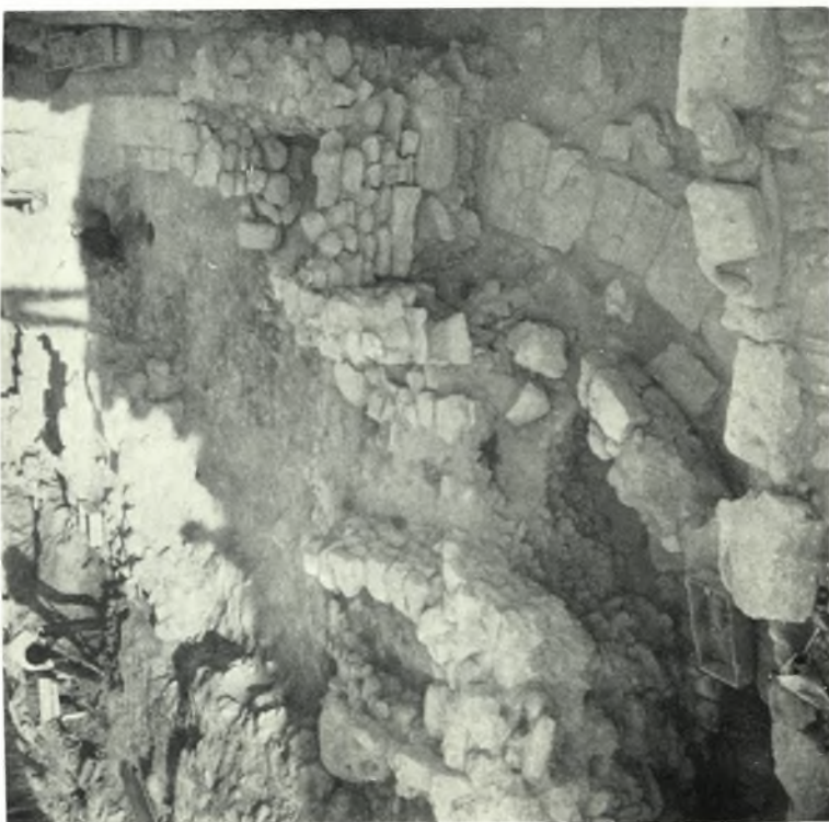
Festós : a. Rampa di seconda fase protopalaziale, con sovrapposto edificio T.M. b. Vani LXXXI - LXXXIV di prima fase protopalaziale, sul margine occidentale del Palazzo minoico