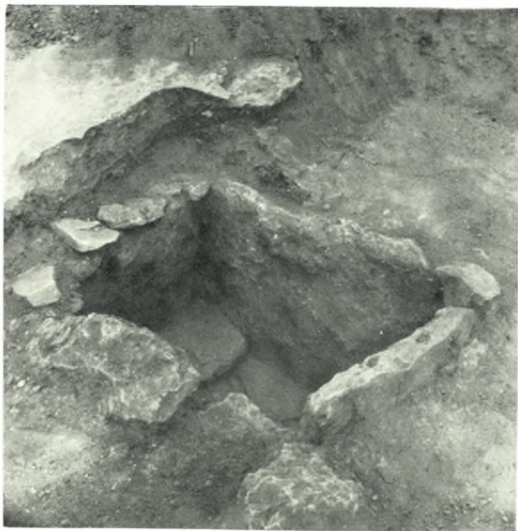
Νάξος. *Αγιασός : α - β. Πρωτοκυκλαδικοί τάφοι