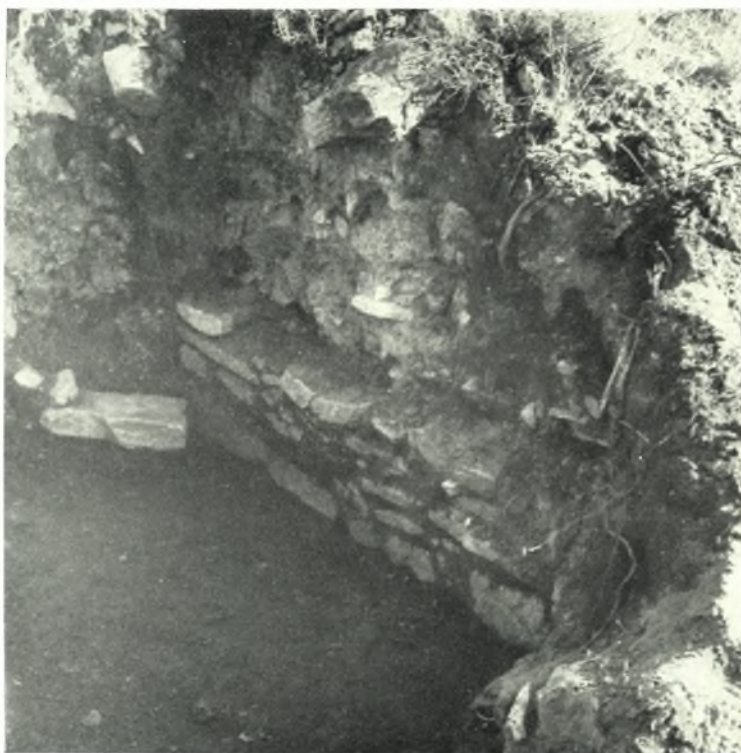
Νάξος. Λυγαρίδια : α. Τάφος εις την Μυκηναϊκὴν οἰκίαν, β. Θαλαμοειδὲς τάφος