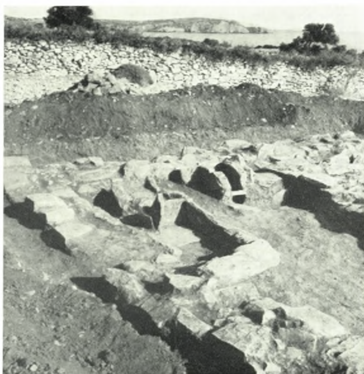
Νάζιος. Λυγαρίδια : α - β. Μυκηναϊκή οίκια καί τμήμα αὐτῆς