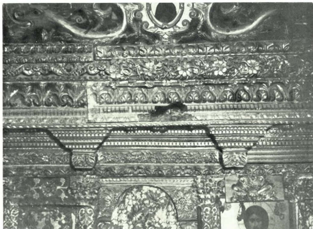
Ίκαρια : α. Καραβόσταμον. Ναός Ἁγίων Πάντων. Λεπτομέρεια τοῦ ξυλογλύπτου τέμπλου, β. Κυπαρίσσι Εὐδήλου. Λεπτομέρεια ξυλογλύπτου τέμπλου