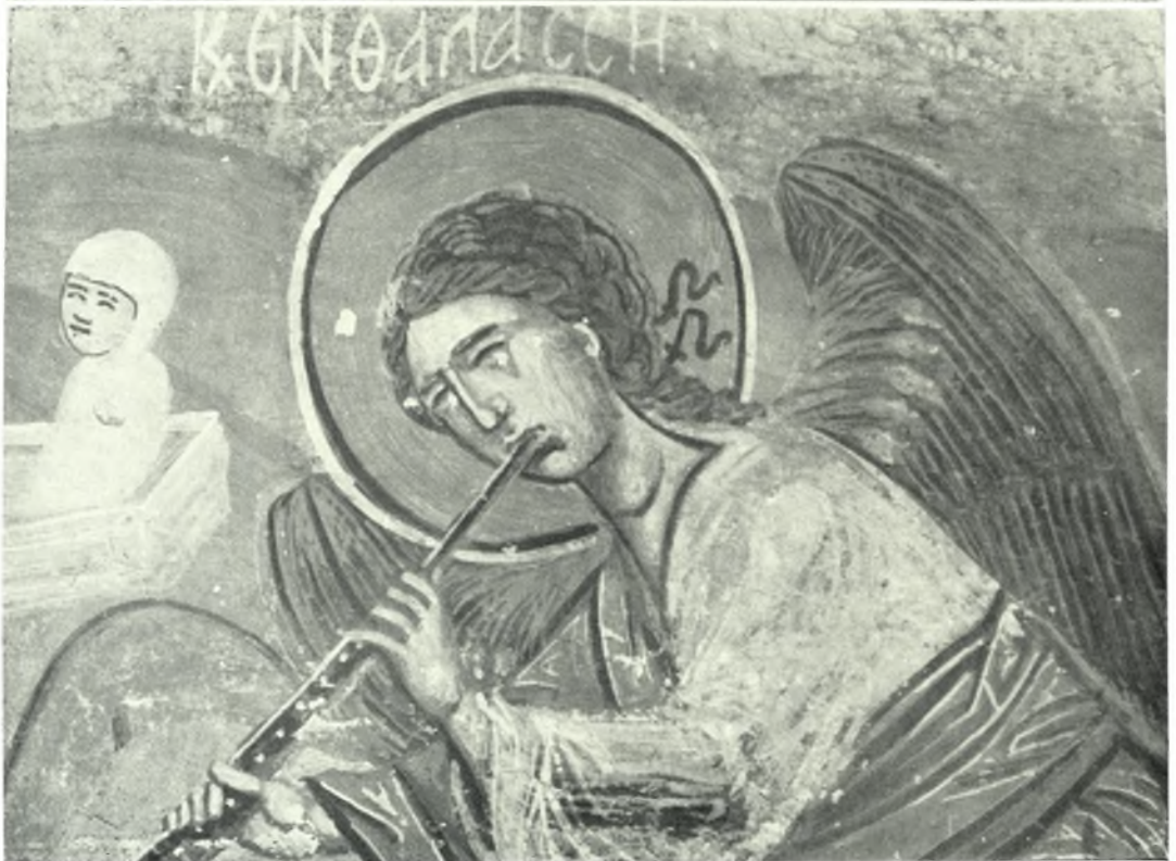
Ίκαρία. Κοσσίκια. Μεταβυζαντινός ναός Ζωοδότου : α - β. Λεπτομέρειαι τών σκηνών τής Δευτέρας Παρουσίας ( τοιχογραφία )