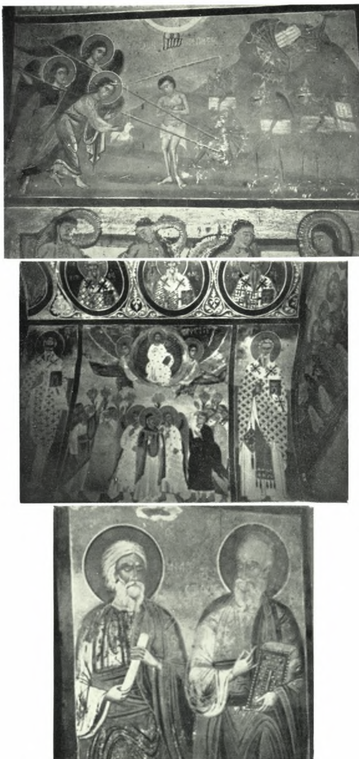
Ίκαρία. Κοσσίκια. Τοιχογραφία ἐκ τοῦ μεταβυζαντινοῦ ναοῦ Ζωοδότου : α. « Ὁ ἀρχιληστής », β. Ἡ Ἀνάληψις καὶ ἅγιοι, γ. Οἱ Ἀπόστολοι Ἄνδρέας καὶ Ἰωάννης