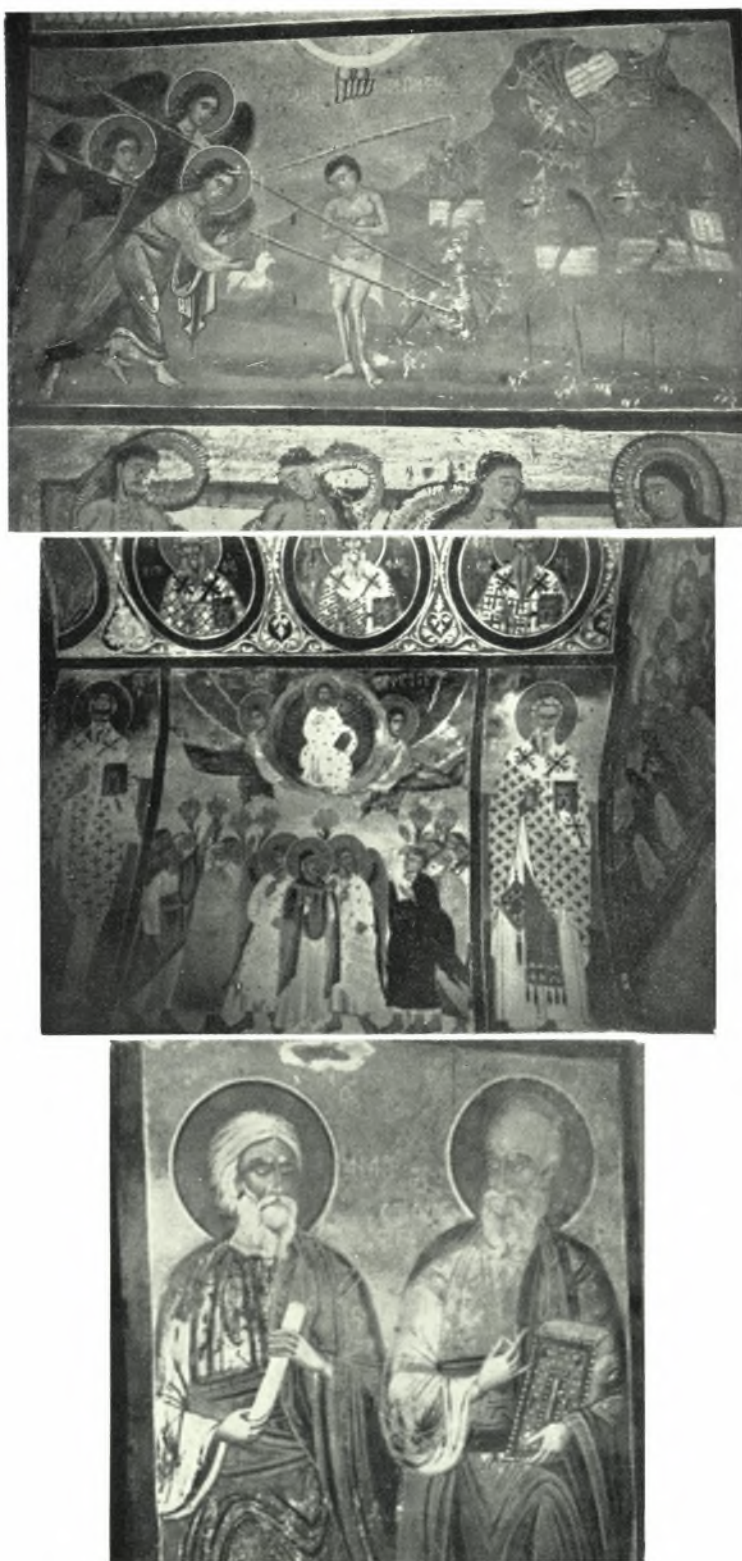
Ίκαρία. Κοσσίκια. Τοιχογραφία ἐκ τοῦ μεταβυζαντινοῦ ναοῦ Ζωοδότου : α. « Ὁ ἀρχιληστής », β. Ἡ Ἀνάληψις καὶ ἅγιοι, γ. Οἱ Ἀπόστολοι Ἀνδρέας καὶ Ἰωάννης