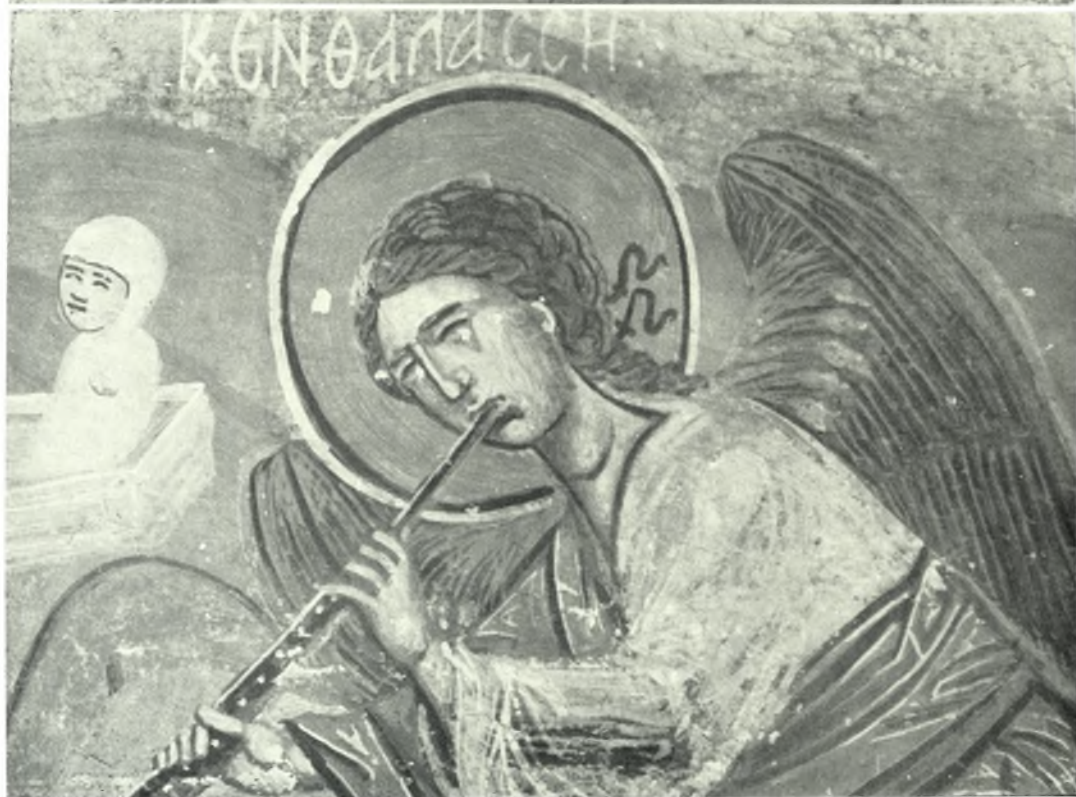
Ίκαρία. Κοσσίκια. Μεταβυζαντινός ναός Ζωοδότου : α - β. Λεπτομέρειαι τῶν σκηνῶν τῆς Δευτέρας Παρουσίας ( τοιχογραφία )