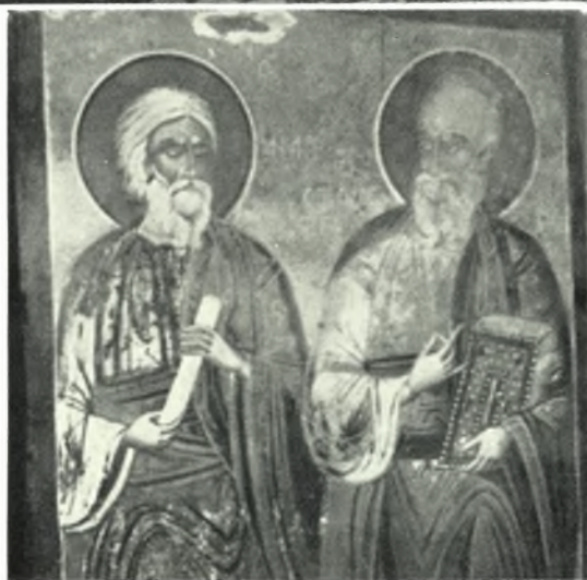
Ίκαρία. Κοσσίκια. Τοιχογραφία ἐκ τοῦ μεταβυζαντινοῦ ναοῦ Ζωοδότου : α. « Ὁ ἀρχιεπίσκοπος », β. Ἡ Ἀνάληψις καὶ ἅγιοι, γ. Οἱ Ἀπόστολοι Ἀνδρέας καὶ Ἰωάννης