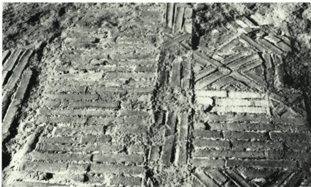
Δίον Πιερίας. Βασιλική Α: α. Τὸ δυτικὸν ἄκρον τῆς σολέας μετὰ τμήματος τοῦ ἐκ πλινθίνων σχεδίων δαπέδου, β. Τμήμα τοῦ δαπέδου τῆς σολέας ἐκ πλινθίων