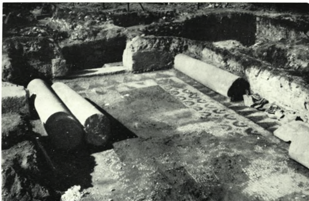
Δίον Πιερίας: α. Τμήμα ψηφιδωτού δαπέδου του κεντρικού κλίτους της Βασιλικής Α, β. Το δάπεδον του βορείου κλίτους της Βασιλικής Β