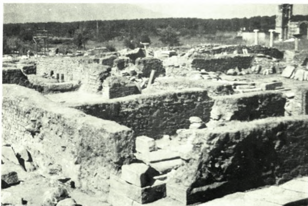
Φίλιπποι: α. Ἡ ἀφαιτηρία τῆς κιονοστοιχίας τῆς κατὰ τὴν δυτ. πλευράν τῶν προπυλαίων στοῦς. Ἐπὶ τοῦ στυλοβάτου καὶ τῶν βάσεων τμήματα καταπεσόντων τόξων, β. Τὸ βόρειον τμήμα τῆς ἐπὶ τῆς ὁδοῦ Ἐγνατίας καθέτου παρόδου καὶ ΒΑ. γωνία τοῦ λουτρῶνος