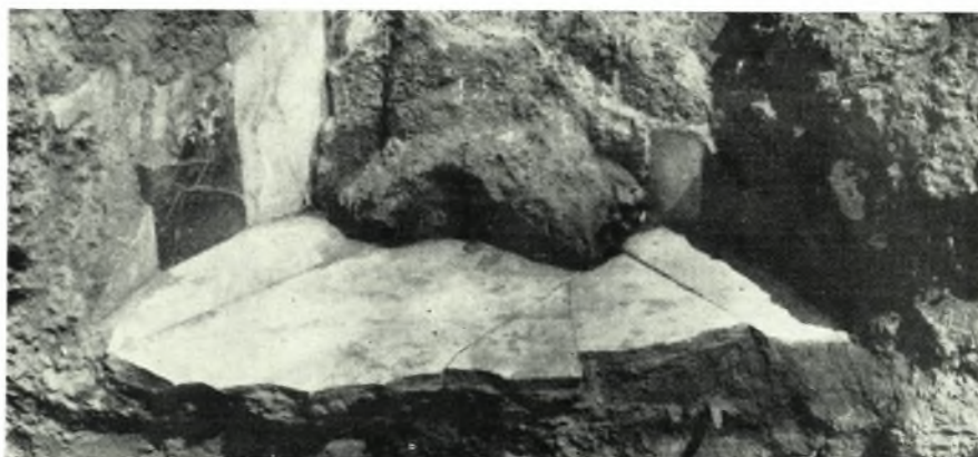
Φίλιπποι: α. Τεμάχια τοῦ διακόσμου τοῦ θωρακίου τοῦ Πί ν. 600 β, β. Τμήμα τοῦ ἀνασκαπτομένου χώρου τοῦ νάρθηκος τοῦ Ὁκταγώνου μέ τὰ ἀποκαλυπτόμενα κατὰ τήν ἀνασκαφήν ἀρχιτεκτονικά μέλη, γ. Ἡ κατὰ τὸν βόρειον τοῖχον ἀποκαλυφθεῖσα φωτιστικὴ κογχωτὴ θυρὶς καὶ τὸ ἐν αὐτῇ εὑρεθὲν νόμισμα