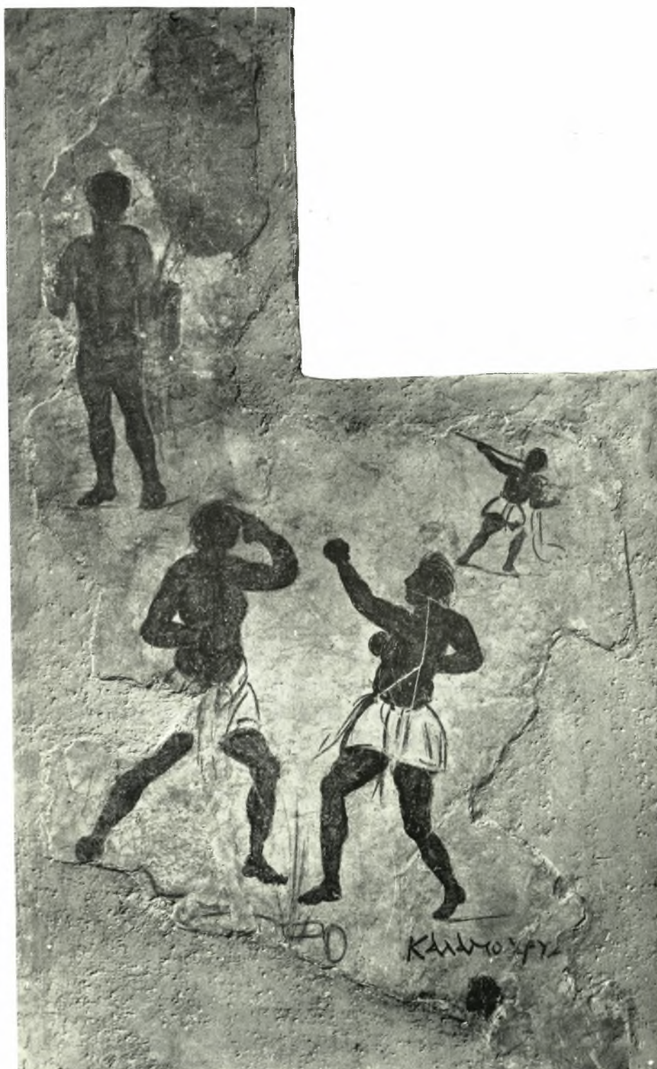
Δήλος: Τοιχογραφία έσωτερικής όψεως τής παραστάδος. Στρώμα 5. Άγών πυγμαχίας