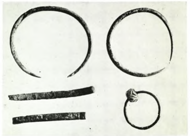
α. Τμήμα διαχωριστικού κιονίσκου παραθύρου ἐξ Ἁγίων Θεοδώρων Ροδόπης, β. Τμήμα ζυφόρου τοῦ Τεμένους τοῦ Ἱεροῦ τῶν Καβείρων, ἐν Σαμοθράκη, γ. Κτερίσματα ἐκ τῶν τάφων τῆς «Μεγάλης Πέτρας» τοῦ χωρίου Μέγα Πιστόν Ροδόπης