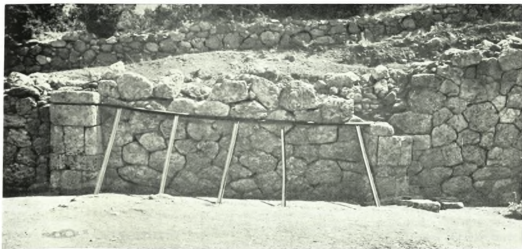
Σαμοθράκη: α. Ἐποψὶς τοῦ ἀνατολικοῦ τοίχου τοῦ «Ἀνακτόρου» ἐκ νότου πρὸς βορρᾶν, β. Ἐποψὶς τοῦ ἀνατολικοῦ τοίχου τοῦ «Ἀνακτόρου» πρὸ τῆς στερεώσεως