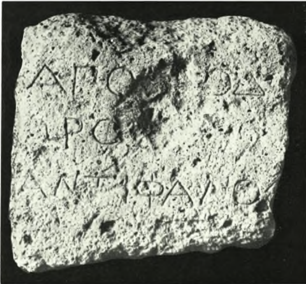
α. Ἐπιγραφή ἐκ τῶν Ὑφαντῶν Κομοτηνῆς, β. Ἐπιτομβία στήλη τοῦ 4ου π.Χ. αἰ. ἐκ τοῦ Γυμνασίου Θηλέων Κομοτηνῆς, γ. Ἀνάγλυφον ἐκ Δικέλλων Ἐβρου