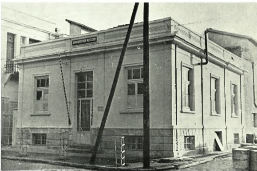
α. Σαμοθράκη. Ἄποψις τοῦ ἀνατολικοῦ τοίχου τοῦ «Ἀνακτόρου» μετὰ τὴν στερέωσιν, β. Σαμοθράκη. Βωμὸς τῆς Ἑκάτης, γ. Κομοτηνὴ. Τὸ προσωρινόν Μουσείον ΑΝΔΡ. ΒΑΒΡΙΤΣΑΣ