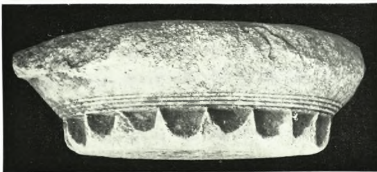
α. Ἀνάγλυφον ἐκ τοῦ χωρίου Μέσση Ροδόπης, β. Δωρικόν κιονόκρανον ἐκ τοῦ Πόρτο - Λάγο, γ. Δωρικόν κιονόκρανον ἐκ τοῦ μετοχίου τοῦ Ἁγίου Νικολάου εἰς Πόρτο - Λάγο