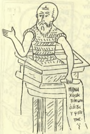
Εἰκ. 3. Ὁ Ἅγ. Συμεών. Ἐξ εἰκόνης τῆς Πανακοθήκης τοῦ Βατικανοῦ.

παρά μόνον τὸ ἄνω σῶμα τοῦ στυλίου 1 . Ἡ ἐρμηνεία ὅμως αὐτῇ τοῦ Wulff δὲν φαίνεται πιθανή, διὰ πολλοὺς λόγους. Κατ' ἀρχὴν εἶναι ἀκατανόητος διὰ τὴν βυζαντινὴν ζωγραφικὴν ἢ τόσον πιστὴ καὶ ἐπιστημονικὴ, θὰ ἠδύνατό τις