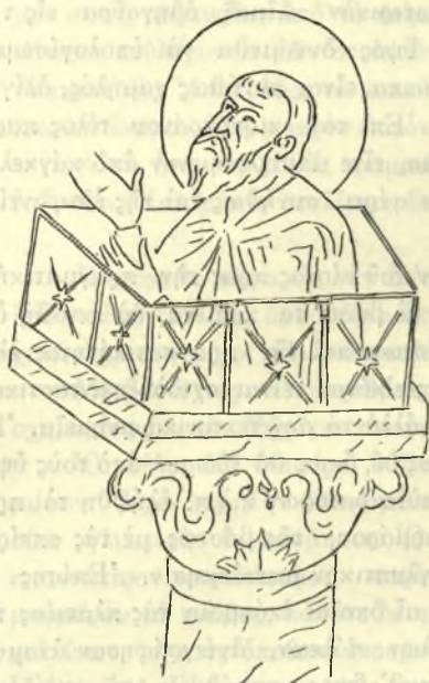
Εἰκ. 1. Ὁ ᾿Αγ. Ἀλύπιος. Ἐκ μικρογραφίας τοῦ Μηρολογίου τοῦ Βατικανοῦ.

εις τὸν κώδ. 2 τῆς ἀγιορειτικῆς Μονῆς ᾿Αγ. Παντελεήμονος, παρέστησε τὴν κλίμακα, διὰ τῆς ὁποίας οἱ μαθηταὶ καὶ οἱ ἐπισκέπται ἐπεκοινώνουν μὲ τὸν στυλίτην, ὃχι ξυλίνην κινητὴν, ὅπως ἦτο εἰς τὴν πραγματικότητα καὶ ὅπως τὴν βλέπομεν εἰς ἄλλας παραστάσεις, ἀλλὰ κτιστὴν, μὲ ἐπένδυσιν ἐκ χρωματιστῶν μαρμάρων 1 .