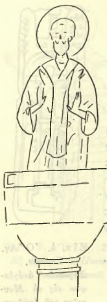
Εἰκ. 5. Στυλῖτης. Τοιχογραφία Μ. Ἀστε- ρίου ἐπὶ τοῦ Ὑμητιοῦ.

τινῆς ἐποχῆς οὐδὲν τοιοῦτον παράδειγμα εἶναι, εἰς ἑμὲ τοῦλάχιστον, γνωστόν. Οἱ Κρηῖτες ὅμως ἀγιογράφοι τοῦ 16ου αἰῶνος παρέστησαν τοιαύτας μορφὰς