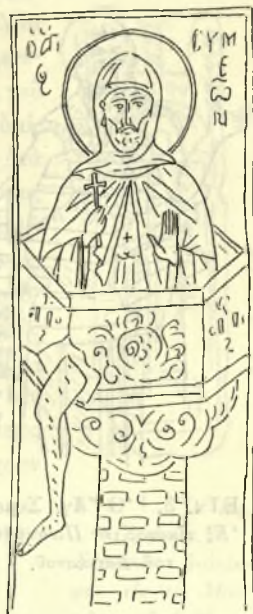
Εἰκ. 2. Ὁ Ἅ. Συμεῶν. Τοιχογραφία (1548) Μον. Βαρλαάμ Μετεώρων.

Πῶς ὅμως ἐδημιουργήθη ἡ παράδοξις αὕτη παράστασις τοῦ στυλίτου ἐν προτομῇ ἐπὶ τοῦ κίονος; Ὁ Wulff ἐπεχείρησε νὰ ἐρμηνεύσῃ τὴν παράστασιν λαμβάνων ὡς βῆσιν τὴν πραγματικότητα. Παρεδέχθη δηλαδὴ ὅτι ἡ εἰκὼν τοῦ στυλίτου προϋποθέτει τὸν θεατὴν εὐρισκόμενον χαμηλὰ καὶ ἐγγύτατα τοῦ κίονος, ὁπότε, διὰ λόγους προοπτικούς, δὲν θὰ ἦτο δυνατόν νὰ ἴδῃ τις