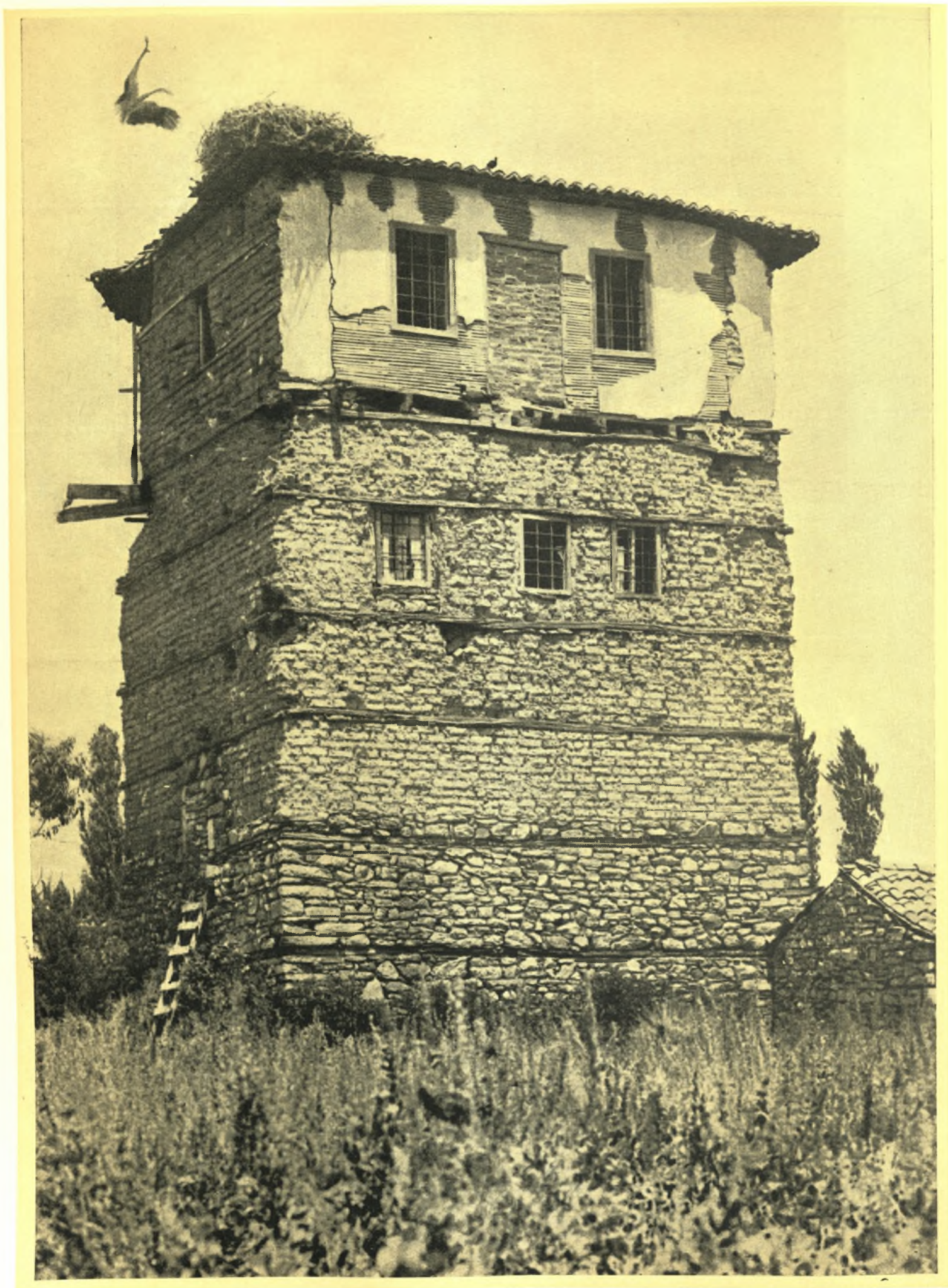
ΒΕΛΕΣΤΙΝΟΣ : ΕΝΑΣ ΠΑΛΑΙΟΣ ΠΥΡΓΟΣ ΚΟΝΤΑ ΣΤΟ ΣΠΙΤΙ ΤΟΥ ΡΗΓΑ