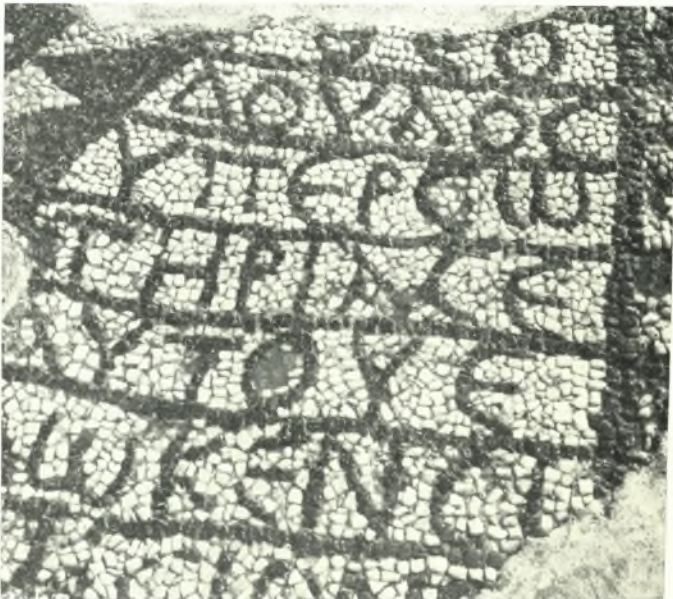
β. Ψηφιδωτὴ ἐπιγραφὴ δωρητοῦ ἐκ τοῦ κέντρου τοῦ μέσου κλίτους τῆς βασιλικῆς Ὀλοῦντος.