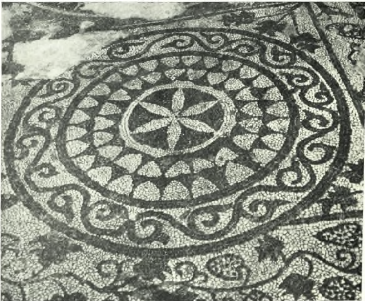
β. Διακοσμητικὸν θέμα ψηφιδωτοῦ δαπέδου τῆς βασιλικῆς Ὁλοῦντος.