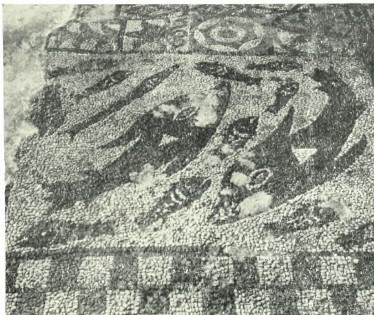
α. Ψηφιδωτὸν διάχωρον μετὰ παραστάσεως ἰχθύων τῆς βασιλικῆς Ὀλοῦντος.