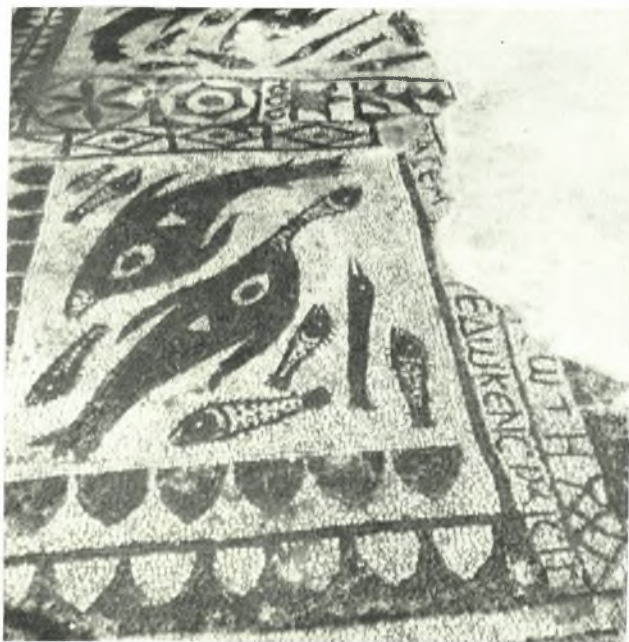
β. Ψηφιδωτὸν διάχωρον μετὰ παραστάσεως ἰχθύων καὶ ἐπιγραφῆς τῆς βασιλικῆς Ὀλοῦντος. Institutional Repository - Library & Information Centre - University of Thessaly 01/06/2024 19:47:41 EEST - 18.221.200.136