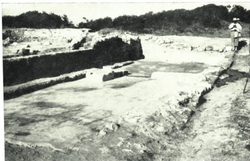
α. Ὑποψὶς τοῦ Ν. προσκτίσματος τῆς βασιλικῆς τοῦ Μαστιχάρη ἀπὸ ΝΔ.