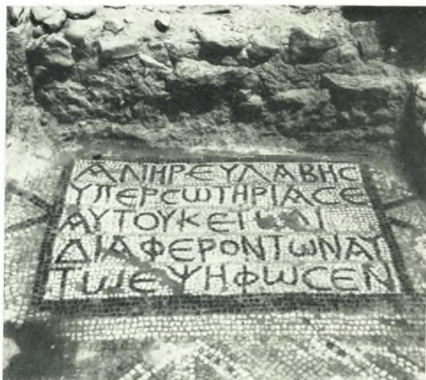
α. Ψηφιδωτή ἐπιγραφή πρὸ τῆς θύρας ἐπικοινωνίας τοῦ Ν. προσ- κτίσματος μετὰ τοῦ ναοῦ.