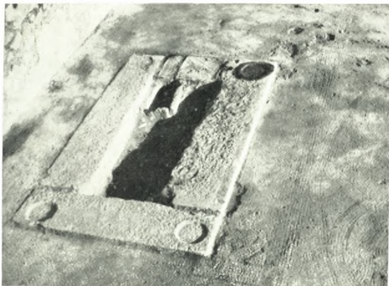
β. Ἡ βάσις τῆς Ἁγ. Τραπεζῆς τοῦ Ν. προσκτίσματος τῆς βασιλικῆς τοῦ Μαστιχάρη.