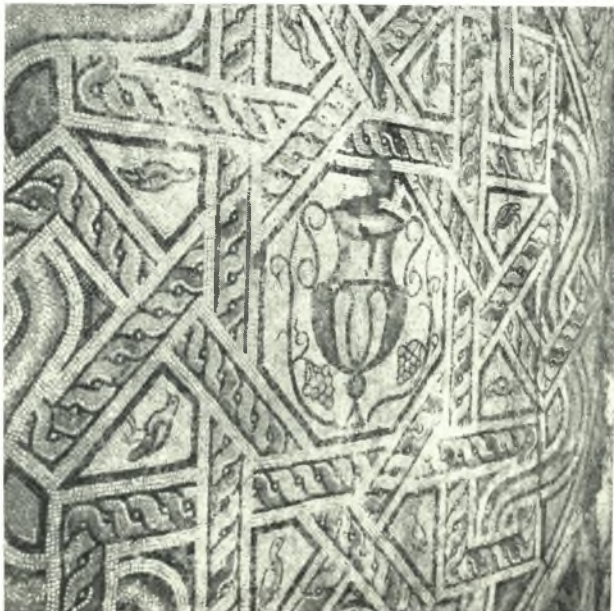
β. Τὸ κεντρικὸν τμῆμα τῆς ψηφιδωτῆς διακοσμῆσεως τοῦ νοτίου προσκτίσματος.