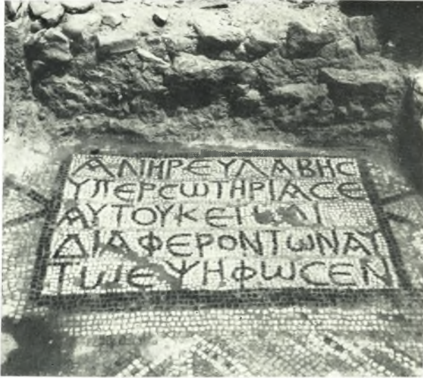
α. Ψηφιδωτή ἐπιγραφή πρὸ τῆς θύρας ἐπικοινωνίας τοῦ Ν. προσκτίσματος μετὰ τοῦ ναοῦ.