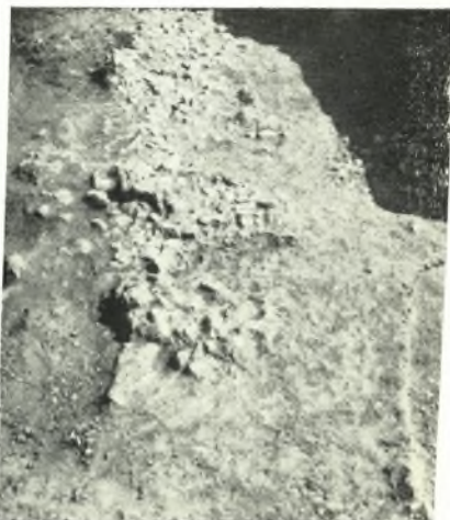
β. Τὸ β' (ἐκ τῶν ἄνω) λιθόστρωτον τοῦ Ν. τομέως. (Κάτω δεξιὰ τὰ ΒΑ. ὅρια τοῦ μεγάλου λιθοσωροῦ).