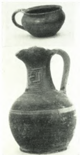
β. Τὰ ἀγγεῖα τοῦ τραπεζιοσχήμου γεωμετρικοῦ τάφου.