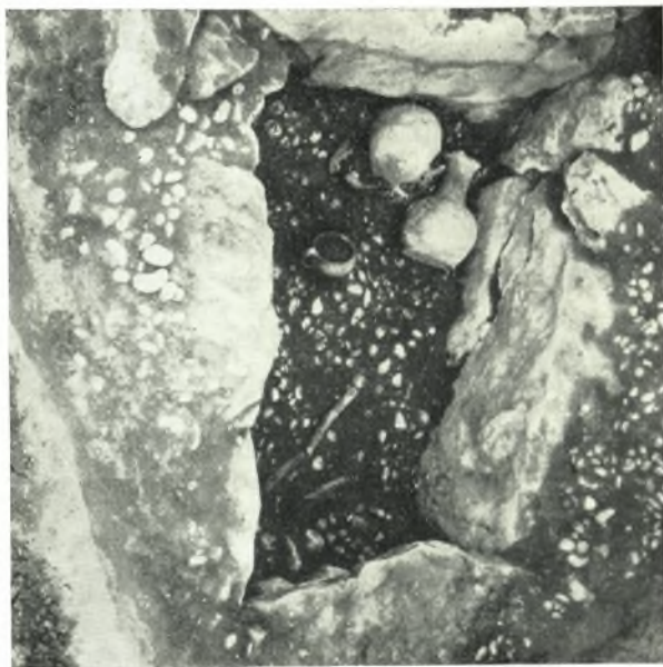
α. Τραπεζιόσχημος γεωμετρικός τάφος.