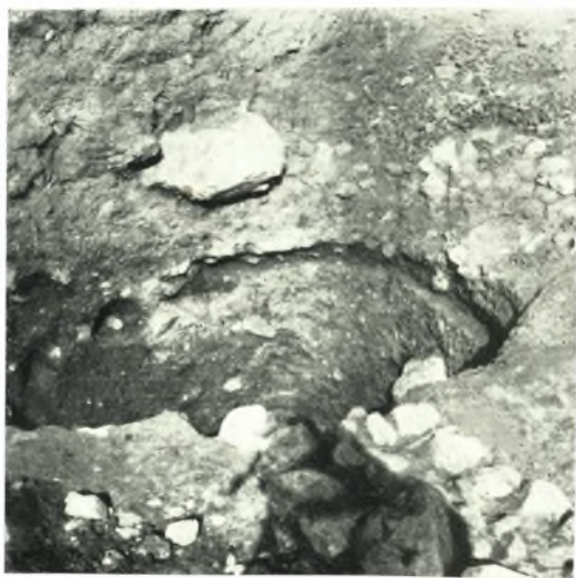
γ. Κυκλικὸς τάφος πρωτογεωμετρικῆς ἐποχῆς. (Ἐμ- πρὸς δεξιὰ ὁ ὑπ' αὐτοῦ ἀποκοπείς ἀρχαιότερος τοῖχος.)