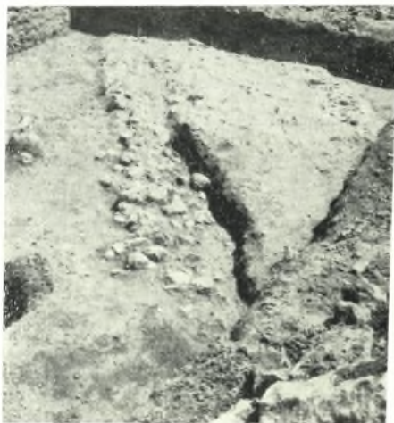
α. Χαλκίοστρωτος δδός της βορείου τάφρου από ΝΔ.