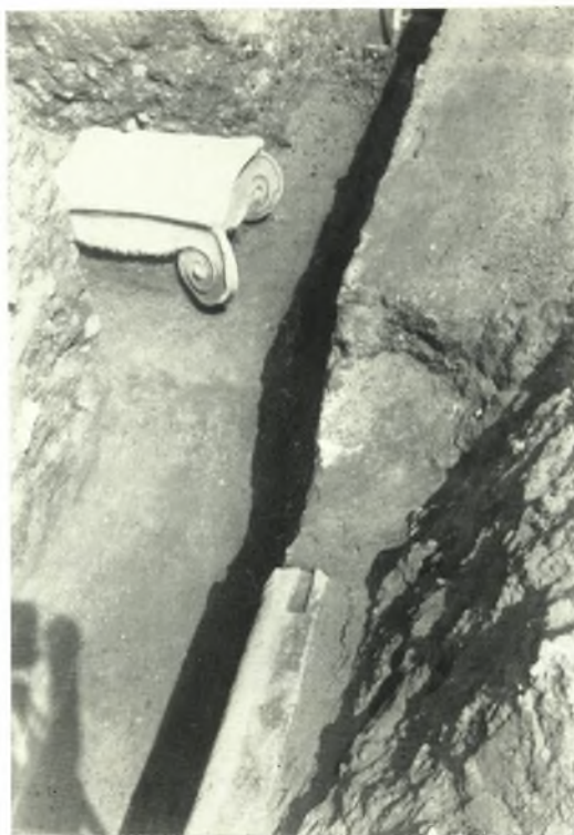
α. Ίωνικόν κιονόκρανον ἔξω τῆς νοτίας θύρας τοῦ ναοῦ.