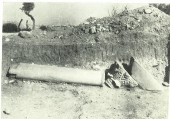
β. Ἐρριμμένος κίον μετὰ τοῦ κιονοκράνου καὶ τοῦ ἐπιθήματός του.