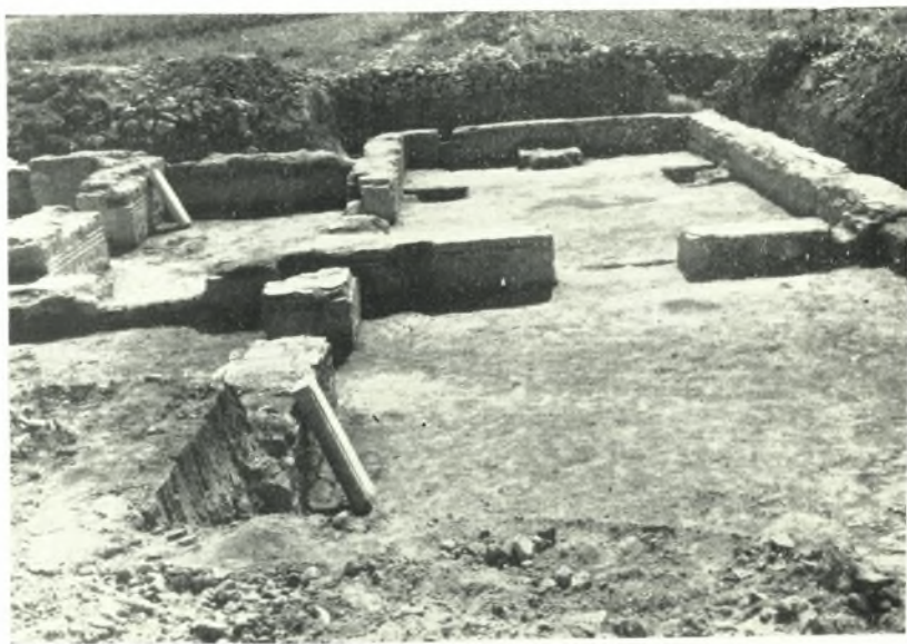
β. Προσκτίσματα νοτίως τοῦ νάρθηκος. Ἀποψις ἐκ Β.