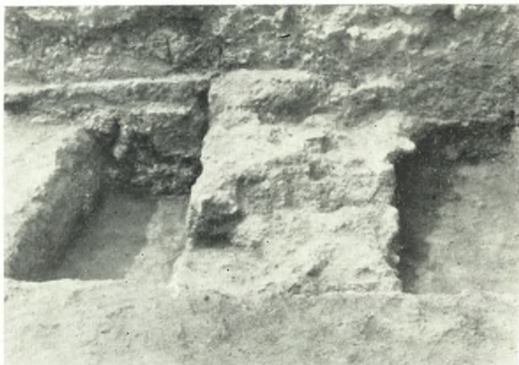
α. Λείψανον τοῦ ἀρχικοῦ νοτίου τοίχου τῆς νοτίως τοῦ νάρθηκος αἰθούσης. Δυτικὸν ἄκρον.