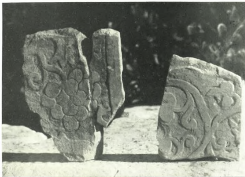
β. Τμήματα πλακῶν ἐν τῇ ἀνάσκαφί.