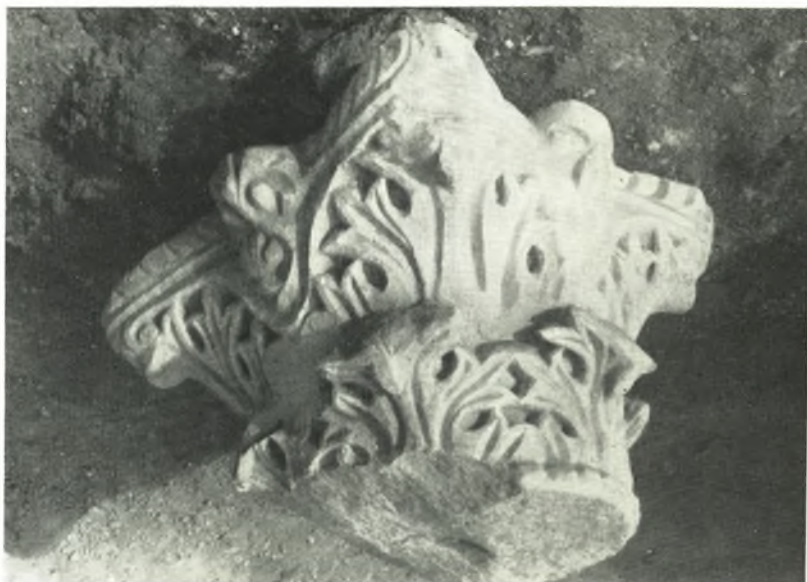
α. Κορινθιακὸν κιονόκρανον ἐκ τῆς νοτίας κιονοστοιχίας.