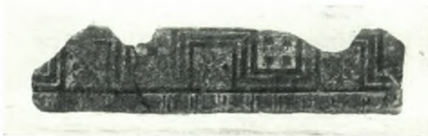
γ. Πηλίνη σίμη μετὰ γραπτῆς διακοσμῆσεως.