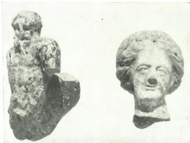
α. Ρυτόν με πλαστικήν παράστασιν Τρίτωνος ἀριστερά καὶ κεφαλή εἰδωλίου γυναικὸς - δεξιά.