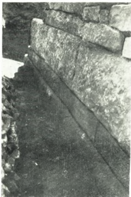
α. Ἐξωτερικός τοίχος ἀρχαίας οἰκοδομῆς.