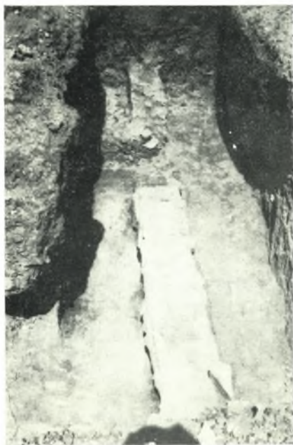
γ. Τοῖχοι τῶν διαμερισμάτων τῆς αὐτῆς οἰκοδομῆς.