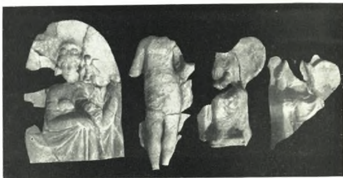
α. Πήλινα ειδώλια άνευρεθέντα πρό του άναγλύφου της Κυβέλης.