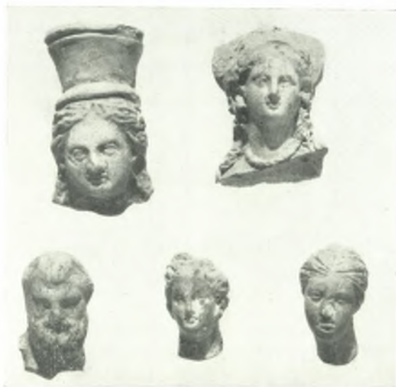
β. Κεφαλαὶ πηλίνων εἰδωλίων.