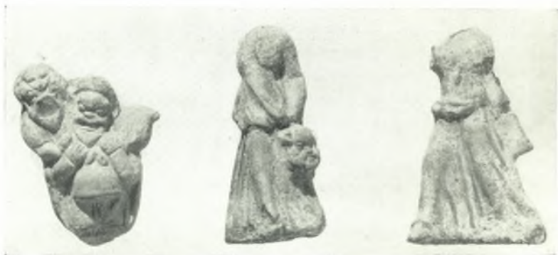
β. Πήλινα ειδώλια ήθοποιών και χορευτρίας.