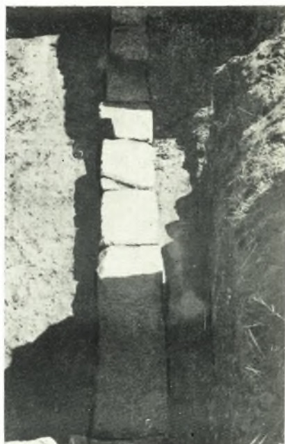
β. Θεμέλιον τοίχου τῆς αὐτῆς οἰκοδομῆς.