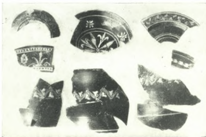
γ. Τμήματα άγγείων έλληνιστικης εποχης.