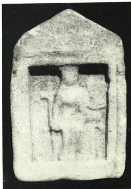
δ. Ἀνάγλυφον Κυβέλης.