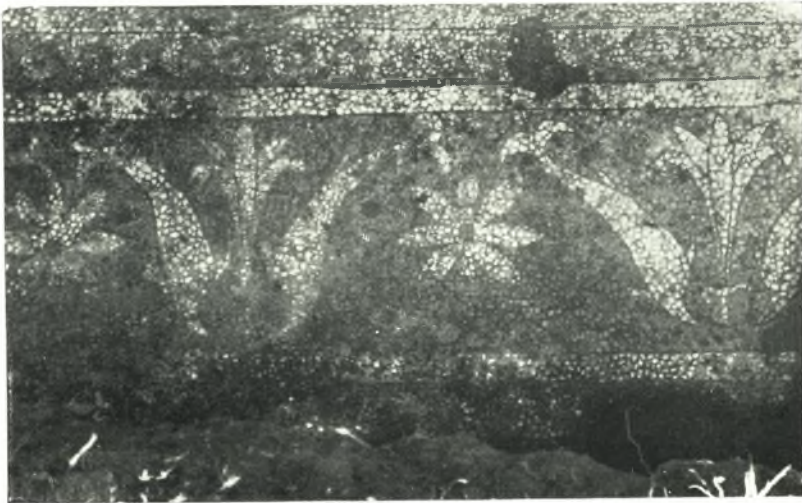
β. Μωσαϊκὸν δάπεδον ἀρχαίου κτηρίου.