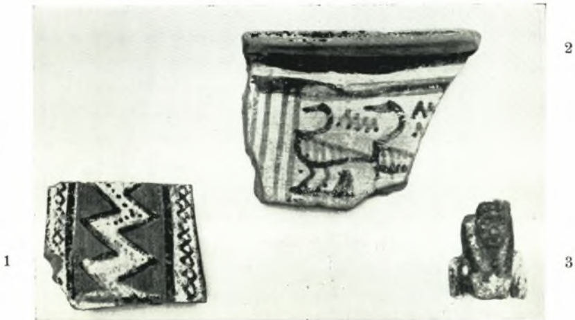
β. 1-2. Ὑστρακα γεωμετρικῶν χρόνων καὶ 3. αἰγυπτιακὸν ἀγαλμάτιον.