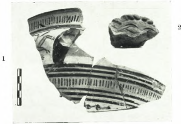
α. 1. Γεωμετρικὸν ἀγγεῖον καὶ 2. Γοργόνειον ἐκ τῶν κεραμικῶν ἐργαστηρίων.