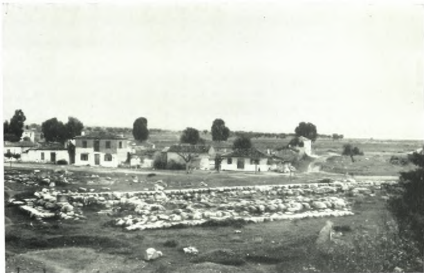
α. Τὰ θεμέλια τοῦ ναοῦ τοῦ Δαφνηφόρου Ἀπόλλωνος.