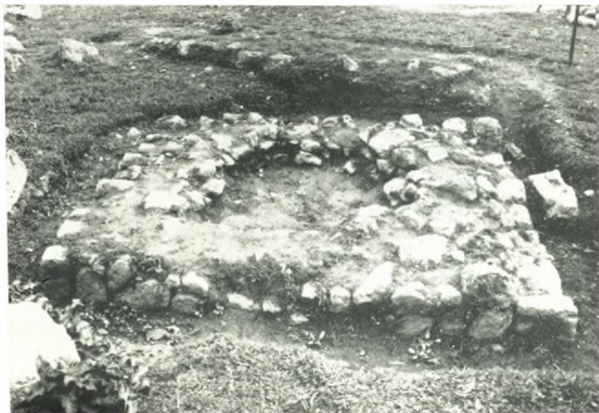
β. Κτίσμα ἐξ ἀργῶν λίθων παρὰ τὴν ΒΑ. γωνίαν τοῦ ναοῦ τοῦ Δαφνηφόρου Ἀπόλλωνος.