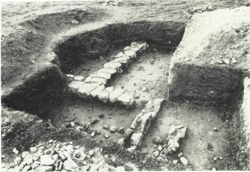
α. Θεμέλια κεραμεικῶν ἐργαστηρίων παρὰ τὸν ναὸν τοῦ Δαφνηφόρου Ἀπόλλωνος.