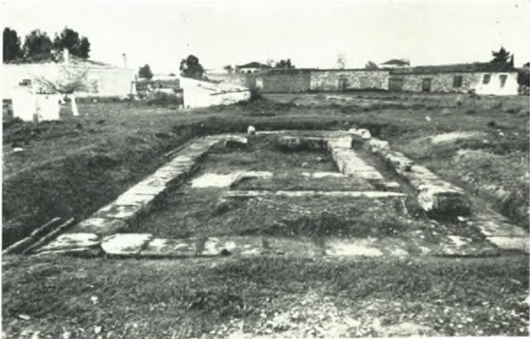
β. Θεμέλια κρηναίου πιθανῶς οἰκοδομήματος.