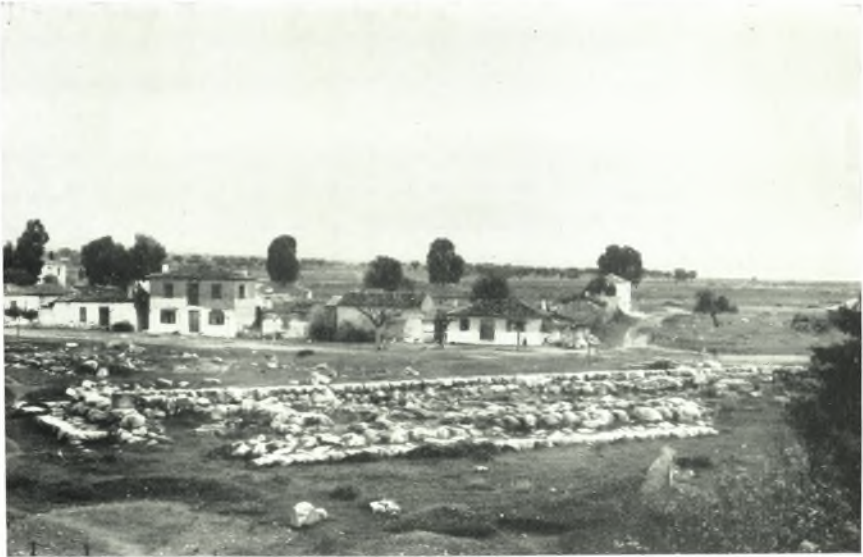
α. Τὰ θεμέλια τοῦ ναοῦ τοῦ Δαφνηφόρου Ἀπόλλωνος.