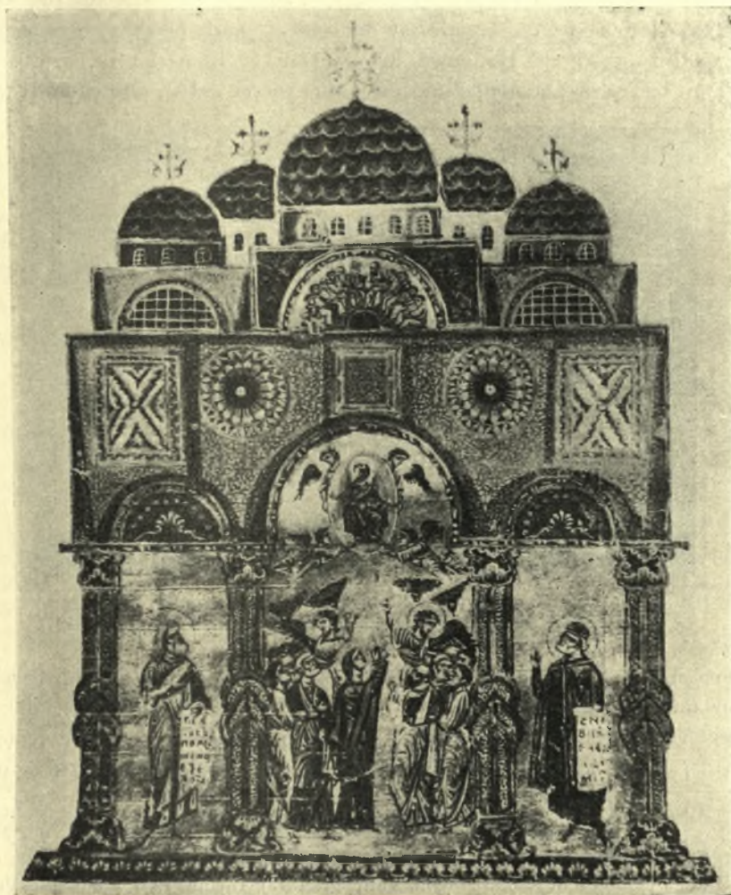
Εἰκ. 2. Ἡ προμετωπὶς τοῦ κώδ. 1208 τῆς Ἐθνικῆς Βιβλιοθήκης τῶν Παρισίων.

Ἄλλὰ ὁ ὑπὸ τοῦ Ἰουστινιανοῦ ἀνεγερθεὶς ἐν Κωνσταντινουπόλει Ναὸς τῶν Ἁγ. Ἀποστόλων ἐκαλύπτετο μὲν ὑπὸ πέντε τρούλλων, ἢ ἐπὶ τῆς στέγης ὅμως διάταξις αὐτῶν ἦτο διάφορος. Οἱ τέσσαρες δηλαδὴ περὶ τὸν κεντρικὸν