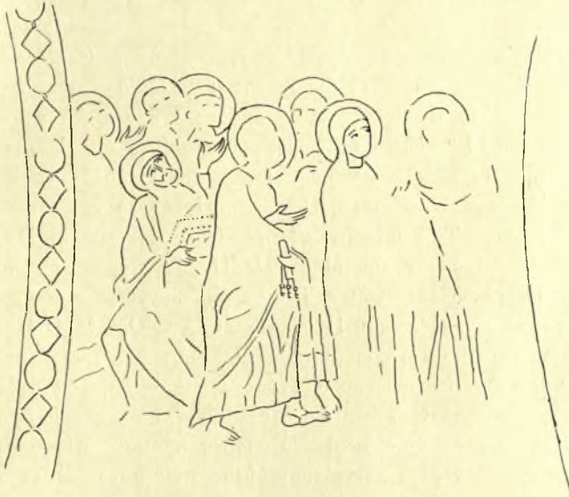
Εἰκ. 6. Τμῆμα τοιχογραφίας τῆς Ἀναλήψεως ἐν τῷ Ναῷ τοῦ Χρυσοστόμου ἐν Γερακίῳ.

στατο κυρίως εἰς τὴν τοποθέτησιν τῆς Θεοτόκου. Ἐδοκιμάσθησαν λοιπὸν διάφοροι λύσεις, ἀκόμη καὶ ἡ παράλειψις τῆς Θεοτόκου, ὅπως εἰς τὴν Ὁμορφῆν Ἐκκλησίαν τῆς Αἰγίνης 1 . Ἡ κατὰ τὸν 12 ον αἰῶνα ἐπικρατήσασα λύσις ἦτο νὰ εἰκονίζωσι τὴν Θεοτόκον μετὰ τοῦ ἀριστεροῦ ὁμίλου τῶν Ἀποστόλων ἐστραμμένην πρὸς δεξιὰ. Οὕτως εὐρίσκομεν αὐτὴν καὶ εἰς τὴν ἀνέκδοτον εἰσέτι τοιχογραφίαν τοῦ Ναοῦ τοῦ Χρυσοστόμου ἐν Γερακίῳ (Εἰκ. 6), ὅπως καὶ εἰς μερικὰ ἔργα μικροτεχνίας ἐμπνεόμενα ἀναμφιβόλως ἀπὸ ψηφιδωτὰ ἢ