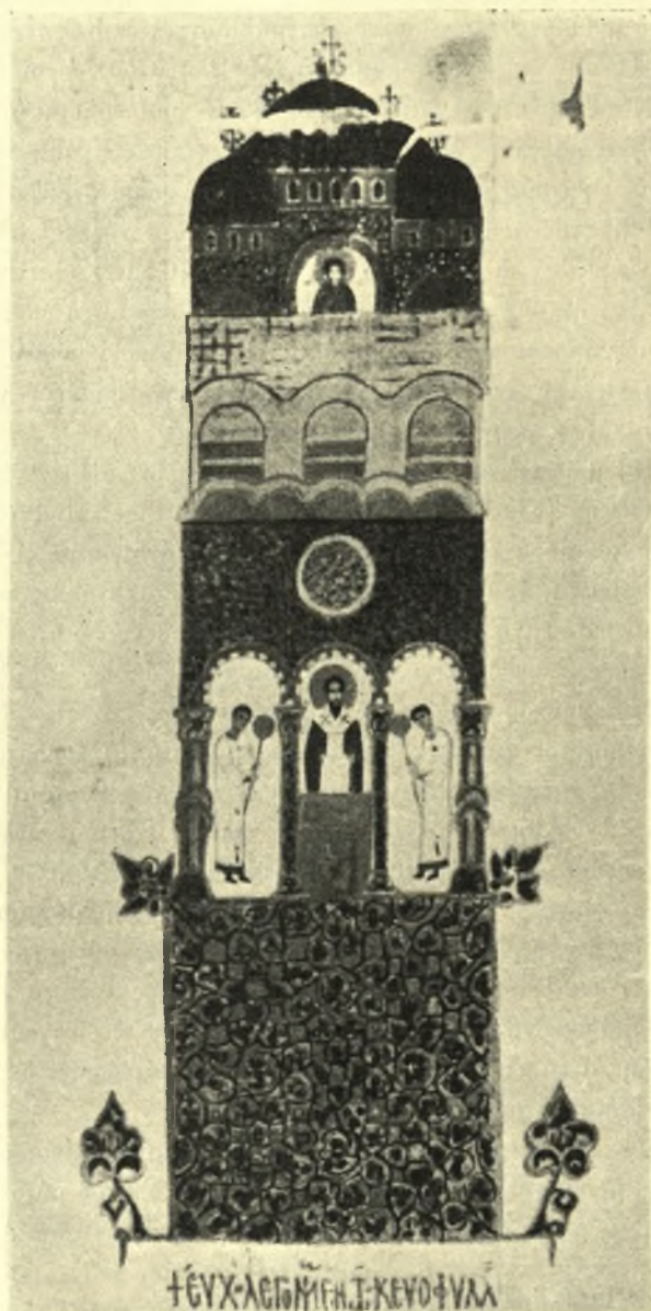
Εικ. 8. 'Επικεφαλis του ὑπ' ἀριθ. 707 λειτουργικοῦ εἰλη- ταρίου τῆς Μονῆς Πάτμου (Jacori).