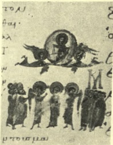
Εἰκ. 4. Μικρογραφία τῆς Ἀναλήψεως ἐν τῷ κώδ. 154 τῆς Βιβλιοθήκης τῆς Βιέννης (φ. 131 β).

Ἡ μικρογραφία τῆς Βιέννης εἶναι φανερόν ὅτι ἀντιγράφει σύνθεσιν τῆς Ἀναλήψεως εὐρισκομένην ἐπὶ συνεχοῦς ἐπιφανείας, τοῖχου δηλαδὴ ἢ τροῦλλον, ὡς τοῦτο καταφαίνεται ἐκ τῆς κατὰ πλάτος ἀναπτύξεως εἰς μίαν γραμμὴν τῶν Ἀποστόλων, τῆς Θεοτόκου καὶ τῶν ἐκατέρωθεν αὐτῆς Ἀγγέλων. Ἀντιθέτως ἡ μικρογραφία τοῦ Βατικανοῦ μιμεῖται σύνθεσιν εὐρισκομένην εἰς τὸ ἐσωτερικὸν καμάρας, ὡς δεικνύουσιν αἱ δύο ὁμάδες τῶν Ἀποστόλων διατε-