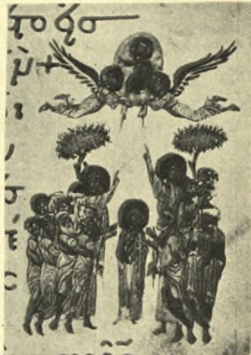
Εἰκ. 5. Μικρογραφία τῆς Ἀναλήψεως ἐν τῷ κώδ. 1156 τῆς Βιβλιοθήκης τοῦ Βατικανοῦ (φ. 52 α).

ταγμένοι ὑπὸ μορφὴν πυραμίδων, ὧν τὰς κορυφὰς κατέχουσιν οἱ δύο Ἀγγελοι.