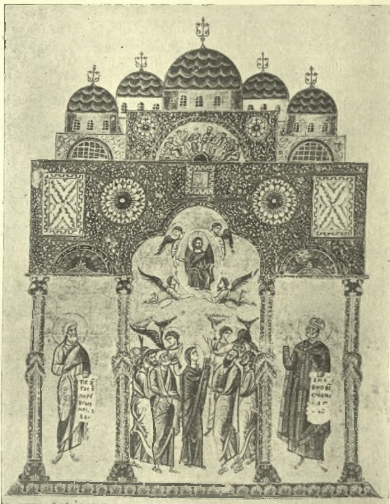
Εἰκ. 1. Ἡ προμετωπίς τοῦ κώδ. 1162. τῆς Βιβλιοθήκης τοῦ Βατικανοῦ.

Ἐάν ἐξετάσῃ τις ἐπισταμένως τὰς δύο μικρογραφίας, θὰ παρατηρήσῃ ὅτι οἱ τέσσαρες περὶ τὸν κεντρικὸν τροῦλλον, μικρότεροι ὀλίγον ἐκείνου, εὐρί-