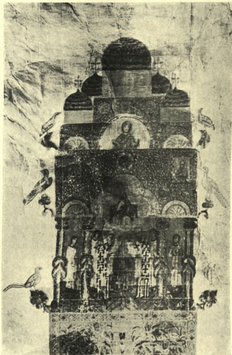
Εικ. 7. Ἡ ἐπικεφαλὶς τοῦ ἐν τῇ Ἐθν. Βιβλιοθήκῃ τῶν Ἀθηνῶν λειτουργικοῦ εἰληταρίου.

Τὸ ἐν λόγῳ εἰλητάριον, ἀνήκον, ὡς ἐξάγεται ἐκ τῆς γραφῆς του, εἰς τὸν 12 ον αἰῶνα, περιέχει τὴν Λειτουργίαν τοῦ Μεγάλου Βασιλείου. Εἰς τὴν ἐν ἀρχῇ αὐτοῦ ἐπικεφαλίδα (Εἰκ. 7) παρίσταται οἰκοδόμημα ἐντελῶς ὅμοιον πρὸς τὸ τῆς