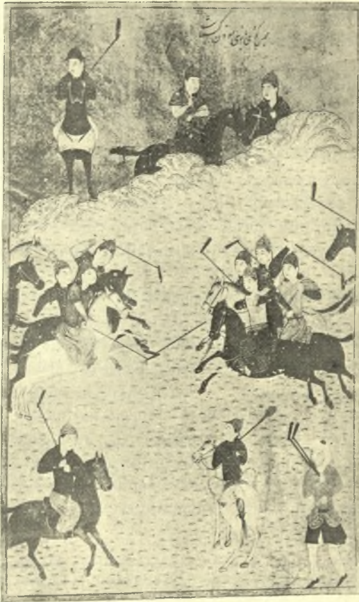
Εἰκ. 6. Πῶς ἐπαίξετο τὸ τζυκάνιον. Ἐκ Περσικοῦ χειρογράφου τοῦ 17 ου αἰῶνος. (Arménac bey Sakisian, La miniature Persane du XII e au XVII e siècle , Pl. 32 fig. 48).

Τὸ ἀγώνισμα τοῦτο, τὸ ὁποῖον ἐχρειάζετο χῶρον εὐρύν, στάδιον ἢ κιάμπον, ἀπῆται μεγάλην εὐκαμψίαν καὶ ἔλιγμους «ὕπτιάζειν τε γὰρ αἰεὶ ὡς λέγει ὁ Κίνναμος 1 καὶ ἰσχυρίζετο ἀνάγκη τὸν ταύτην μειόντα ἐν κύκλῳ τε περιελίσσειν καὶ παντοδαπούς ποιεῖσθαι τοὺς δρόμους τοσοῦτοις τε κινήσεων