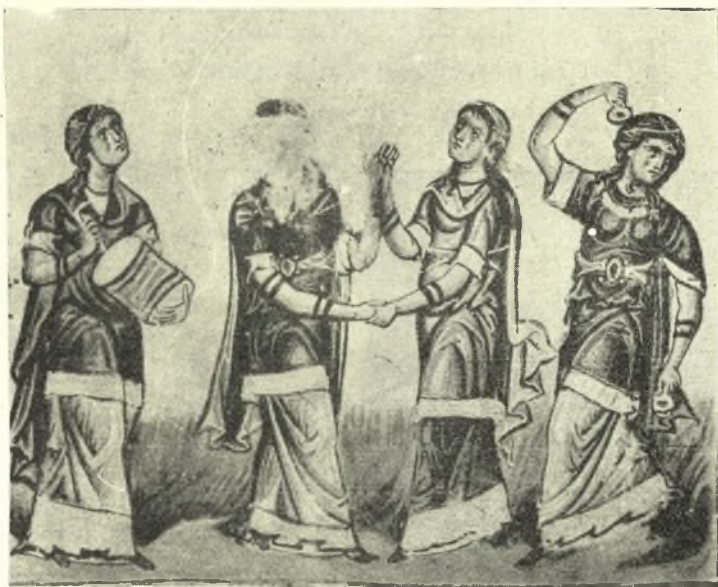
Εἰκ 5. Ἱεροῦ χοροῦ παράστασις. (L'octateuque du Sérail à Constantinople. Album du XIIe vol. du Bulletin de l'Institut archéologique à Constantinople τίν. 22 εἰκ. 122).

Σήμερον ἐν Πόντῳ, Προύσῃ καὶ Σαλαμῖνι κατὰ τοὺς γάμους χορεύεται χορὸς τὰ μανδήλια καλούμενος, κατὰ παρωδιαν δὲ συχνότατα ἔχορεύ-