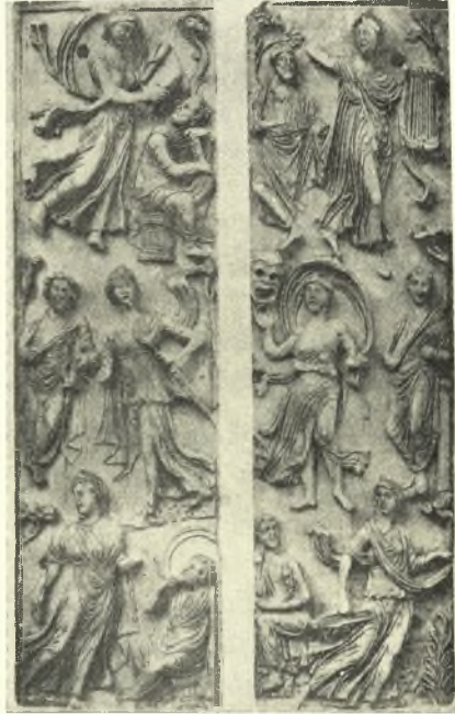
Εἰκ. 10. Παράστασις συγγραφῶν καὶ Μουσῶν φερουσῶν ἡμικυκλικούς πέπλους. Ε'. αἰῶνος. Μουσεῖον Λούβρου (H. Peirce et R. Tyler, L'art byzantin I pl. 148).

Μικρὸν ἀνωτέρω ὠμίλησα διὰ τὰ κρουόμενα κρόταλα. Αἱ εἰκόνες, (βλ. εἰκόν. 5, 8 καὶ 11) παριστῶσι ταῦτα δι' ἑκατέρας χειρὸς κρατούμενα καὶ οἱ συγγραφεῖς δ' ἐπ' ἴσσης τὰ μνημονεύουσι. Τὰ κρόταλα ταῦτα, τὰ ὅποια ἐχρησιμοποιοῦντο καὶ κατὰ τοὺς ἀρχαίους χορούς 5 , ἀναφέρει διὰ τοὺς χρόνους του ὁ Κλήμης ὁ Ἀλεξανδρεὺς, κρόταλα Αἴγυπτίων αὐτὰ καλῶν 6 , πιθανώτατα δὲ εἶναι τὰ αὐτὰ μὲ τὰ ὑπὸ