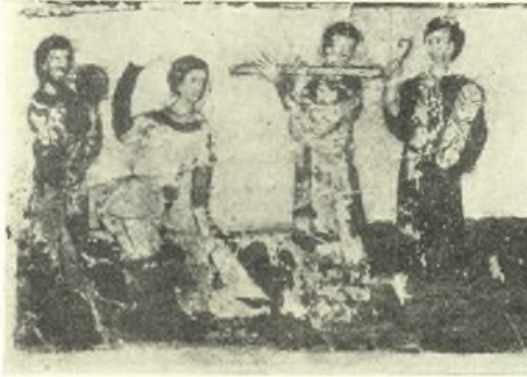
Εἰκ. 13. Χορεύτρια ἔχουσα μακρὰς χειρῖδας καὶ μουσικοὶ. (J S t r z y g o w s k i, Der Bilderkreis des griechischen Physiologus Taf. XI.)

Κατὰ τοὺς χοροὺς τῶν Βυζαντινῶν ἐγίνετο χρῆσις καὶ ἄλλων μὲν μουσικῶν ὀργάνων (ἀναφέρονται π. χ. τὸ ψαλτήριον, ἡ σύριγξ καὶ ἡ λύρα)