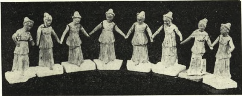
Εἰκ. 2. Τὰ ἐν τῇ τάφῳ τῆς Δημητριάδος εὑρεθέντα εἰδώλια τὰ παριστῶντα συρτὸν χορόν.

Ὦντως τὸ πρῶτον, ὅπερ κάμνουσιν οἱ τὸν συρτὸν χορεύοντες εἶναι νὰ λάβωσιν ἀπὸ τῶν δακτύλων τὰς χεῖρας ἀλλήλων. Τὸ σχῆμα βεβαίως