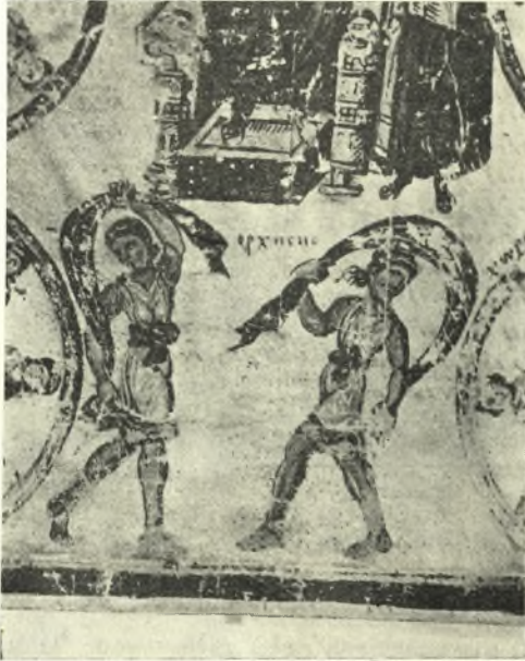
Εἰκ. 9. Χορεύτριαι μετὰ ἡμικυκλικῶν πέπλων, ἐκ τοῦ χ. Κοσμᾶ τοῦ Ἰνδικοπλεύστου. (J. Ebersolt, La miniature byzantine pl. X.)

Τὸν χορόν, ὡς εἰκόσ, συνώδευον καὶ τῶν χειρῶν κινήσεις. Ἄλλοτε