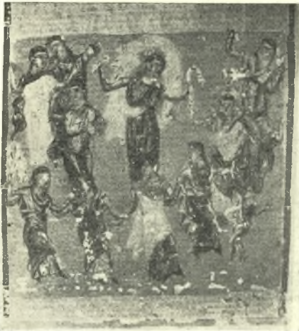
Εἰκ. 6. Ἡ χρῆσις τῶν μανδηλίων κατὰ τὸν χορὸν. (J. Strzygowski, Die miniaturen des serbischen Psalters der königl. Hof und Staatsbibliothek in München πίν. 46)

Ὁ Ξενοφῶν ἐν τῷ Συμποσίῳ του λέγει περὶ τοῦ Διονύσου ὅτι «ἐπιχορευσας ἑκαθέζετο ἐπὶ τῶν γονάτων τῆς Ἀριάδνης καὶ περιλαβὼν ἐφίλησεν αὐτήν» 3 .