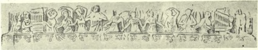
Εἰκ. 3. Παράστασις συρτοῦ χοροῦ ἐπὶ τῆς ἐν τῷ Ἰπποδρόμῳ τῆς Κωνσταντινουπόλεως βάσεως τοῦ ὀβελίσκου Θεοδοσίου τοῦ Β'. (S. R e i n a c h, Bibliothèque des monuments figurés tom. I p. 127).

Σήμερον οἱ χορεύοντες τὸν συρτόν, ἀντὶ νὰ λαμβάνωσιν ἀλλήλους ἀπὸ τῶν χειρῶν πολλάκις συνδέονται διὰ κρατουμένων μανδηλίων, μανδήλιον δ' ἐπ' ἴσης εἰς τὴν δεξιὰν κρατεῖ καὶ ὁ κορυφαῖος τοῦ χοροῦ. Ὅτι τοῦτο