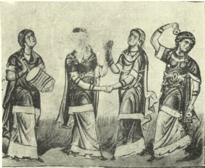
Εἰκ 5. Ἱεροῦ χοροῦ παράστασις. (L'octateuque du Sérail à Constantinople. Album du XIIe vol. du Bulletin de l'Institut archéologique à Constantinople τὴν. 22 εἰκ. 122).

Σήμερον ἐν Πόντῳ, Προύσῃ καὶ Σαλαμῖνι κατὰ τοὺς γάμους χορεύεται χορὸς τὰ μανδήλια καλούμενος, κατὰ παρωδιαν δὲ συχνότατα ἔχορεύ-