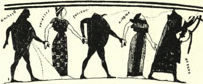
Εἰκ. 4. Παράστασις τοῦ χοροῦ γέρανου ἐπὶ ἀρχαίου ἀγγείου. (D a r e m b e r g-S a g l i o, Dictionnaire λ. Saltatio στήλ. 1035)

Ὁφείλομεν δ' ἐνταῦθα νὰ σημειώσωμεν ὅτι ἐν Πάρῳ ὑπάρχει καὶ