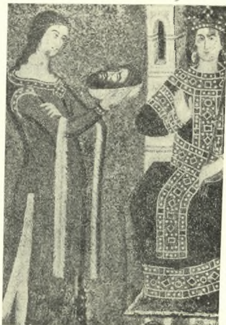
Εἰκ. 12. Ἡ Σαλώμη ὡς χορεύτρια μακρᾶς φέρουσα χειρίδας. Ἐκ μωσαϊκοῦ τοῦ βαπτιστηρίου τοῦ ἁγ. Μάρκου Βενετίας. (ΙΔ' αἰῶνος). (C h. D i e h l, La peinture byzantine pl. XLVIII.)

Οἱ θεαταὶ οὗτοι δὲν ἔβλεπον μόνον τὸν χορόν, ἀλλὰ πολλάκις και ἐκροτάλιζον τὰς χεῖρας, ὅπως και πάλαι και σήμερον, τὸν ρυθμὸν οὕτως εἰς τοὺς χορευόντας δίδοντες 5 . Τοιούτους κροταλισμοὺς ἀναφέρει ἐν ταῖς