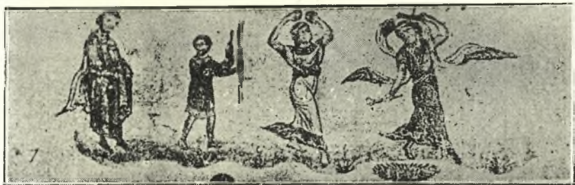
Εἰκ. 8. Χορεύτριαὶ κατὰ γαμήλιον πομπήν. Ἐκ τοῦ χ. τοῦ Ὀπριανοῦ Γ. ἢ ΙΑ'. αἰῶνος. (S c h l u m b e r g e r, Basile II le tueur de Bulgares σ. 149).

Ὅχι μόνον δ' ἐκίνουν τοὺς πόδας οἱ χορευταὶ 8 , ἀλλὰ καὶ πολλάκις ἀναπηδῶντες ἐκτύπον δι' αὐτῶν τὸ ἔδαφος. Τοιαύτας κινήσεις χαρακτη-