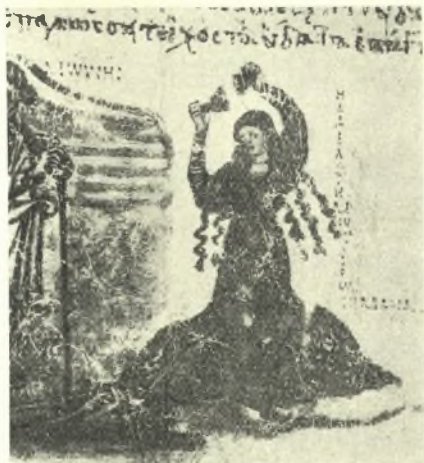
Εἰκ. 11. Χορεύτρια ἀναζρούουσα κρόταλα. Ἐκ τοῦ ψαλτηρίου Κη' οὐδον 8-9 αἰῶνος. (I. E b e r s o l t, La miniature byzantine pl. XIII.)

Ἐνταῦθα πρέπει νὰ γίνῃ διαστολὴ τῶν φορεμάτων τῶν κατ' ἐπάγγελμα ὀρχηστῶν ἢ ὀρχηστρίδων καὶ τῶν γυναικῶν ἢ ἀνδρῶν τοῦ λαοῦ, οἵτινες ἐχόρευον εἰς τὰς ἐορτὰς καὶ διασκεδάσεις. Τὰ φορέματα λοιπὸν τῶν