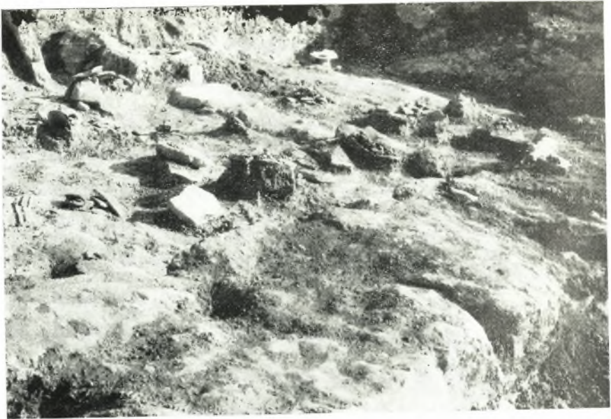
α. ΜΜ οίκια Α Ἀγλαδιῶν Ρίζας. Ὅψις ἐκ ΒΔ, τῶν δωματίων Ε καὶ Δ μετὰ τοῦ περιεχομένου των.