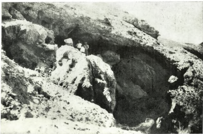
β. Εἰς τὴν εἴσοδον τοῦ σπηλαίου Κουφωτοῦ Ἀγ. Φωθιάς.