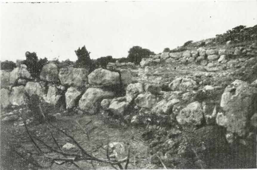
α. Α. πρόσοψις και τμήμα τοῦ περιβόλου τῆς ΜΜ οἰκίας Α Ρίζας Ἀχλαδιῶν ἐκ ΒΑ.