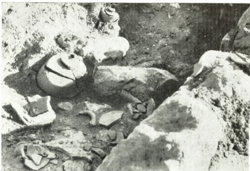
α. ΜΜ οίκια Α Ρίζας Ἀχλαδιῶν. Τμήμα τοῦ περιεχομένου τοῦ ἐπιμήκους ἀποθέτου νοτίως τοῦ δωματίου Γ.