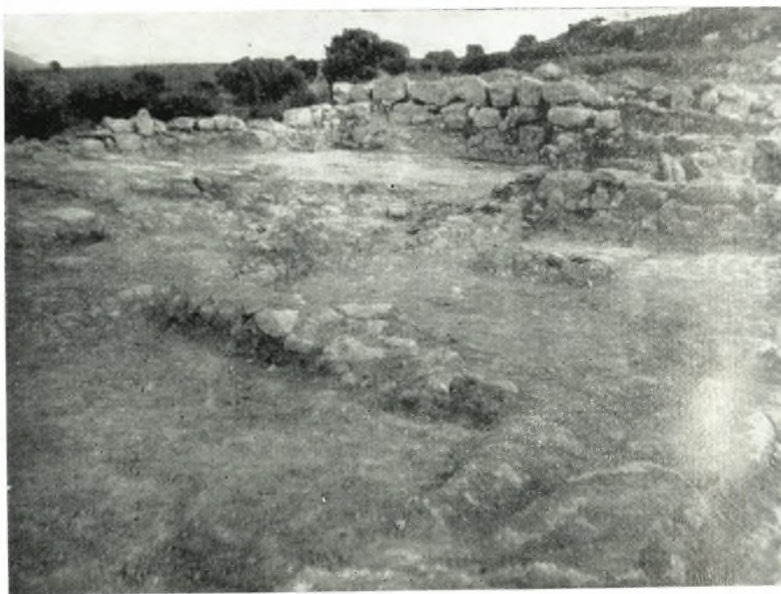
α. Όψεις τῆς ΜΜ οἰκίας Α Ἀχλαδιῶν Ρίζας ἐκ ΒΔ. κατὰ τὸ πέρασ τῆς ἀνασκαφῆς.