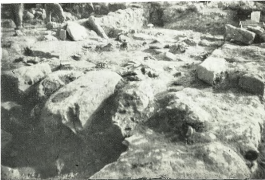
β. ΜΜ οἰκία Α Ρίζας Ἀχλαδιῶν. Τὰ δωμάτια Ε καὶ Δ μὲ τὸ περιεχόμενόν των ἐκ ΒΔ.