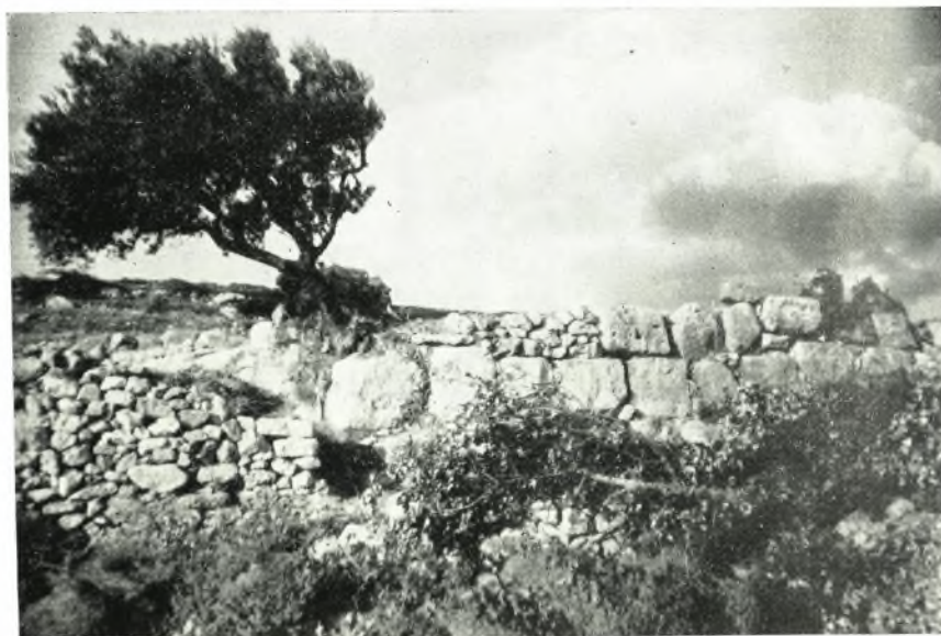
β. Β. πρόσψεις τῆς ΜΜ οἰκίας Α Ρίζας Ἀχλαδιῶν ἐκ ΒΑ.