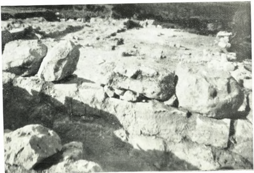
β. Ὅψις τῆς οἰκίας Α Ρίζας Ἀγλαδιῶν ἐκ Ν.