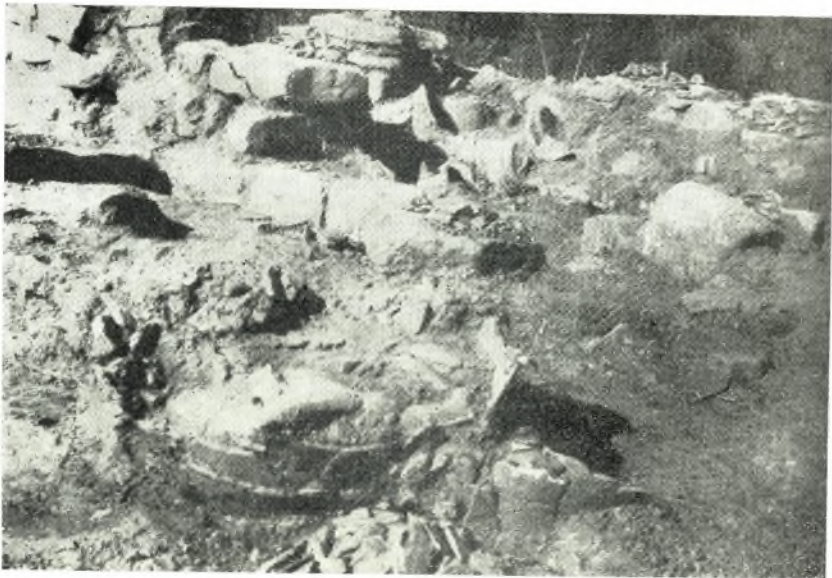
β. Ίερόν Ρουσσών Χόνδρου. Πίθιο τοῦ κέντρου τοῦ δωματίου Α 1 . Εἰς τὸ βάθος τὸ δωμάτιον Α 2 .