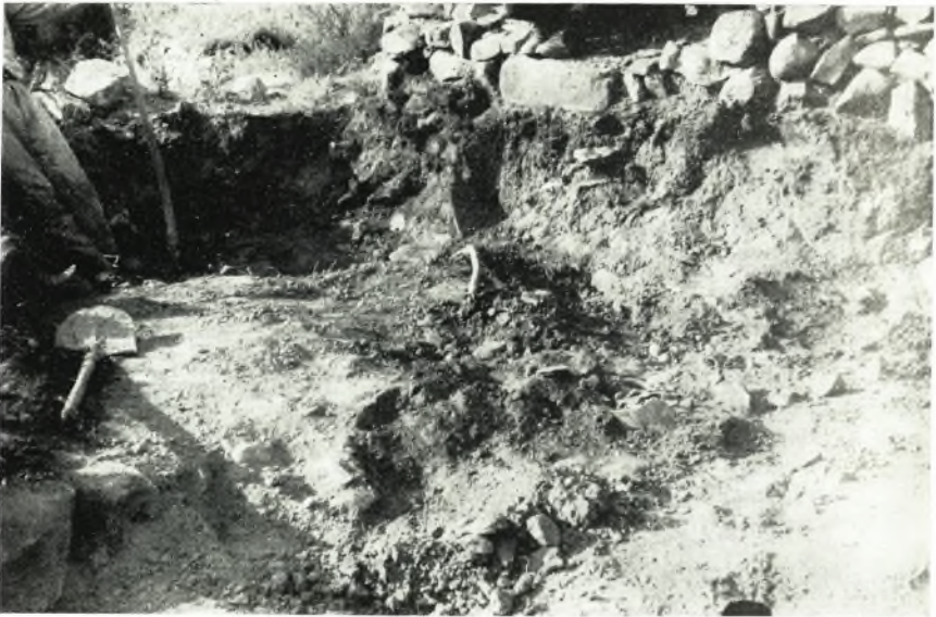
α. Ο χώρος του αποθέτου του Μινωικού Ίερού Ρουσσών Χόνδρου Βιάνου πρὸ τῆς ἀνασκαφῆς.