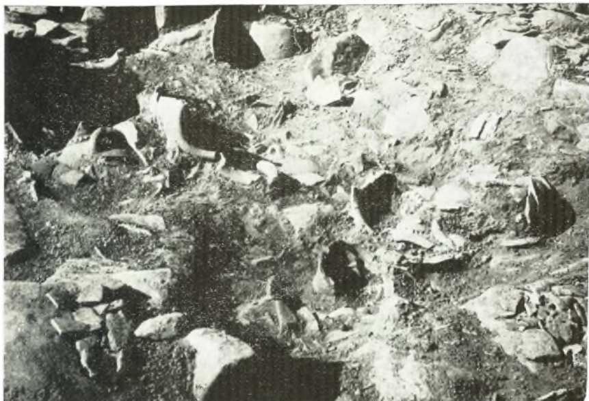
α. Ἱερὸν Ρουσσῶν Χόνδρου. Τὰ ἀγγεῖα τοῦ δωματίου Α 2 ἐκ ΒΑ.