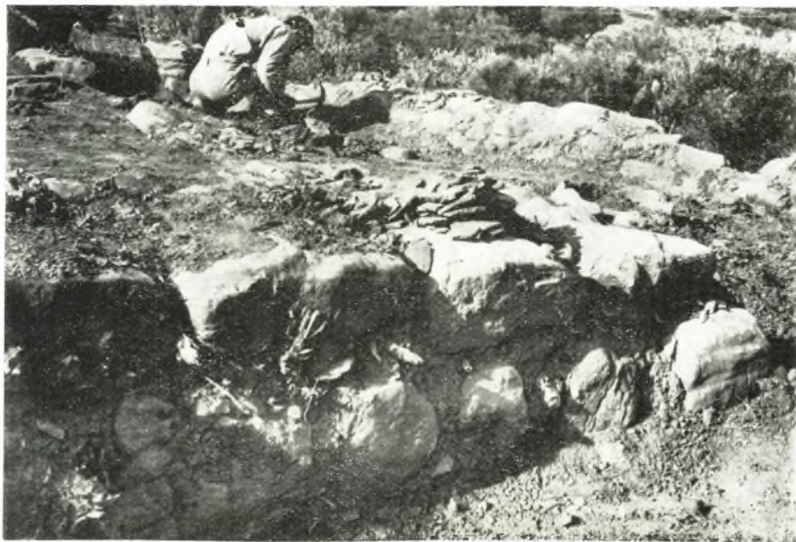
β. Ἱερὸν Ρουσσῶν Χόνδρου. Ἔργασία καθαρισμοῦ πύλων εἰς τὸ δωματίον Α 2 .