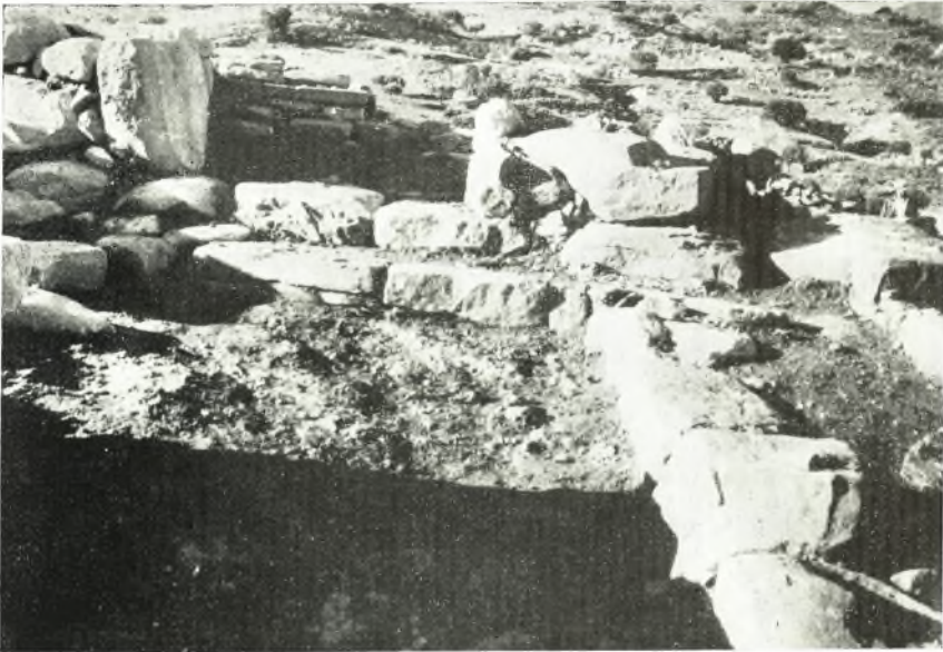
α. ΥΜ ΙΙΙ οικίαι εις Κεφάλι Χόνδρου. Ἡ θύρα τοῦ δωματίου Ν 1 καὶ ἡ μικρὰ κλιμακίς τοῦ ἐκ Ν. ὀρώμενα.