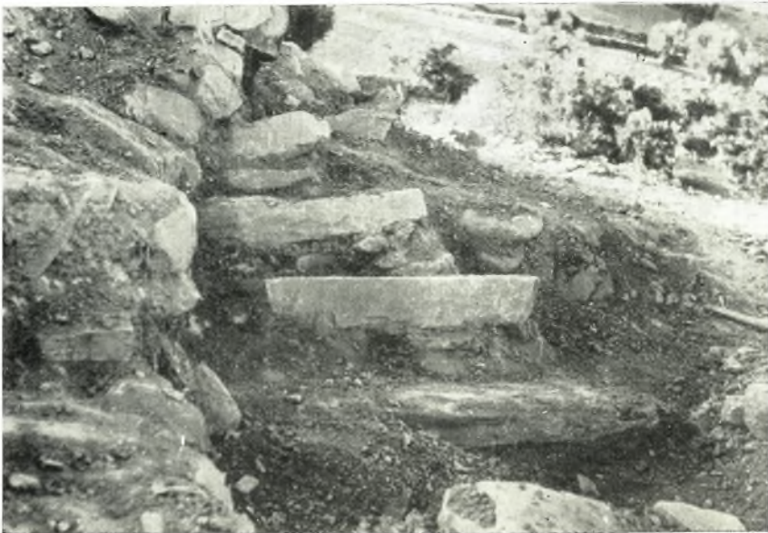
β. ΥΜ ΙΙΙ οικίαι εις Κεφάλι Χόνδρου. Ἡ κλιμακίς τοῦ δωματίου Υ 1 ὡς εὐρέθη.