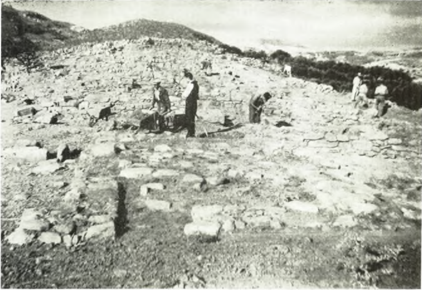
α. 'Ανασκαφή ΥΜ ΙΙΙ οίκων εις Κεφάλι Χόνδρου. Αρχή έργασίας καθαρισμού. Όψις ἐξ Ἀνατολῶν.