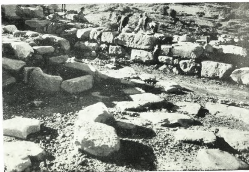
β. ΥΜ ΙΙΙ οικία εις Κεφάλι Χόνδρου. Ὅψις ἐκ ΝΑ. τοῦ πλακοστρώτου δωματίου μετὰ τὴν ἐστίαν Ι΄.