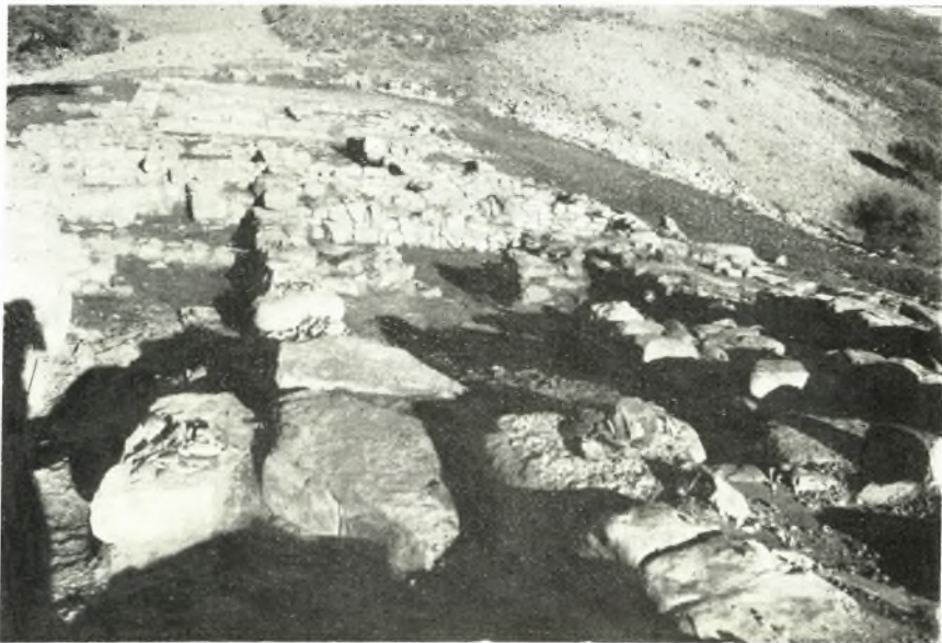
β. ΥΜ ΙΙΙ οίκοι εις Κεφάλι Χόνδρου. Γενική ἄποψις τοῦ ἀνατολικοῦ τομέως.