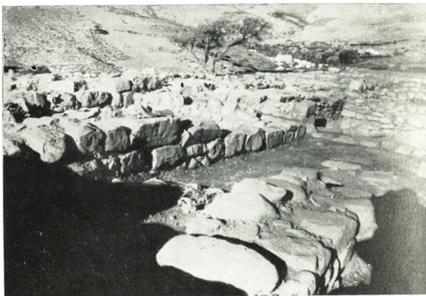
α. ΥΜ ΙΙΙ οικία εις Κεφάλι Χόνδρου. Ὅψις τοῦ ἀνατολικοῦ τοιμέως ἐκ ΝΔ. ἔρωμένου.