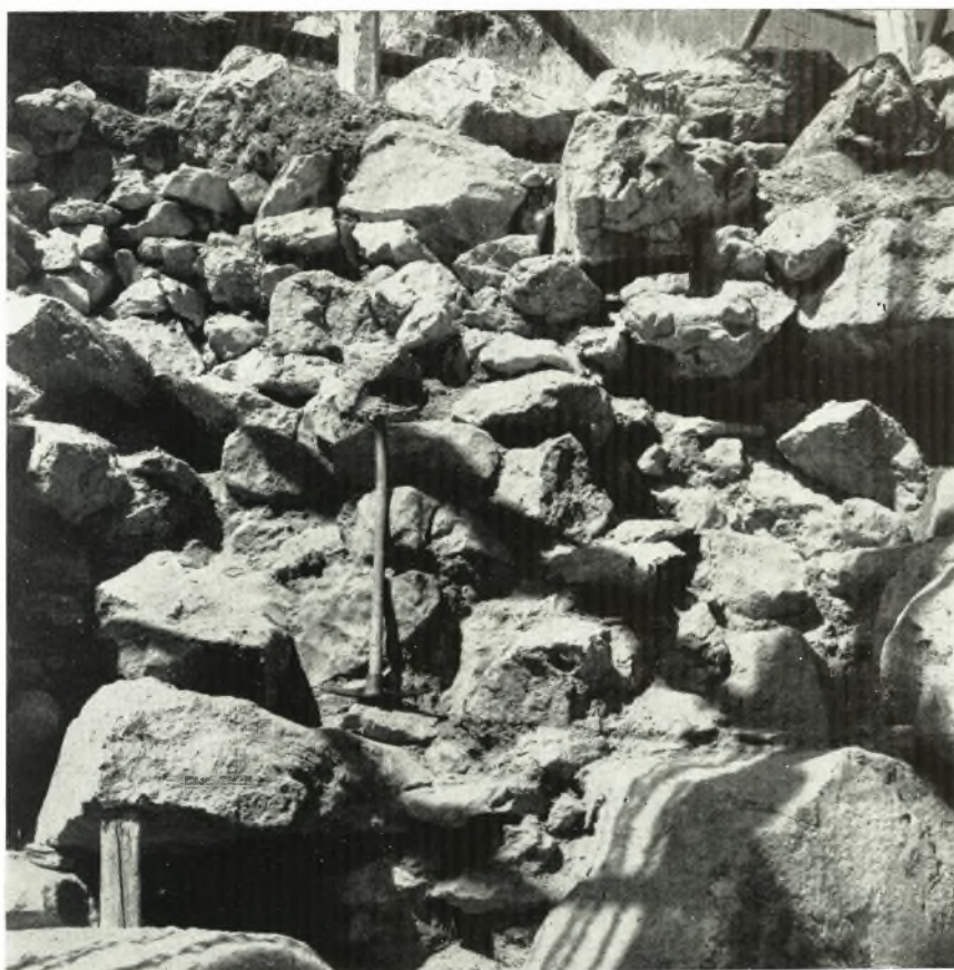
«Γέμισμα» Βορείου Κυκλωπείου τείχους.