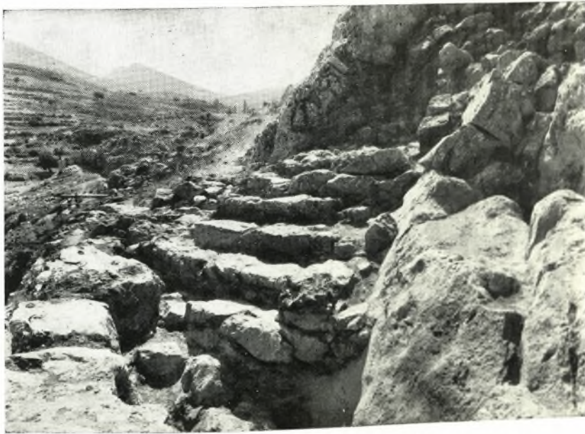
β. Κλίμαξ. Κυρία καὶ πρώτη ἔγδοδος πρὸς τὸ ἄνελκτορον.