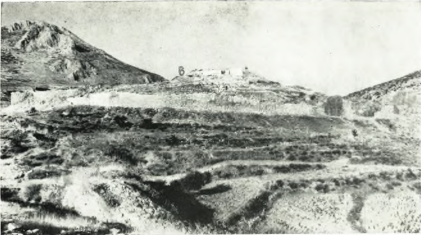
α. Ἀποψις τοῦ λόφου τῶν Μυκηνῶν ἀπὸ Δ., ὡς ἔχει σήμερον. A θέσις ἀναλημματικοῦ τοίχου. B πιθανὴ πρὸς τὴν κλίμακα ἀνάβασις.