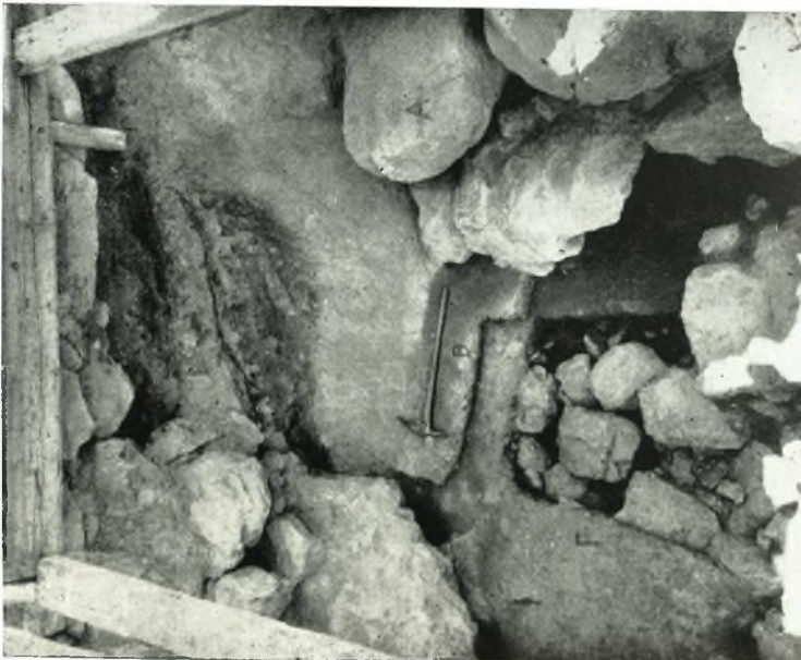
α. Οἱ ὑπὸ τὴν ἐπιάνωθι κλιμακὸς (Ramp) εὐρεθέντες ἀρχαιότεροι δρόμοι Β καὶ Γ. Α ὀγκώδεις «γαμψομακτοὶ» τοῦ Ramp.