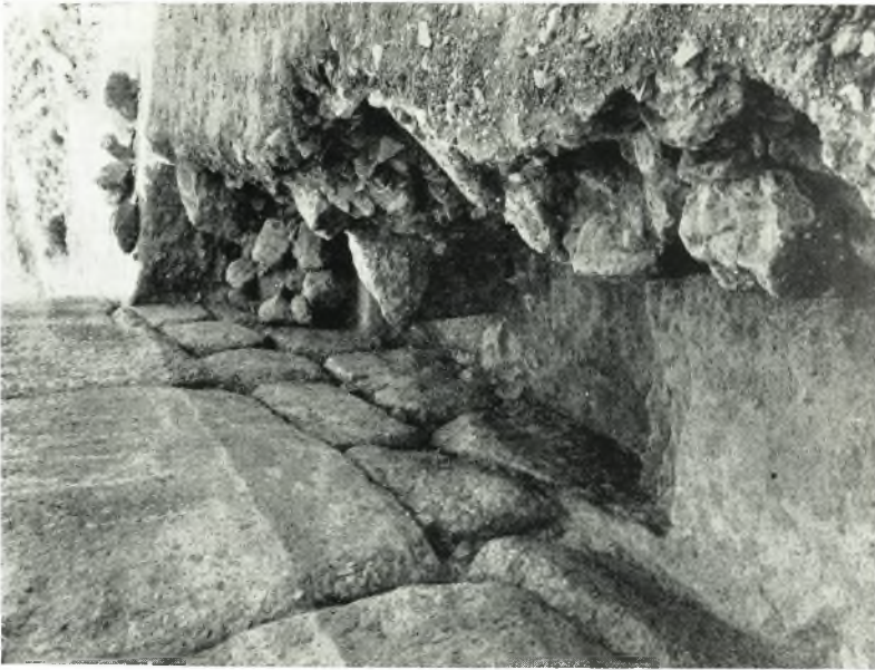
β. Θεμέλια τῆς ἀνατολικῆς πλευρῆς τοῦ πύργου τῆς Πύλης τῶν Λεόντων.