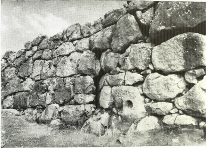
α. Καμπή πρὸς Ἐνατολάς τοῦ Βορείου Κυκλωπείου τείχους.