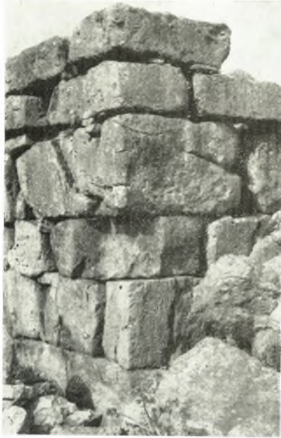
α. Ἡ ΝΑ. γωνία τοῦ δυτικοῦ πύργου τῆς Νοτίας Πύλης.