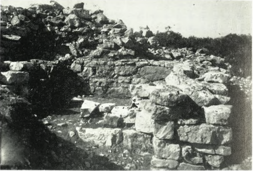
α. Τὸ ἀριστερὰ τῶ εἰσερχομένῳ κλειστῶν θυρωρείῶν τῆς Νοτίας Πύλης καὶ ἡ κατὰ τὸ μέσον τῆς νοτίας αὐτοῦ πλευρᾶς κόγχη, ὅπου πιθανὸν ἐστηρίζετο ξυλίνη κλίμαξ.