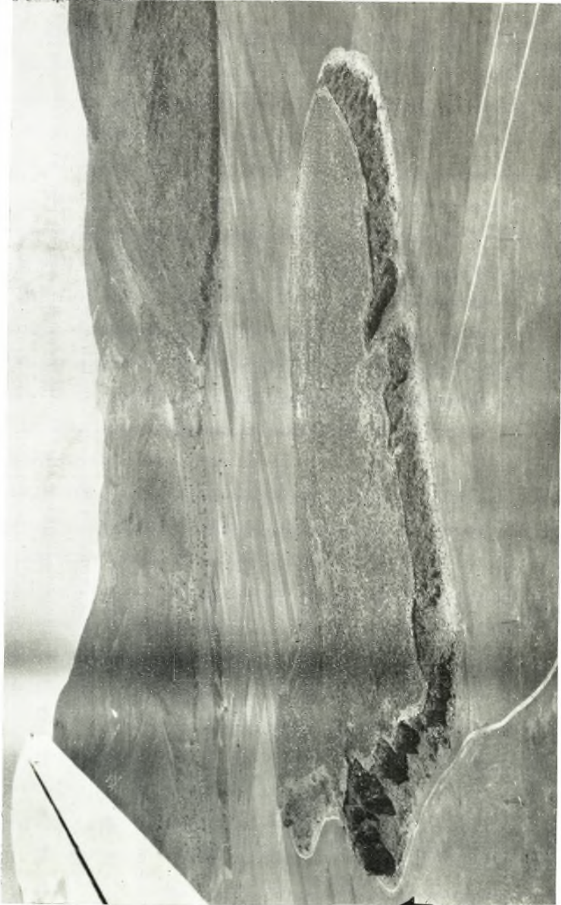
Ἐπιτύχη τῆς ἀεριοπύλεως ἀπὸ Δυσμῶν. Εἰς τὸ βάθος τὸ Περὶον.