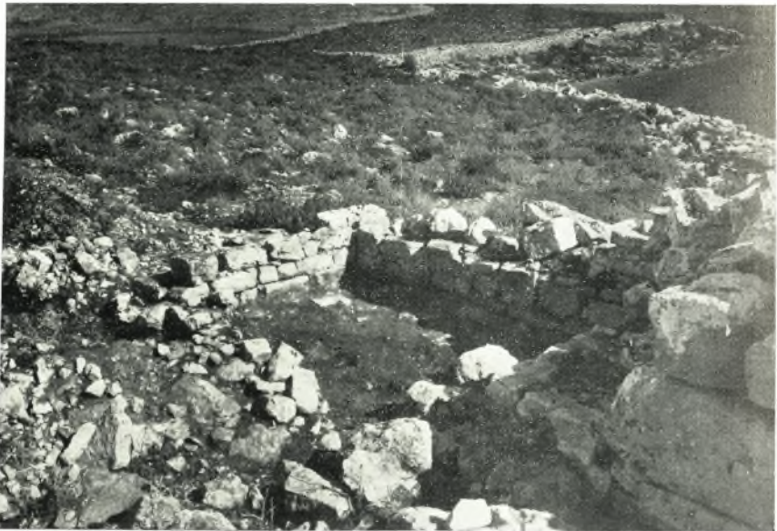
β. Τὸ δεξιὰ τῶ εἰσερχομένῳ ὑπόστεγον-θυρωρείῶν τῆς Νοτίας Πύλης με ἔχνη, παρὰ τοὺς τοίχους, τῆς πλακοστρώσεως αὐτοῦ.