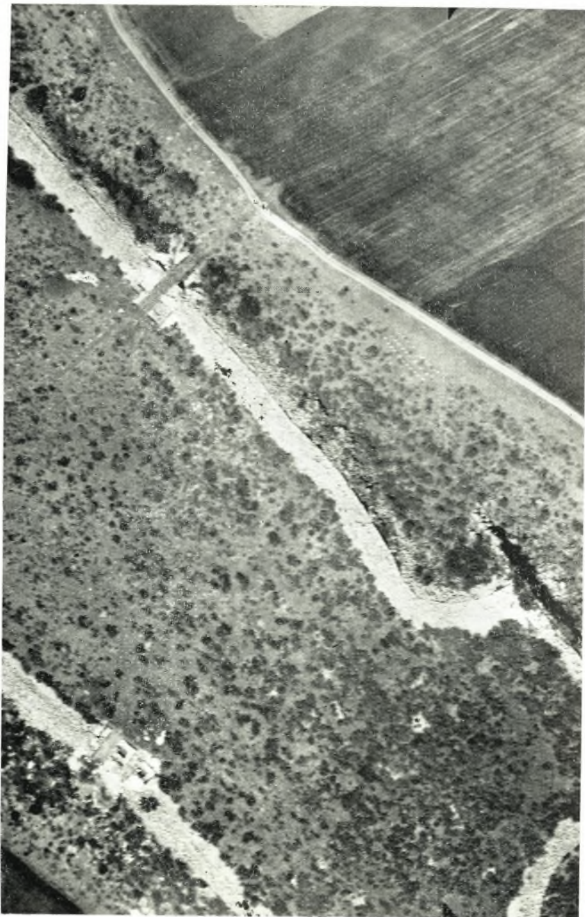
“Αποψη από αεροπλάνου τμημάτων του περιβόλου μετά της Βορείου Πύλης άνω δεξιά και της Διπλής Νοτιοανατολικής άνω άριστερά.