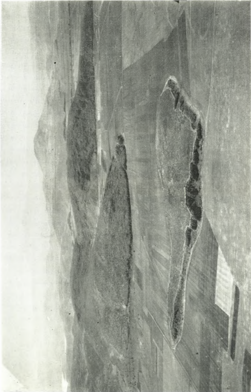
“Αποψις από αεροπλάνου τῆς προϊστορικήσ ἀεροπόλεωσ τῆσ Ἀρνῆσ καθὼσ καὶ τῶν βορείων καὶ τῶν βορειοδυτικῶν ὑπορείων τοῦ Π-ῶου.