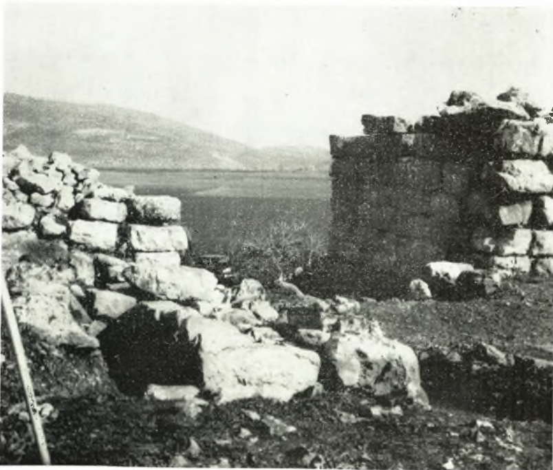
β. Ἡ Βόρειος Πύλη ἀπὸ τῶν Νοτιοδυτικῶν.