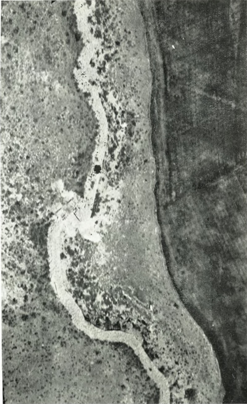
“Αποψής από αεροπλάνου τής μηημειώδους Νοτίας Πύλης μετά τμήματος του περιβάλλου και τής προς Δυσμίας τής αποκαλυφθείσης ἀνηφορικής ὁδοῦ προβολῆς του λόφου ἐντός τής πεδιάδος.