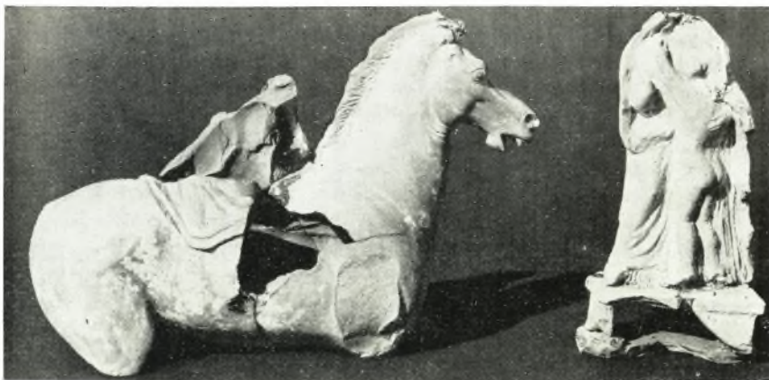
β. Πήλινα ειδώλια έξ αποθέτου ή βόθρου ύπερθεν του μικρού ίερού.