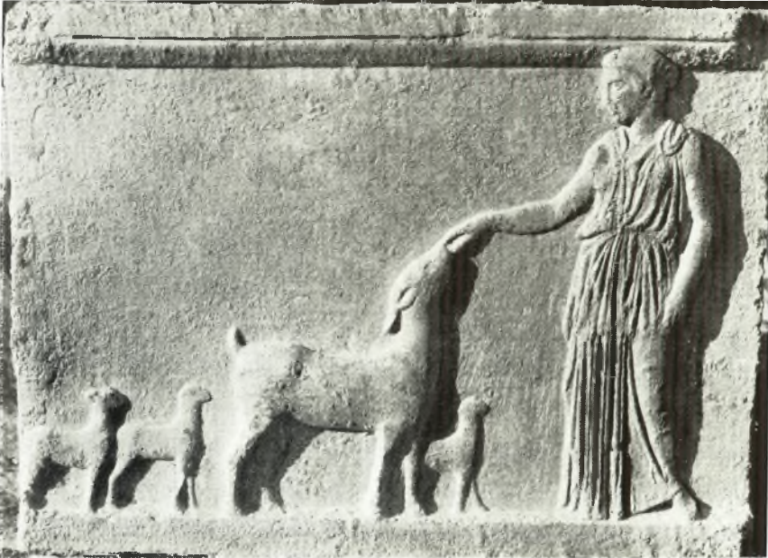
α. Ἀνάγλυφον τοῦ τέλους τοῦ 5ου αἰ. μετὰ παραστάσεως Ἀρτέμιδος καὶ αἰγῶν.