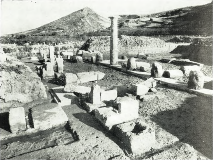
α. Ἀποψις τοῦ στυλοβάτου τῆς Στοᾶς μετὰ τῶν κατωτέρων σφονδύλων τῶν κίονων κατὰ γόρην.