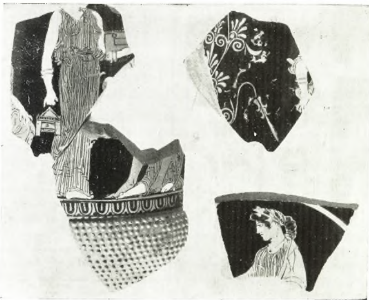
α. Τεμάχια έρυθρομόρφου έπινήτρου έξ αποθέτου ή βόθρου ύπερθεν του μικρού ίερού.