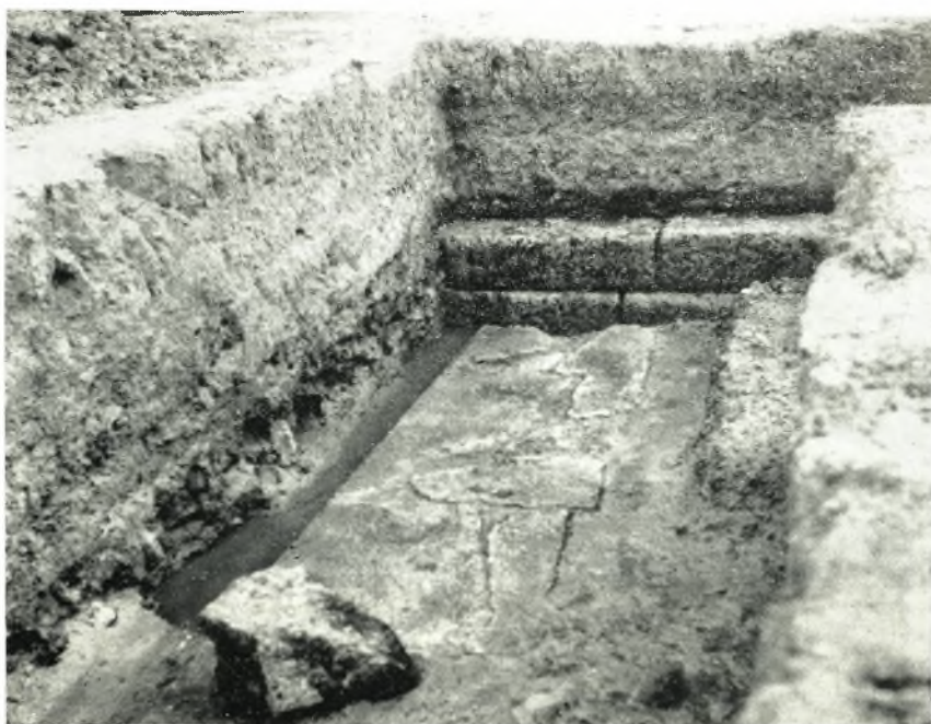
β. Τοίχος ανατολικῶς τοῦ τέρματος τοῦ δυτικῶν σκέλους τῆς Στοᾶς.