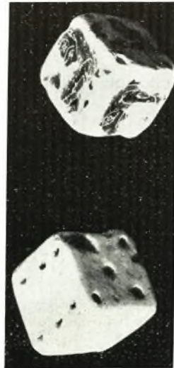
γ. Μελανόμορφοι κύβοι ἐκ τῆς ἐπιχώσεως πρὸς τὸ ἐσωτερικὸν τοῦ τοίχου ἀντιστηρίξεως.