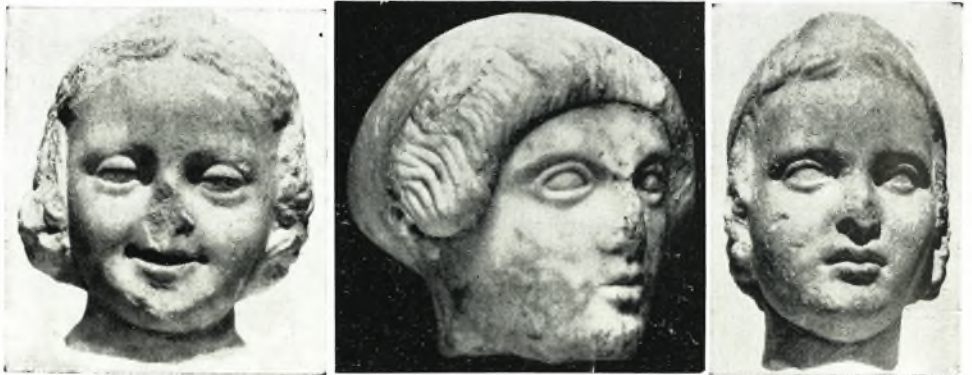
β. γ. δ. Κεφαλὴ ἀρκτων.