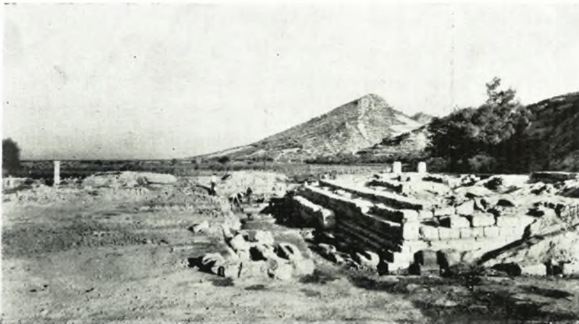
β. Ἀποψὶς τοῦ ναοῦ καὶ τοῦ τοιχοβάτου τοῦ τελευταίου δωματίου τοῦ δυτικῆς σκέλους τῆς Στοῆς.