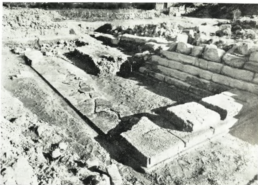
α. Τοίχος ανατολικῶς τοῦ τέρματος τοῦ δυτικῶν σκέλους τῆς Στοᾶς.