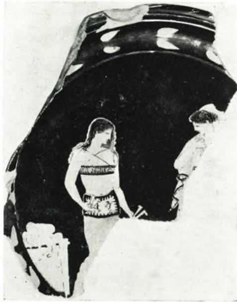
α. Έρυθρόμορφον πινάκιον ἐξ ἀποθέτου ἢ βόθρου ὑπερβεν τοῦ μικροῦ ἱεροῦ.