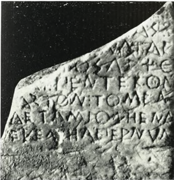
β. Ἐπιγραφή ἐκ τῶν θεμελίων τοῦ τοίχου τοῦ ἀνατολικῶς τοῦ τέρματος τοῦ δυτικῆς σκέλους τῆς Στοᾶς.