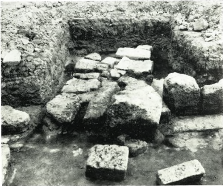
β. Τὸ δάπεδον τῆς εἰσόδου τοῦ δυτικοῦ σκέλους τῆς Στοᾶς.