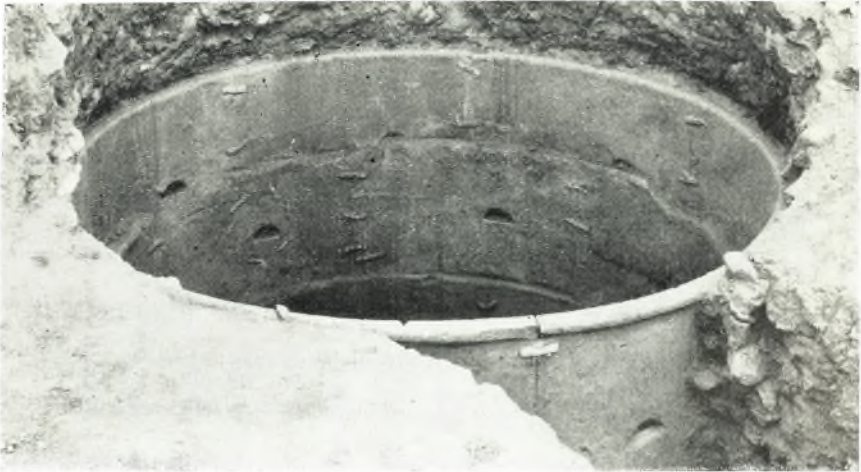
α. Τὸ βορείως τοῦ ἀγροκλήματος τοῦ Δημοσίου ἀποκαλυφθὲν ἀρχαῖον φρέαρ μὲ τὴν πηλὴν τοῦ ἐπένδυσιν.