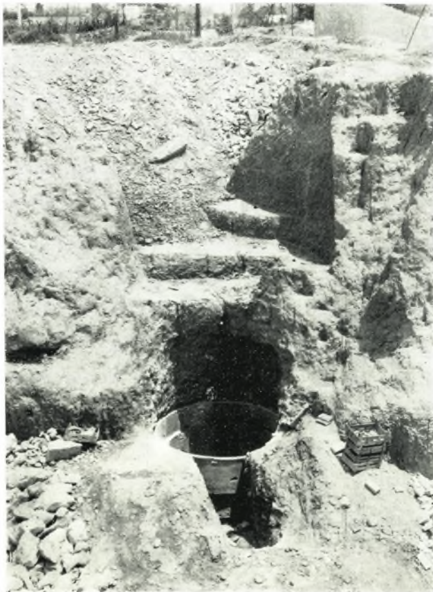
β. Τὸ ἀρχαῖον φρέαρ, μὲ τὴν νοτίως αὐτοῦ ἀνοιχθεῖσαν τάφρον.