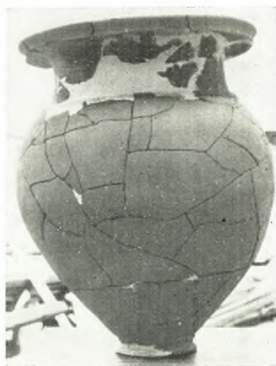
γ. 'Ο ὑπ' ἀριθ. 1 ταφικός κρατηροειδῆς πίθος.