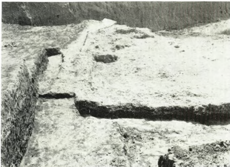
α. Τὸ κατὰ τὴν ὑποθεμελίωσιν τοῦ μόνου σωζόμενου IV ἀρχαίου κτίσματος.