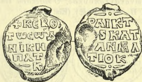
Εἰκ. 2. Σφραγὶς Νικήτα θραίκτωρος καὶ κατεπάνω Ἀντιοχείας.

Ἐμμετροὶ ἐπιγραφαὶ ὑπάρχουσιν ἐπὶ δύο νομισμάτων, ἑνὸς Κωνσταντίνου Θ' τοῦ Μονομάχου (1042-1056) καὶ ἑτέρου Ρωμανοῦ Δ' τοῦ Διογένους (1067-1071), ἀλλ' ἐπὶ μολυβδίνων σφραγίδων (μολυβδοβούλλων) οὐδὲν παράδειγμα ὑπάρχει, ὅπερ νὰ δυνάμεθα νὰ τάξωμεν ἀσφαλῶς εἰς ἐποχὴν προγενεστέραν τῶν Κομνηνῶν. Μέχρι τοῦδε ἀπεδόθησαν σφραγίδες ἔχουσαι ἑμμέτρους ἐπιγραφὰς εἰς χρόνους προγενεστέρους τῶν Κομνηνῶν, ἀλλ' ἡ τοιαύτη ἀπόδοσις, ὀφειλομένη κυρίως εἰς ἀπλὴν ὁμωνυμίαν, οὐδαμῶς δύναται νὰ στηριχθῇ. Ὡς εἶναι γνωστόν, καὶ κατὰ τοὺς βυζαντινοὺς χρόνους ἐπεκράτει τὸ ἔθος νὰ δίδεται εἰς τὸ πρῶτον ἄρρεν τέκνον τὸ ὄνομα τοῦ πάππου, οὕτως ὥστε ἐν τῇ βυζαντικῇ ἱστορίᾳ ἐμφανίζονται πρόσωπα φέροντα τὸ αὐτὸ κύριον ὄνομα καὶ τὸ αὐτὸ ἐπώνυμον ὄνῃγοντα ὅμως εἰς χρόνους διαφόρους. Ἐπομένως εἶναι λίαν ἐπισφαλές νὰ ταυτίζωμεν τοὺς κτήτορας τῶν