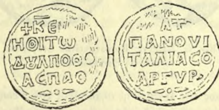
Εἶκ. 4. Σφραγὶς Πόθου Ἀργυροῦ κατεπάνω Ἰταλίας.

η) Εἰς τὴν ἐξέλιξιν τῶν ἐμμέτρων ἐπιγραφῶν παρατηρεῖται ὅτι πρῶτον ἐμφανίζονται αἱ ἀποτελούμεναι ἐξ ἑνὸς στίχου τριμέτρον λαμβικῶν, εἶτα δέ, προϋόντος τοῦ χρόνου, κατὰ τὸ δεύτερον ἡμισυ τῆς δωδεκάτης ἑκατονταετηρίδος καὶ τὴν δεκάτην τρίτην, ἐμφανίζονται αἱ μακρότεραι ἔμμετροι, ἀποτελούμεναι ἐκ δύο στίχων καὶ ἐνίοτε ἐκ τριῶν. Σφραγίδες ἔχουσαι δύο στίχους τριμέτρους λαμβικοὺς ἀπεδόθησαν εἰς τὰ τέλη τῆς ΙΑ' ἢ τὰς ἀρχάς τῆς ΙΒ' ἑκατονταετηρίδος ὑπὸ τοῦ Schlumberger καὶ ἄλλων, πλὴν ἢ τοιαύτη ἀπόδοσις ἀφείλεται εἰς ἀπλὴν ὁμωνυμίαν τῶν κτητόρων τῶν σφραγίδων πρὸς πρόσωπα γνωστὰ ἐξ ἄλλων πηγῶν. Ὡς δὲ καὶ ἀνωτέρω εἵπομεν, εἶναι