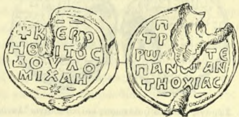
Εἰκ. 3. Σφραγὶς Μιχαὴλ πατρικίου καὶ κατεπάνω Ἀντιοχείας.

3) Ἡ σφραγὶς τοῦ Πόθου Ἀργυροῦ, κατεπάνω Ἰταλίας κατὰ τὰ ἔτη 1032 - 1034 (Κ. Κωνσταντοπούλου, Ὁ κατεπάνω Ἰταλίας Πόθος Ἀργυρός. Βυζαντις τόμ. Β'. σελ. 397 κἑξ.). (Εἰκ. 4).