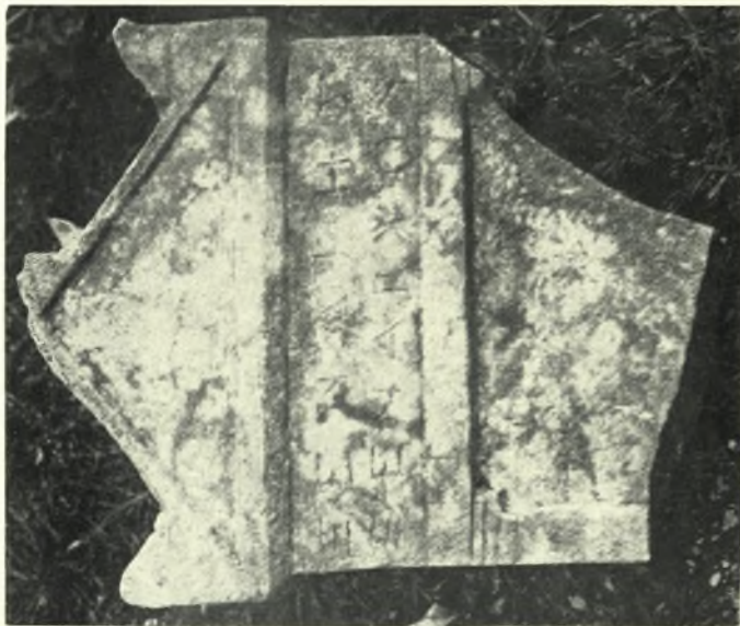
Εύβοια: α. Ἐπιτύμβιος στήλη ἐκ Μαντουδίου, β. Ἡμίεργος ἀρχαϊκὴ Κόρη ἐξ Ἐρετρίας, γ. Κορινθιακὸν κιονόκρανον ἐκ Χαλκίδος