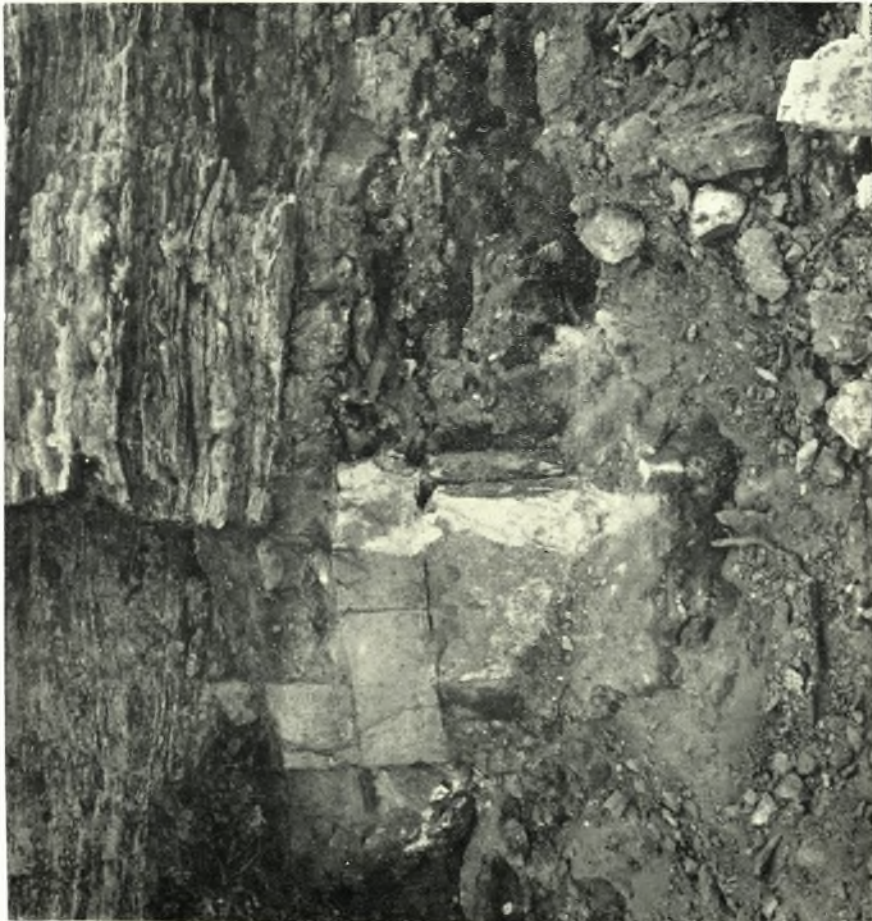
Εύβοια. Αϊδηψός: α. Ρωμαϊκόν κτήριο, β. Μέγα ανάγλυφον με παράστασιν λεοντῆς καὶ ὄφεως