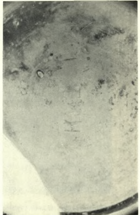
Theben. Kabirenheiligtum: a. Opfergruben von Osten, b. Schälchen; mittlere Opfergrube, c. Kabirennapf; aus Fundament bei oberer Opfergrube