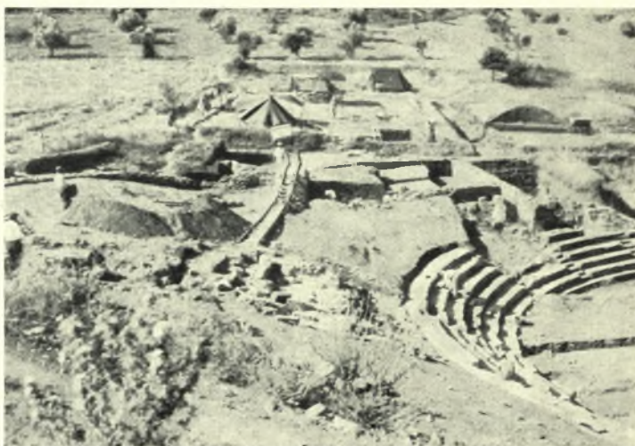
Theben. Kabirenheiligtum: a. Cavea, Nord- und Osthang, b. Cavea von Nord nach Süd