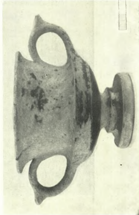
Theben. Kabirenheiligtum: a - b. Astragal förmiges Bronzebüchsen aus dem Nordteil des oberen Theaterranges, c - d. Kantharoi; Fundament bei oberer Opfergrube