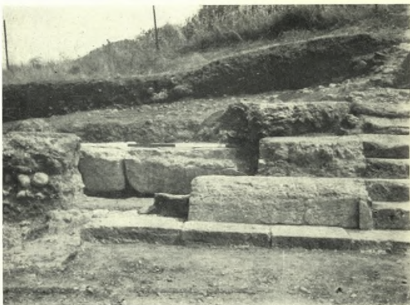
Theben. Kabirenheiligtum: a. Röm. und hell. Nordanalemma von Norden, b. Ältere Grenzmauer hinter (und unter) den Sitzstufen im Norden