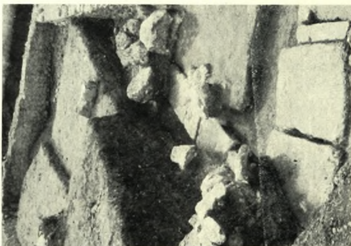
Theben. Kabirenheiligtum: a. Hell. Mauer im Südteil des Theaters und «Kanal», b. Theatersüdhalfe, Stichmauer über hell. Mauer, c. Wiederverwendeter Stein als Deckstein des Kanals