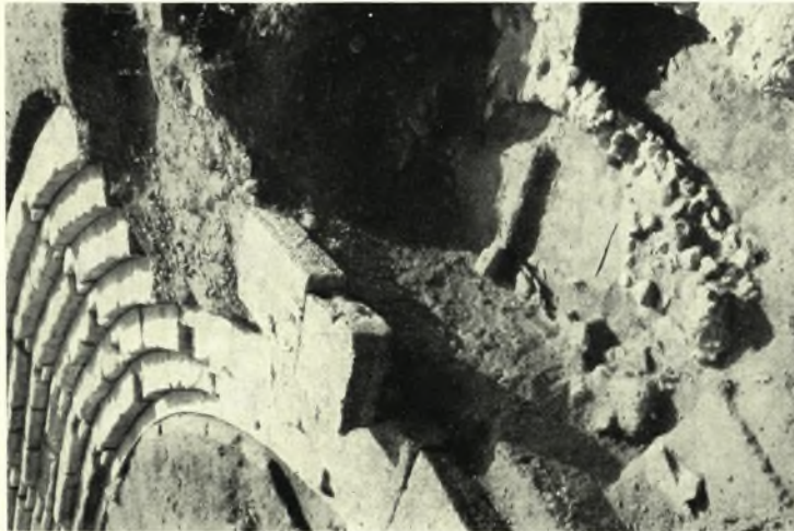
Theben. Kabirenheiligtum: a. Älterer Ofier unter hell. Cavea, b. Brunnen westl. des «Kellers»