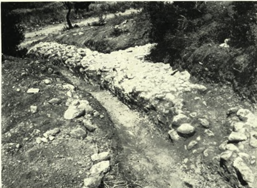
Theben. Kabirenheiligtum: a. Röm. Umfassungsmauer des Theaters mit Nische und älteren Resten, b. Röm. Umfassungsmauer, Nordseite. Im Hintergrund Autoweg