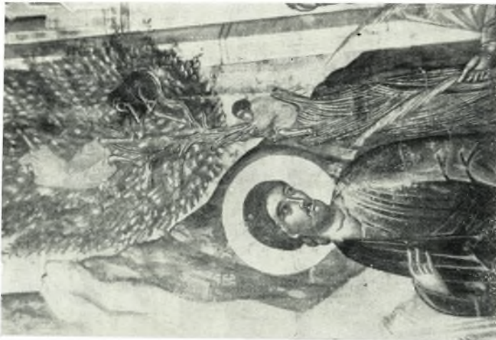
α. Λεπτομέρεια ἐκ Βαϊθόρου φορητῆς εἰκόνης τοῦ Ἁγ. Πλάτωνος Χώρας Ἀμοργοῦ τέλους 17 ου αἰ.