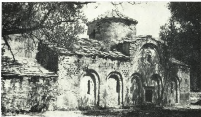
α. "Άγιοι Ἀπόστολοι εἰς Χαλκί (Τραγαίτας) Νάξου. Νοτιά ἄποψις.