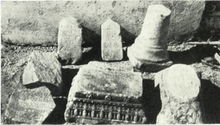
α. Παλαιοχριστιανικαὶ ἐπιγραφαὶ καὶ ἀρχιτεκτονικὰ μέλη ἐκ Καταπύλων Ἀμοργοῦ.