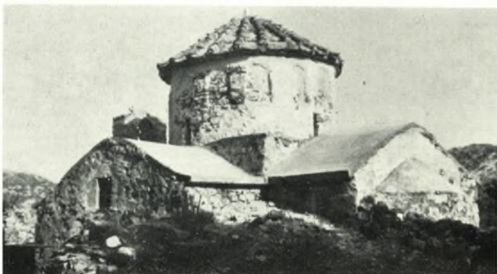
β. Περιοχὴ Τραγαίας Νάξου. Ἡ Δαμιώτισσα.