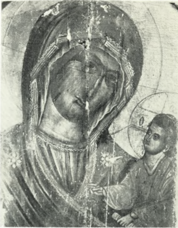
α. Φορητή εικών τῆς Θεοτόκου τοῦ 17ου αἰῶνος ἀποκειμένη εἰς τὸν ναὸν τῆς «Παναγίας τοῦ Χριστοῦ» ἐν Νάξῳ.