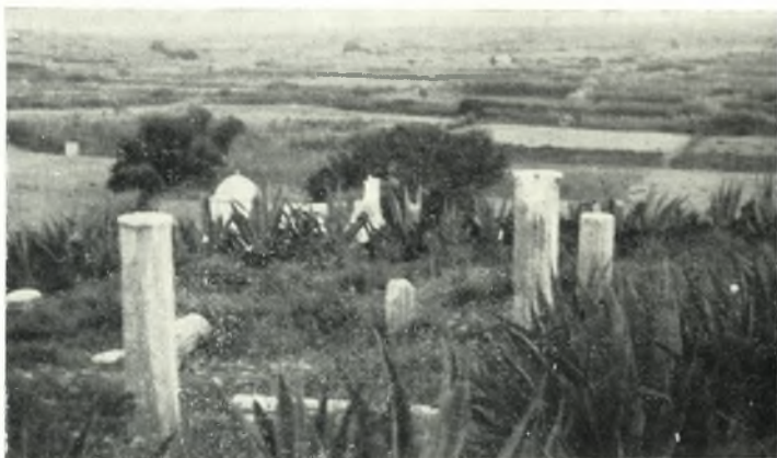
α. Ἐρείπια τῆς βασιλικῆς τοῦ Ἁγίου Στεφάνου εἰς Νάξον.