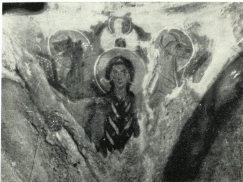
β. Τετράμορφον. Τοιχογραφία σφαιρικοῦ τριγώνου τοῦ τρούλλου τοῦ ναοῦ Ἁγ. Νικολάου εἰς Σαγκρί Νάξου.