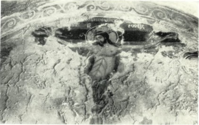
α. Ἡ Σταύρωσις. Ἐκ τοῦ ναοῦ Ἁγ. Νικολάου εἰς Σαγκρι Νάξου.