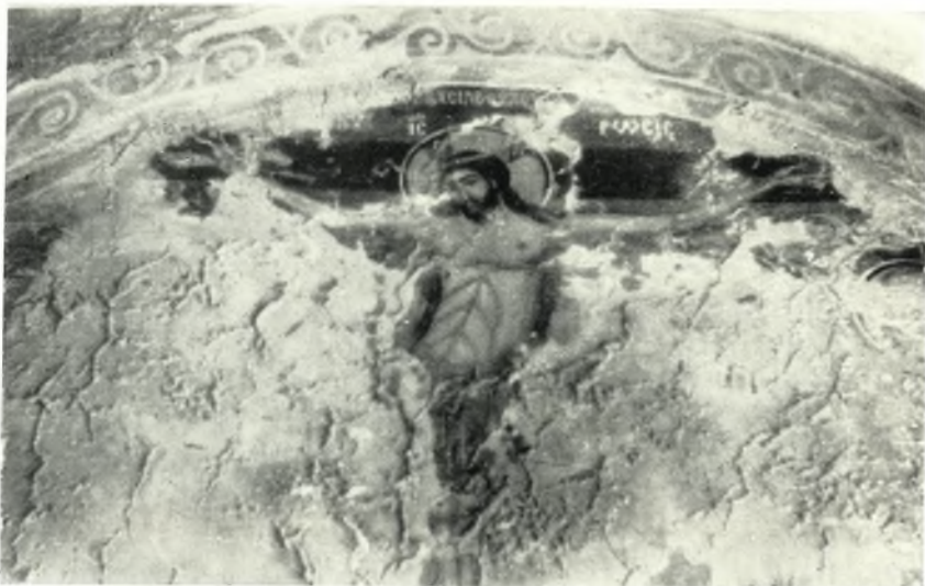
α. Ἡ Σταύρωσις. Ἐκ τοῦ ναοῦ Ἁγ. Νικολάου εἰς Σαγκρί Νάξου.