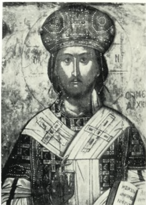
α. Ὁ Μέγας Ἀρχιερεύς. Εἰκὼν ἀρχῶν 18ου αἰῶνος ἐξ Ἀγ. Παρασκευῆς Νάξου.