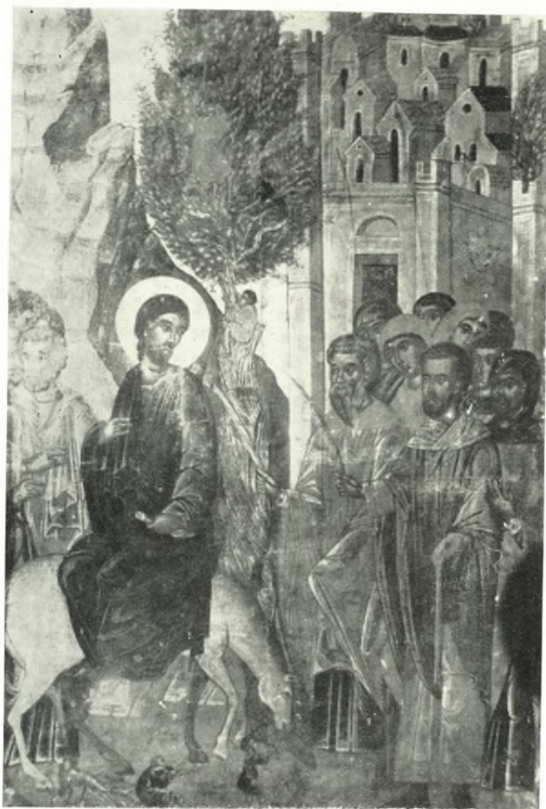
Ἡ Βαΐφόρος. Εἰκὼν τέλους 17ου αἰ. ἐκ τοῦ ναοῦ Ἁγίων Πάντων Χώρας Ἀμοργοῦ.