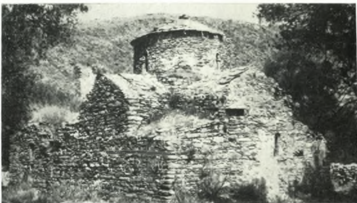
γ. Ὁ Ἅγιος Γεώργιος ὁ Διασφορέτης εἰς Τραγαίαν Νάξου.