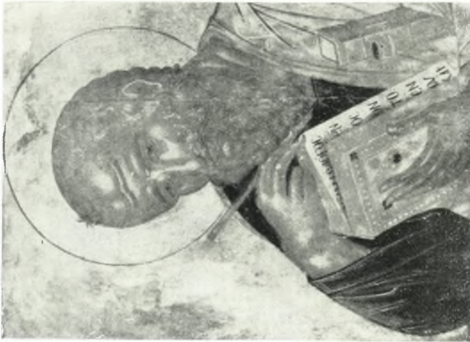
α. Νάξος Παναγίας του Χριστού. — 1 ο . Θεολόγος (17ος α.ι.).