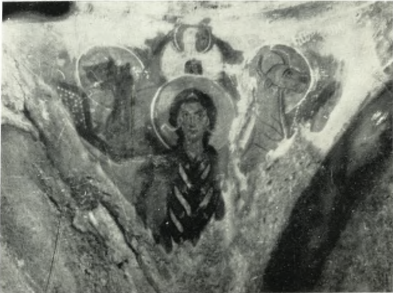
β. Τετράμορφον. Τοιχογραφία σφαιρικοῦ τριγώνου τοῦ προύλλου τοῦ ναοῦ Ἁγ. Νικολάου εἰς Σαγκρι Νάξου.