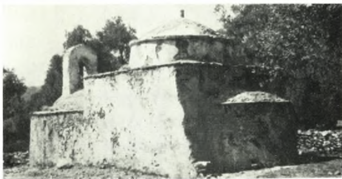
β. "Αγ. Ἰωάννης. Μονόκλιτος τρουλλαῖος ναὸς με ἐλλειψοειδῇ τροῦλλον εἰς Κεραμί Νάξου.