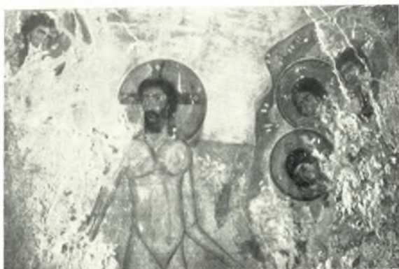
α. Ἡ Βάπτισις. Ἐκ τοῦ ναοῦ Ἀγ. Νικολάου εἰς Σαγκρί Νάξου.