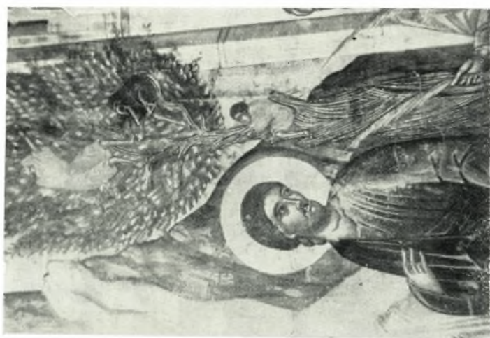
α. Λεπτομέρεια ἐκ Βαϊφόρου φορητῆς εἰκόνης 0,90 X 0,67 ναοῦ Ἁγ. Πάντων Χώρας Ἀμορ- γοῦ τέλους 17 ου αἰ.