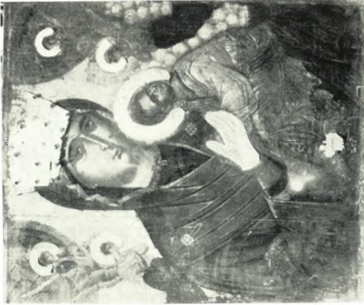
β. Ἡ Παναγία τοῦ Πάθους, Εἰκὼν ἐν τῷ ναῷ Μεταμορφώσεως καὶ Ἁγ. Στεφάνου Χώρας Ἀμοργοῦ (εἰς τοὺς Ἁγγέλους καὶ τὰ νέφη ὄρουσιν ἐπιδραστή).