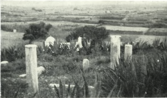
α. Ἐρείπια τῆς βασιλικῆς τοῦ Ἁγίου Στεφάνου εἰς Νάξου.