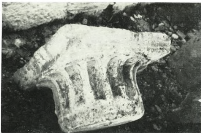
β. Κιονόκρανον τῆς βασιλικῆς τῶν Καταπόλων.