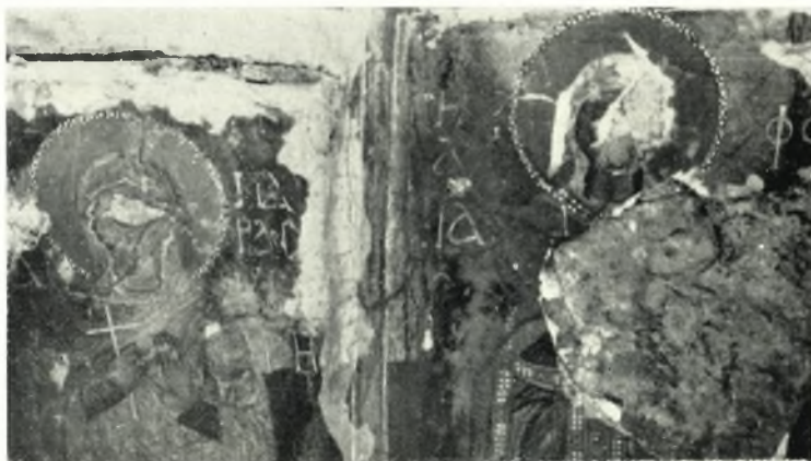
α. Αἱ Ἁγίαι Παρασκευὴ καὶ Φωτεινὴ ἐκ τοῦ ναοῦ τῆς Θεοτόκου (Θεοσκέπαστος) Ἀπυράθου Νάξου.