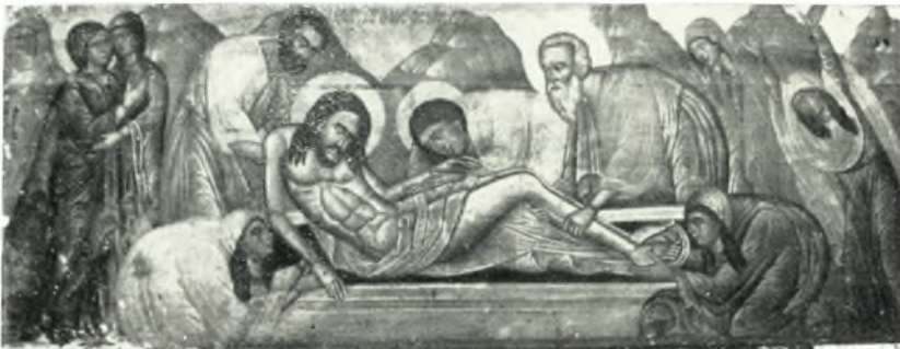
β. Ὁ ἐπιτάφιος. Εἰκὼν 17ου - 18ου αἰῶνος ἐκ τοῦ ἐν Χώρα Νάξου ναοῦ τῆς «Παναγίας τοῦ Χριστοῦ».