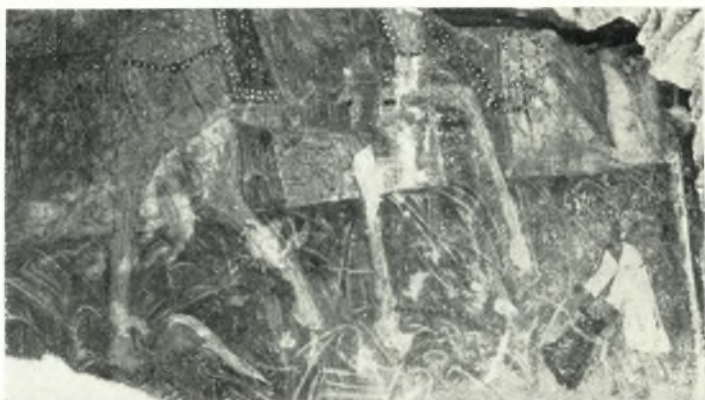
β. Τμήμα τῆς Βαΐφόρου ἐκ τοῦ ἐρειπωθέντος ναοῦ τῆς Θεοτόκου παρὰ τὴν Ἀπύραθον.