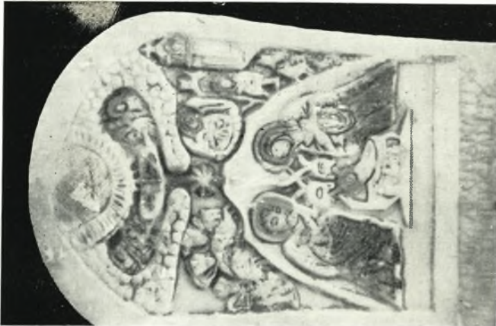
α. 'Ανάγλυφος εἰκὼν τῆς Γεννήσεως τοῦ Χριστοῦ ἐκ Νάξου (19ος αἰ.).