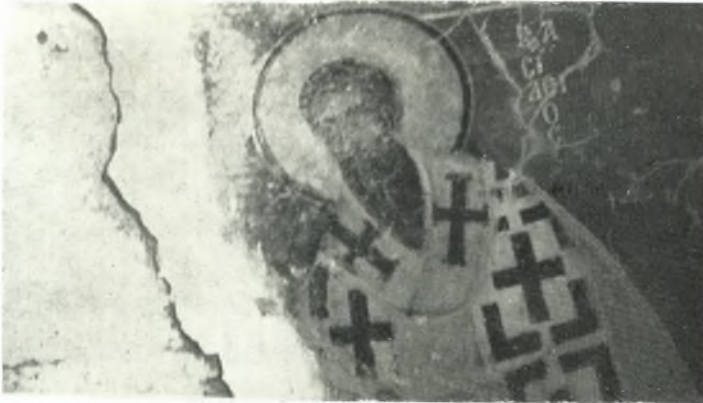
β. Ὁ Μ. Βασιλεῖος. Ἐκ τοῦ ναοῦ Ἁγ. Νικολάου εἰς Σαγκρι Νάξου.