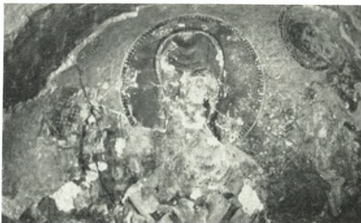
β. Δαμιώτισσα Νάξου. "Άγιος Νικόλαος μετὰ ξὺν Ἰ. Χριστοῦ καὶ Θεοτόκου.