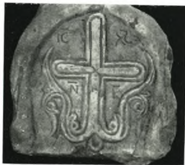
γ. Γλυπτὸν ἐκ Νάξου.