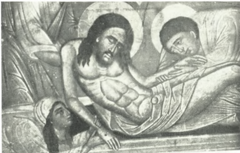
α. Λεπτομέρεια τῆς ἀναγλύφου εἰκόνης.