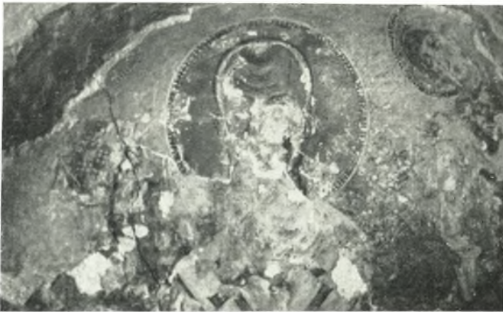
β. Δαμιώτισσα Νάξου. "Άγιος Νικόλαος μεταξύ 'Ι. Χριστοῦ καὶ Θεοτόκου.