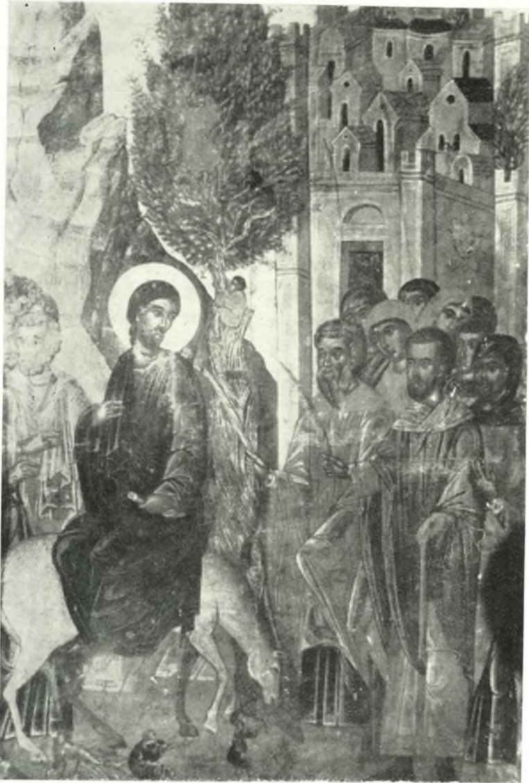
Ἡ Βαῖφόρος. Εἰκὼν τέλους 17ου αἰ. ἐκ τοῦ ναοῦ Ἁγίων Πάντων Χώρας Ἀμοργοῦ.