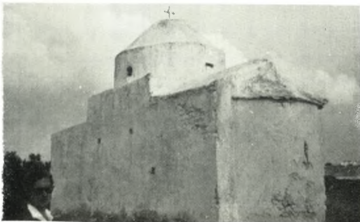
γ. "Άγιος Νικόλαος εἰς Συχκρί Νάξου.