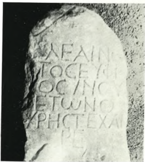
β. Χριστιανικὴ ἐπιγραφή 4ου αἰ. ἐξ Ἀμοργοῦ.