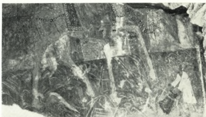
β. Τμήμα τῆς Βαϊφόρου ἐκ τοῦ ἐρειπωθέντος ναοῦ τῆς Θεοτόκου παρὰ τὴν Ἐπιπέδον.