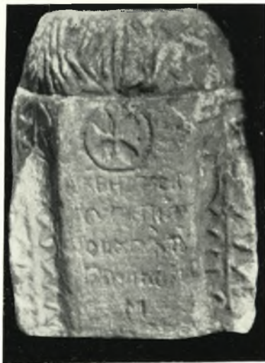
γ. Χριστιανικὸν κιονόκρανον ἐκ Χώρας Ἀμοργοῦ.