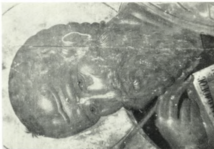
β. Νάξος. Νάος Παναγίας τοῦ Χριστοῦ — Ἰω. Θεολόγος — Αἰπομένηνα κερνήτης.