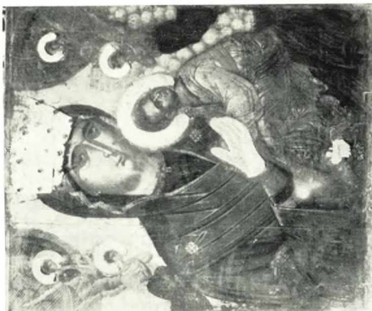
β. Ἡ Παναγία τοῦ Πάθους. Εἰκὼν ἐν τῷ ναῷ Μεταμορφώ- σεως καὶ Ἁγ. Στεφάνου Χώρας Ἀμοργοῦ (εἰς τοὺς Ἁγίλους καὶ τὰ νέφη δορυμενὴ ἐπιδρασίς).