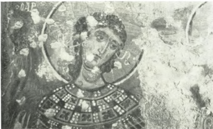
γ. Ὁ Ἀρχάγγελος Μιχαήλ. Ἐκ τοῦ ναοῦ Ἁγ. Νικολάου εἰς Σαγκρι Νάξου.