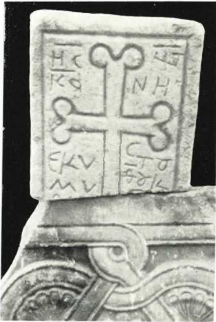
β. Ἐπιτάφιον σῆμα καὶ τμήμα θωρακίου ἐκ τῶν περισυλλεγέντων γλυπτῶν τῆς περιοχῆς Τραγαίας-Νάξου.