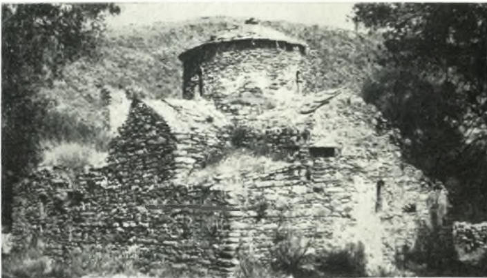
γ. Ὁ Ἅγιος Γεώργιος ὁ Διασπορείτης εἰς Τραγαίαν Νάξου.