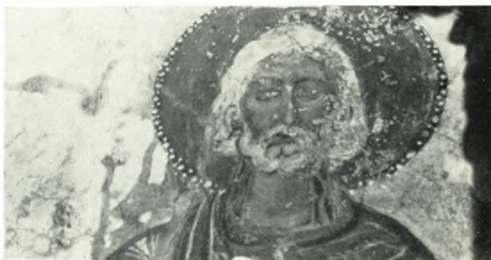
γ. Μάρτυς. Ἐκ τοῦ ἄνωτέρου ναοῦ τῆς Θεοτόκου.