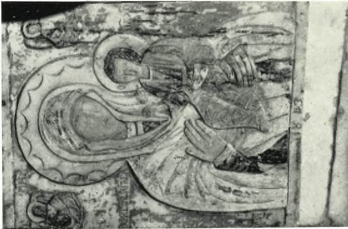
β. Θεοτόκος, Ἀνάγλυφος εἰκὼν 19ου αἰῶνος ἐκ Νάξου.