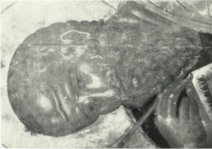
β. Νάξος. Νάος Παναγίας του Χριστού — 1 ο . Θεολόγος — Αετομέρεια κεφαλής.