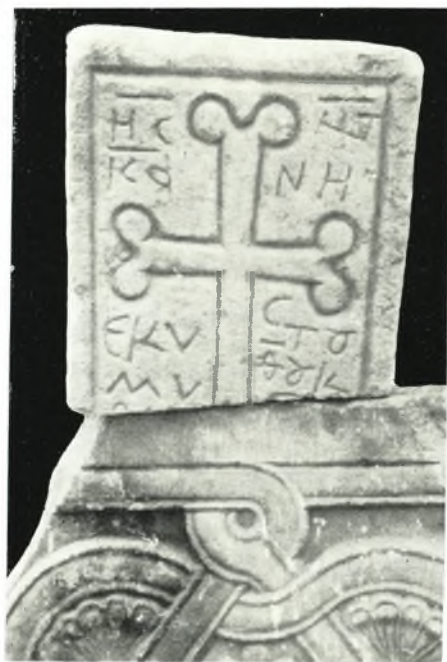
β. Ἐπιτάφιον σῆμα καὶ τμήμα θωρακίου ἐκ τῶν περισυλλεγέντων γλυπτῶν τῆς περιοχῆς Τραγαίας-Νάξου.