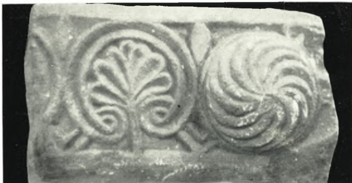
α. Γλυπτὸν ἐκ τῆς περιοχῆς Νάξου.