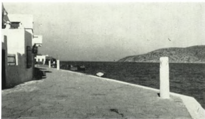
α. Κίονες τῆς παλαιοχριστιανικῆς βασιλικῆς τῶν Καταπόλων Ἀμοργοῦ τοποθετημένοι εἰς τὴν προκυμαίαν.