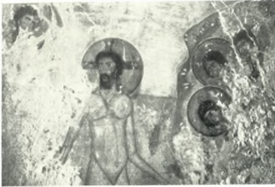
α. Ἡ Βάπτισις. Ἐκ τοῦ ναοῦ Ἁγ. Νικολάου εἰς Σαγκρι Νάξου.