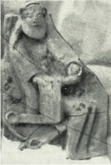
α. Πήλινον ανάγλυφον εικονίζον καθήμενον θεόν.