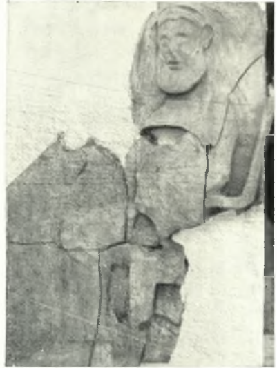
β. Πήλινον ανάγλυφον ἐνθρόνου θεοῦ ἐξ Ἀμυκλῶν.