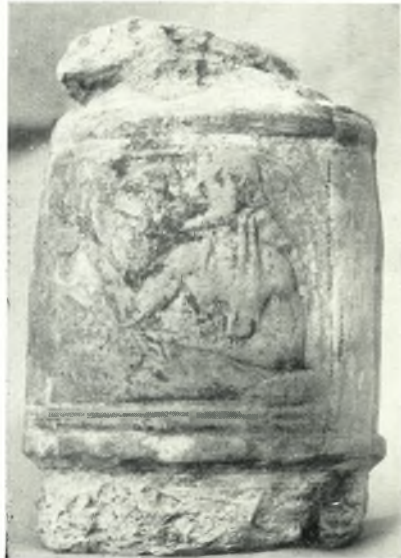
γ. Πήλινον ἀντικείμενον μετὰ παράστασιν Διονύσου καὶ Σατύρου.