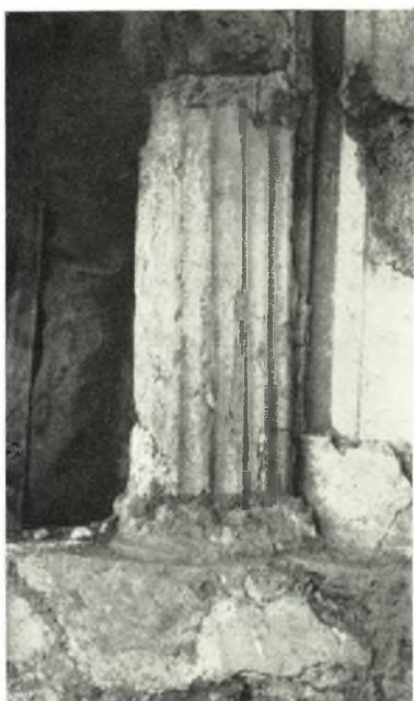
α. Λεπτομέρεια τοῦ τρίτου ἐξ ἀριστερῶν ἡμικίονος τοῦ ἄνω ὀρόφου.