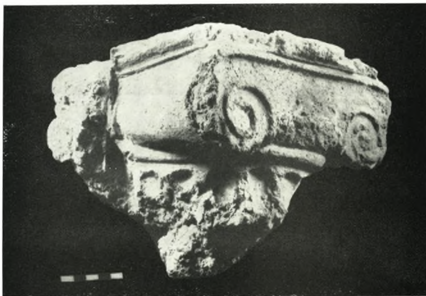
γ. Κιονόκρανον ἡμικίονος τοῦ ἄνω ὀρόφου.