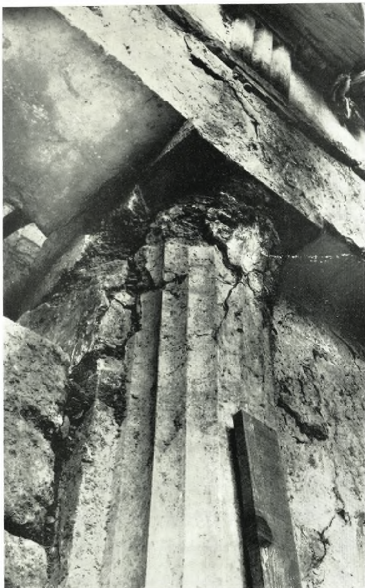
Λεπτομέρεια τῆς προσόψεως παρὰ τὴν ἄνω δεξιὰν γωνίαν τῆς εἰσόδου.