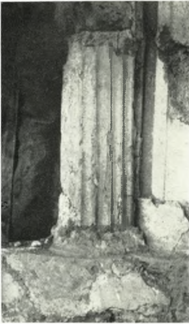
α. Λεπτομέρεια του τρίτου εξ αριστερών ήμικλιονος του άνω όρόφου.