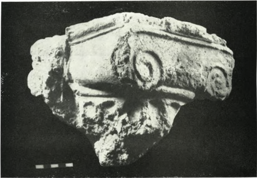
γ. Κιονόκρανον ήμικλιονος του άνω όρόφου.