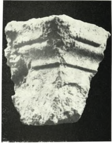
β. Άνευρεθέν τμήμα επικράνου του άνω όρόφου.