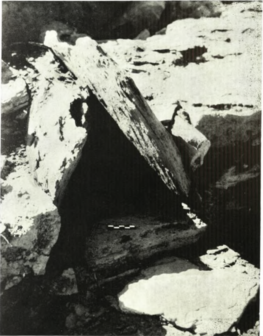
Όγκτος εις τόν τοίχον μεταξύ του δωματίου J1 και του διαδρόμου J3.