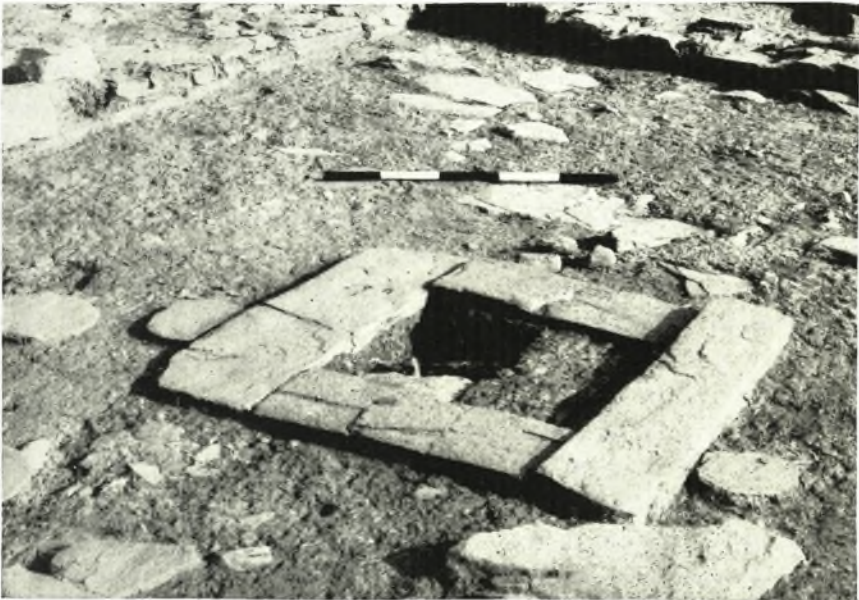
β. Ἡ ἐστία τοῦ δωματίου Η41.