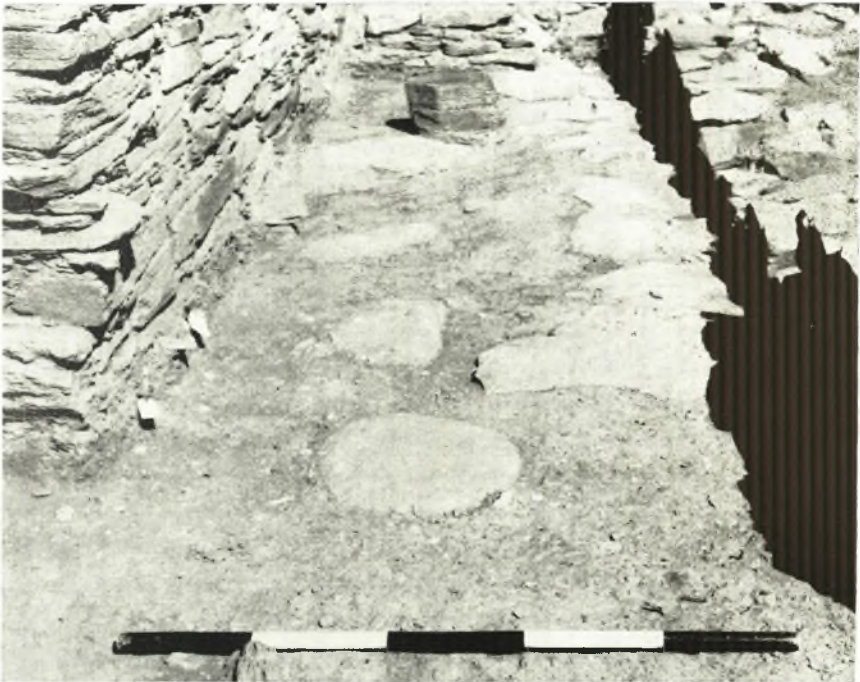
α. Λιθίνη βάσεις ξυλίνου κίονος εις την αποθήκην Η27. *Αποψις από Δυσμῶν.