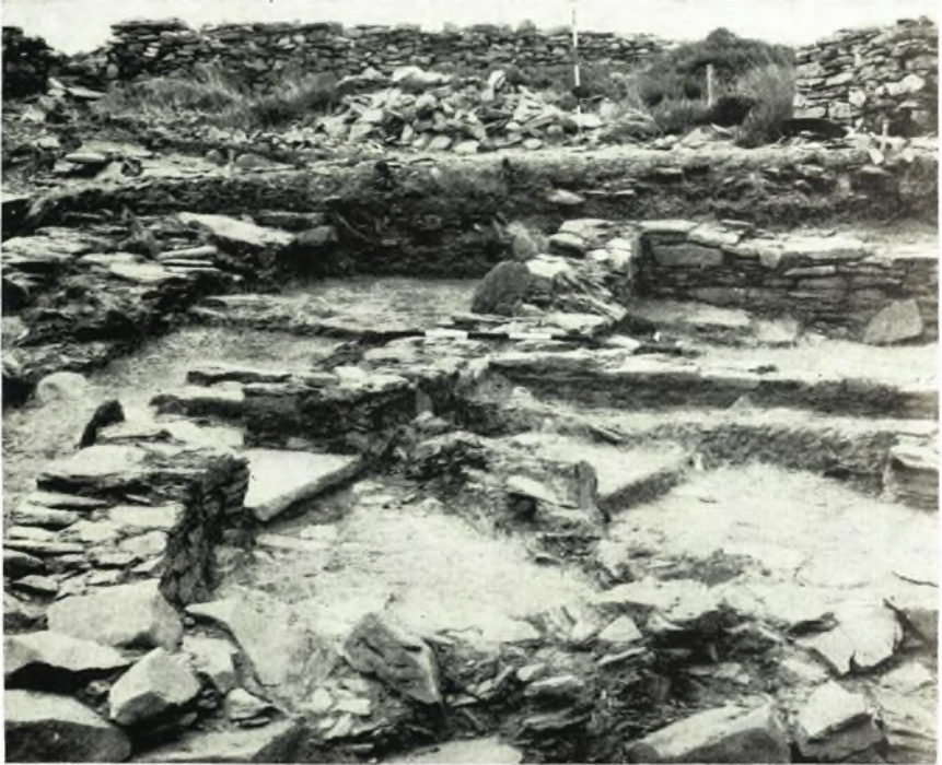
α. Τὰ δωμάτια J4 καὶ J5 καὶ ὁ διάδρομος J3. ᾿Αποψὶς ἀπὸ ᾿Ανατολῶν.