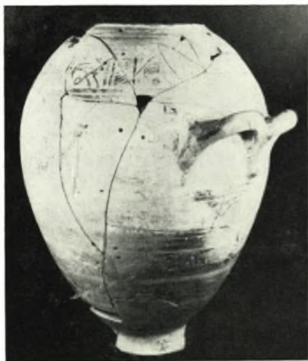
α. Γεωμετρικόν ἀγγεῖον εὑρεθὲν ἐπὶ τοῦ δαπέδου τοῦ δωματίου J5.