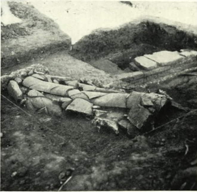
α. Κεραμοσκεπής τάφος υπεράνω του ἐν πίνακι 93β ὕδαταγωγού.