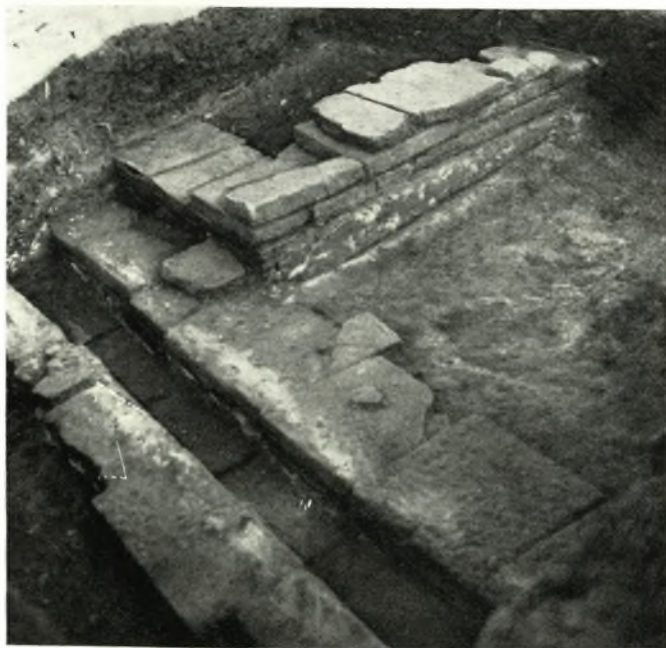
β. Τὸ βόρειον τμήμα τοῦ ἐν πίνακι 92α κτίσματος μετὰ παρακειμένων τοίγων ἐτέρων κτισμάτων τοῦ ὕδαταγωγοῦ.