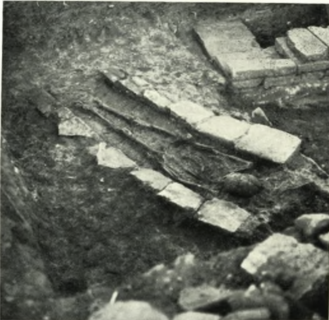
β. Ὁ ἐν πίνακι 93α τάφος μετὰ τὴν ἀποκάλυψιν αὐτοῦ.