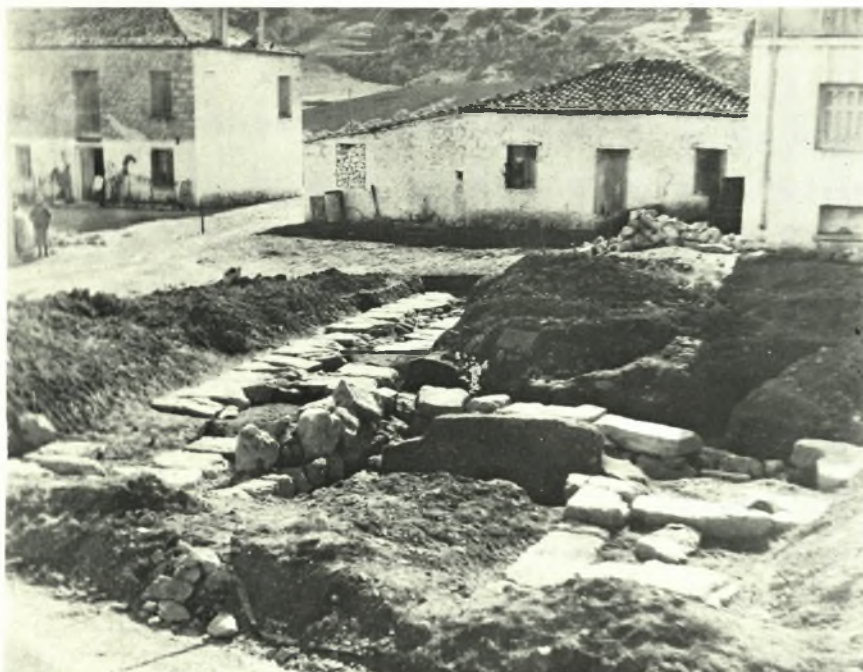
Φωκίς : α. Κίρρα. Πλατεία Έμποροπανηγύρεως. Α. μακρός τοίχος, β. Δίστομον. Οικόπ. Γαμβρίλη. Άποψις άνασκαφής