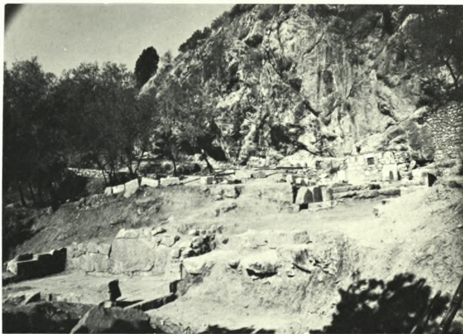
Φωκίς : α. Ἐπιτόμβιον ἀνάγλυφον ἐκ Τριταίας, β. Δελφοί. Κρήνη Κερνά