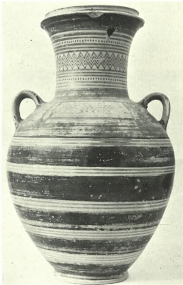
Ἀττική : α. Ἀργυρούπολις. Ἀεροπορική μονάς 129 Π.Υ. Γεωμετρικός σκύφος ( τάφος Ι ), β. Γεωμετρικός ἀμφορεύς ( τάφος ΙΙ )