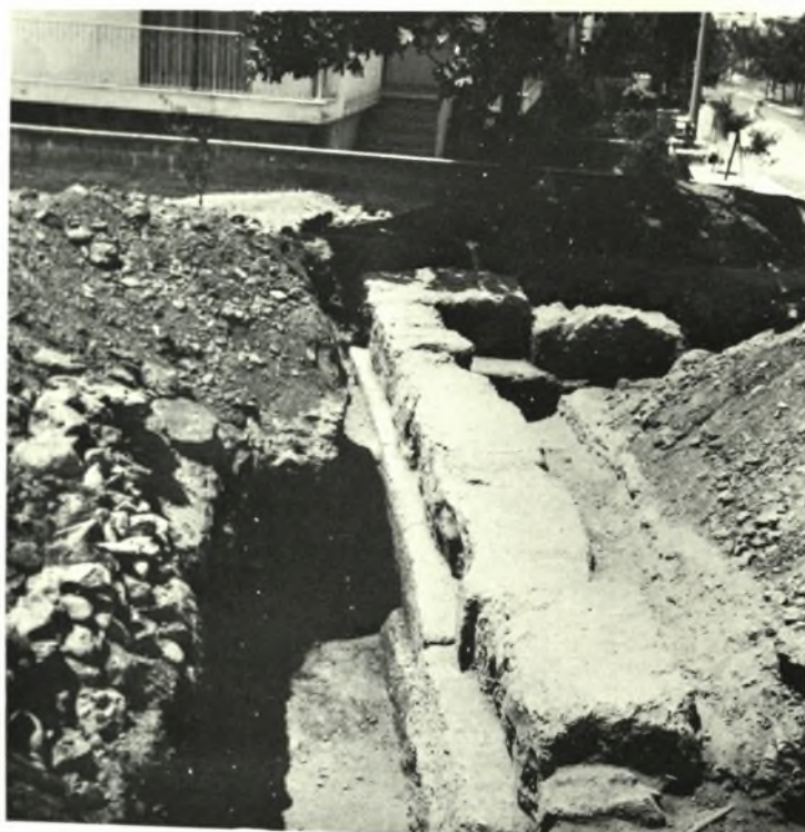
*Αργυρούπολις. *Οδός Κουμουνδούρου και Λακωνίας : α. Ήσωτερική γωνία οικόδομήματος και λιθόστρωτον δάπεδον, β. Ή τοίχος 2