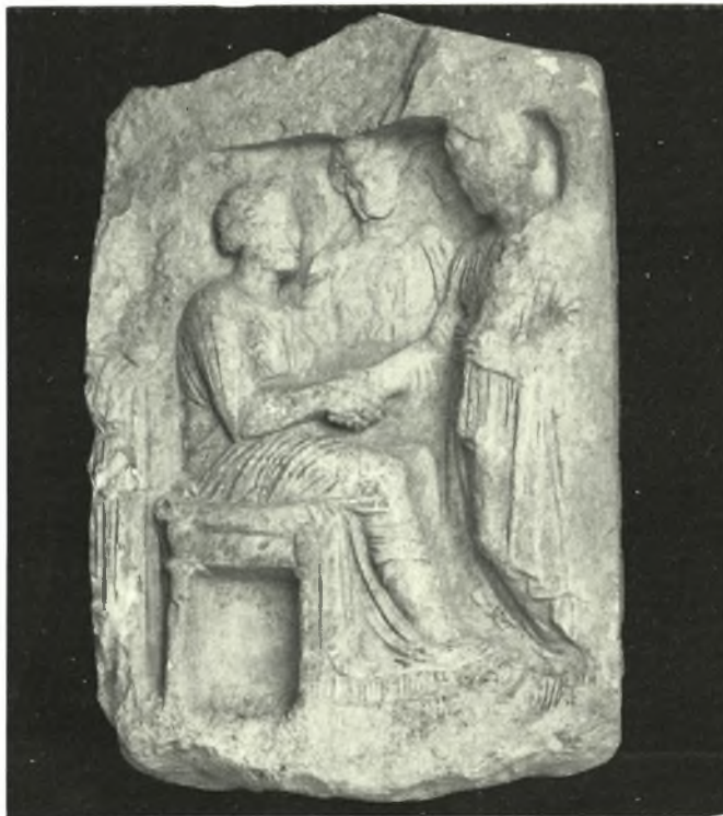
Ἀττική : α. Καλλιθέα. Ὁδὸς Ματζαγριωτάκη 81. Ἀπότμημα ἐπιτυμβίου στήλης, β. Γραμματικόν. Ἀπότμημα ἐπιτυμβίου στήλης, γ. Καλλιθέα. Ὁδὸς Κολοκοτρώνη. Ἐπιτύμβιος στήλη