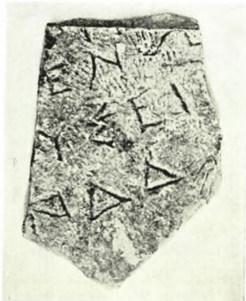
α-β. Σχέδια βάσει εκτύπου των υπ' αριθ. Ια και Ιβ όρων, γ. Φωτογραφία του υπ' αριθ. ΙΙ τεμαχίου όρου (Σχέδια και φωτογραφία κ. Λέλας Κανελλοπούλου)