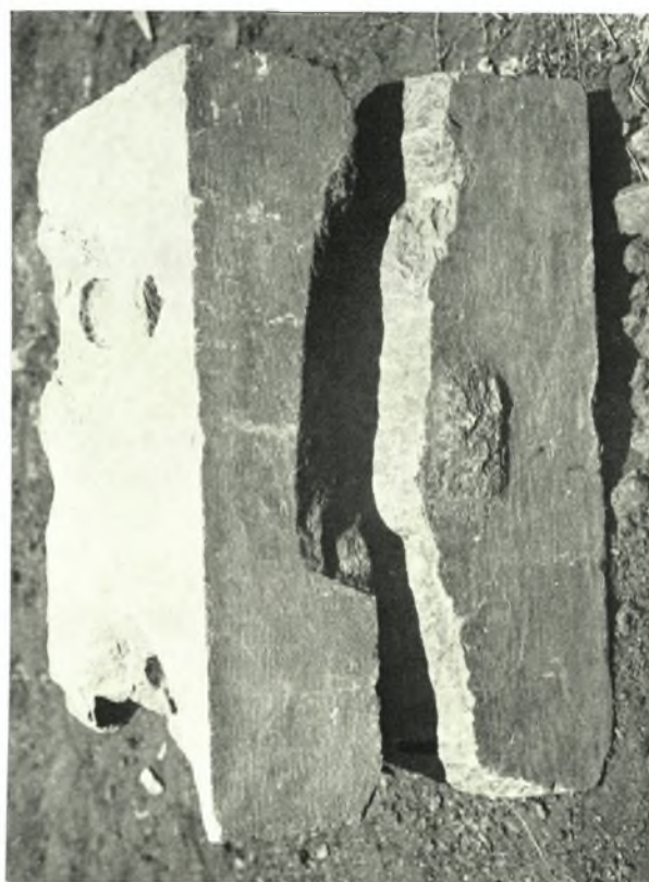
α. Ὅπισθια ὄψις τοῦ βέλθρου ἐξ Ἐρετρίας, β. Τὸ βέλθρον ἀνδριάντος ἐξ Ἐρετρίας